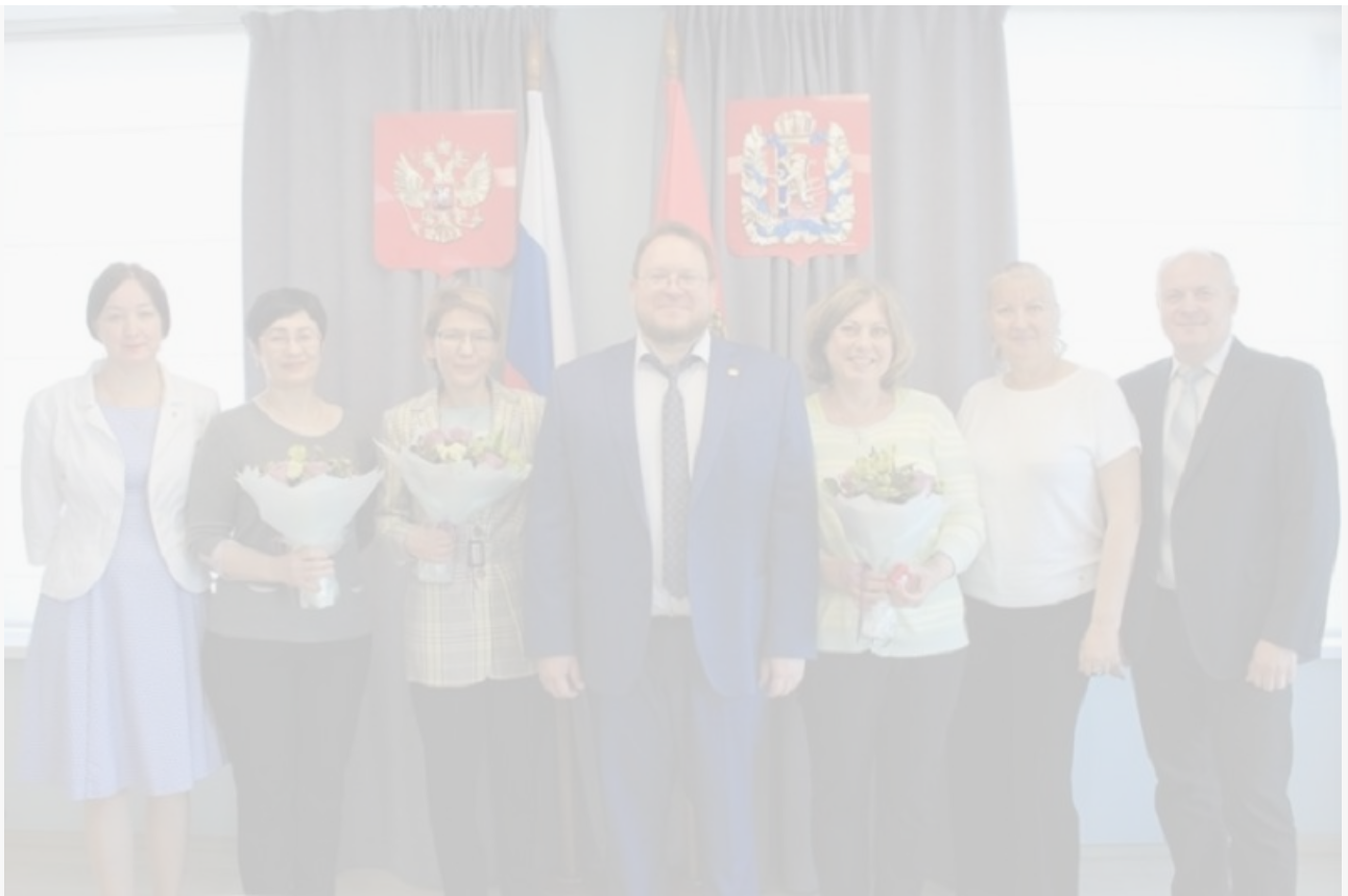
Сотрудники Счётной палаты на награждении нагрудными знаками «За выслугу лет на службе Красноярскому краю»