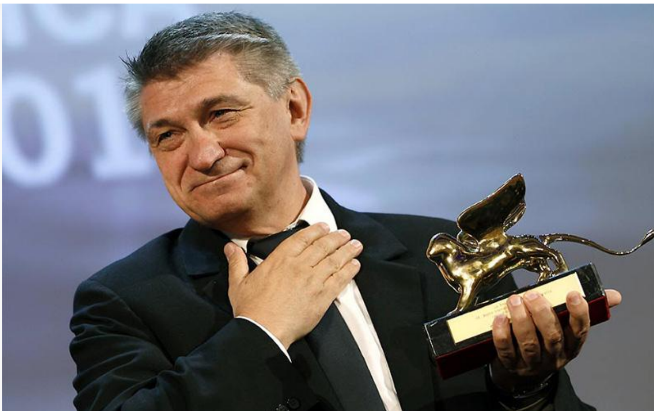
С «Золотым львом» Венецианского кинофестиваля, 2011 год

14 июня 70-летний юбилей отмечает великий российский кинорежиссёр и сценарист, кавалер офицерского креста ордена Искусств и литературы и ордена Восходящего солнца, лауреат «Золотого льва» Венецианского кинофестиваля, трёх Государственных премий России, премий Европейской киноакадемии, ТЭФИ и «Ника», заслуженный деятель искусств России, народный артист России Александр Сокуров.