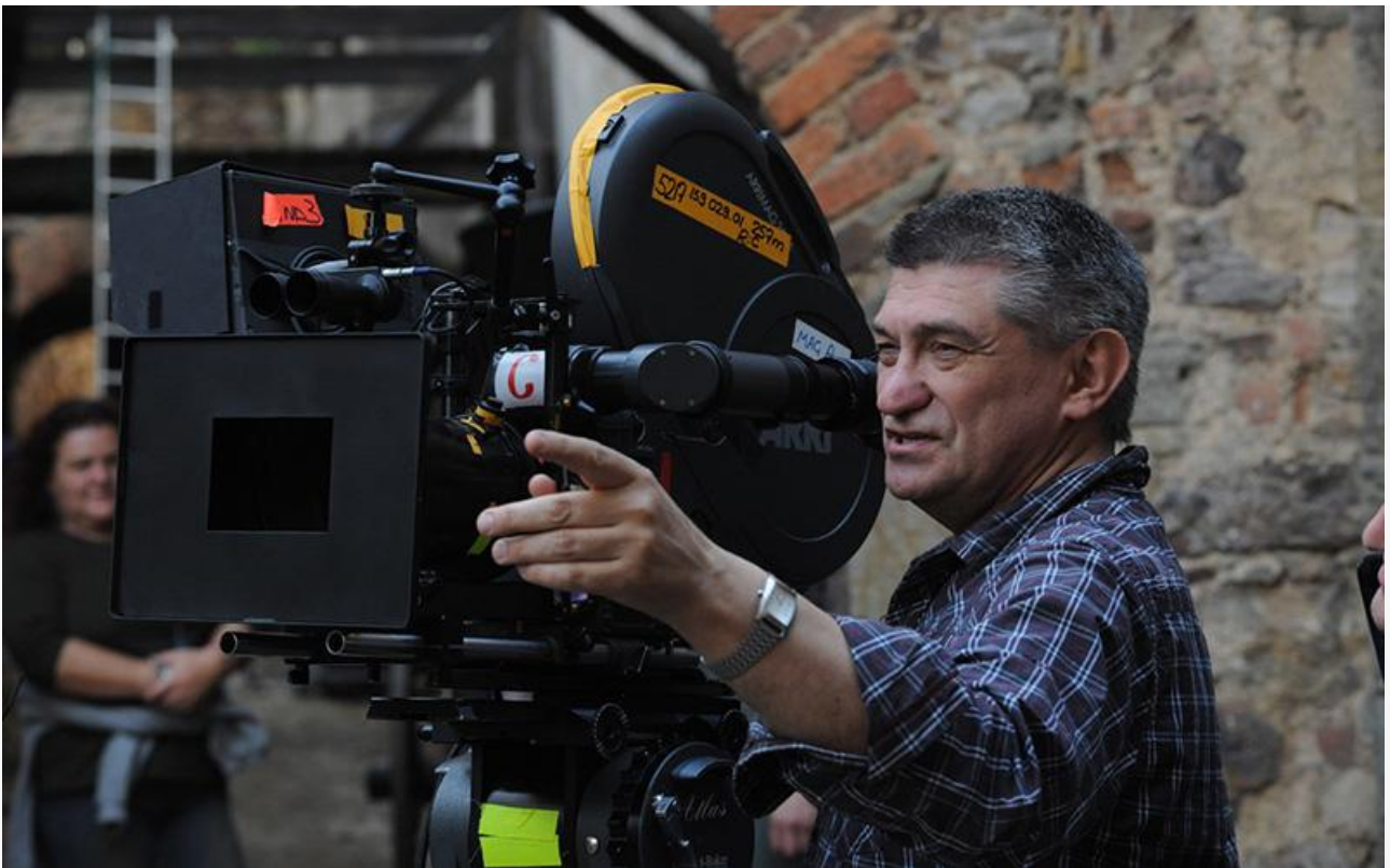
Александр Сокуров на съёмочной площадке