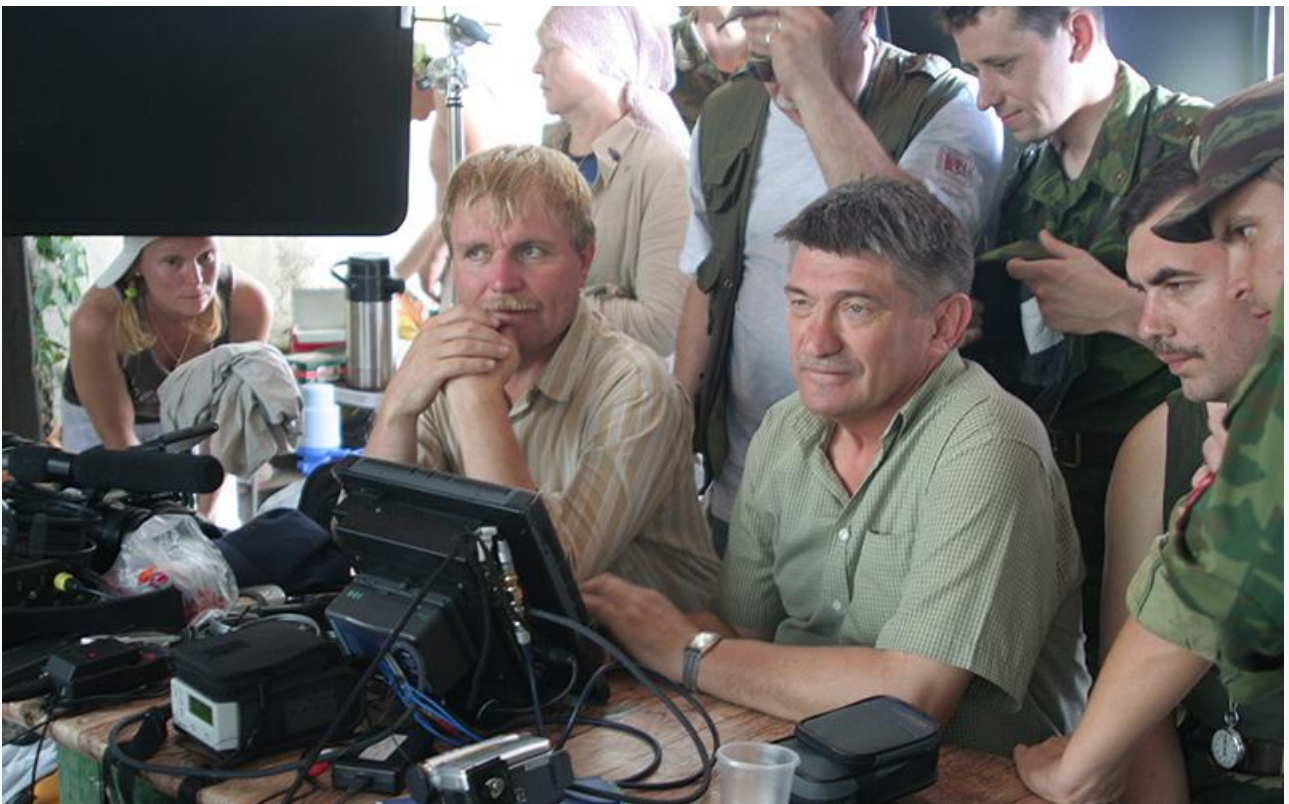
Александр Сокуров на съёмочной площадке

За выдающийся вклад в мировой кинематограф Александр Сокуров награждён Премией Европейской киноакадемии, Специальным призом Кинофестиваля в Сан-Паулу, «Почётным леопардом» Кинофестиваля в Локарно, Премиями фестивалей «Зеркало» и «Кинотавр», Премией имени Тарковского.