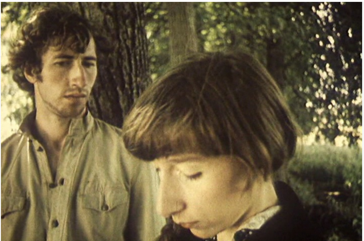
«Бронзовый леопард» Кинофестиваля в