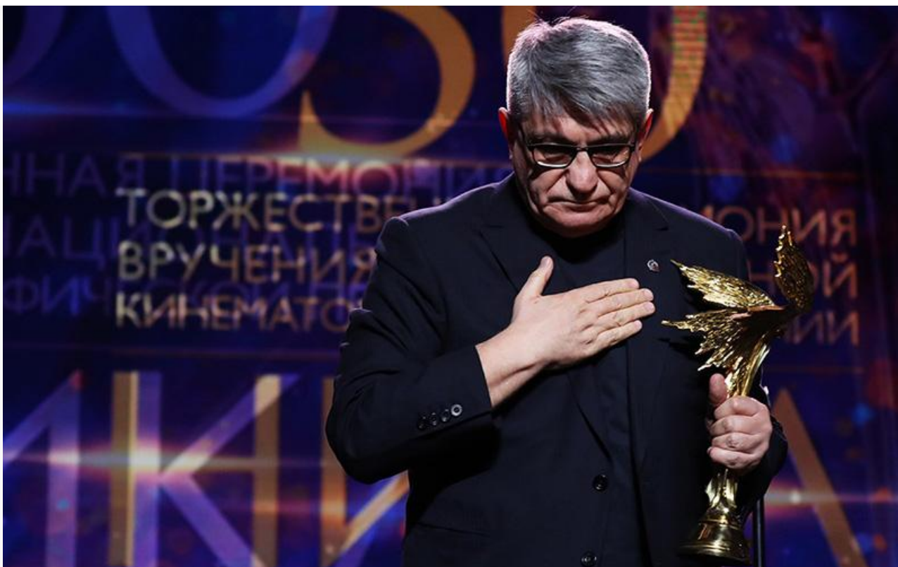
Александр Сокуров с премией «Ника», 2017 год

В 2017 году мастер стал обладателем Национальной кинопремии «Ника» в номинации «Честь и достоинство». В этой же номинации, но тремя годами позже, он получил Премию Гильдии киноведов и кинокритиков России.