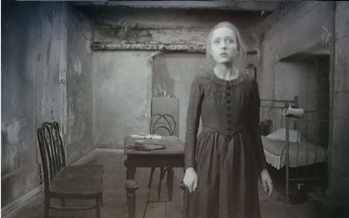
страницы», 1994 год