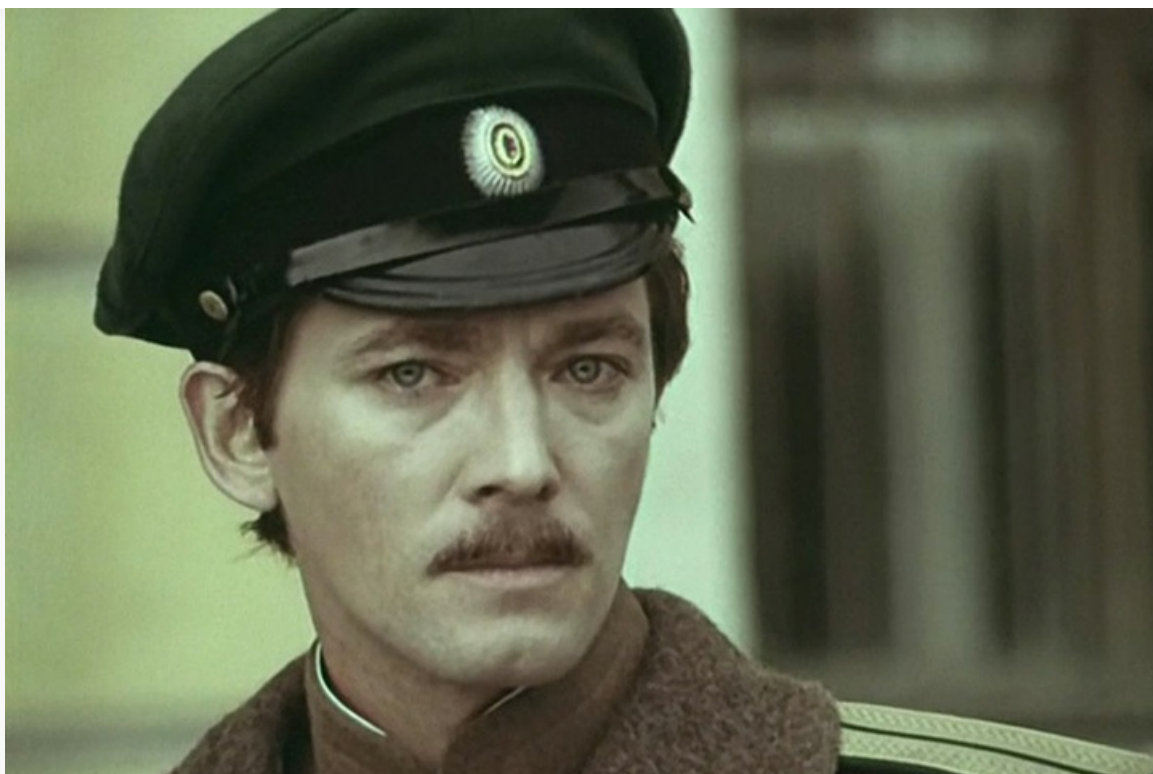
Алексеевич Данович в фильме «Государственная граница», 1980 год