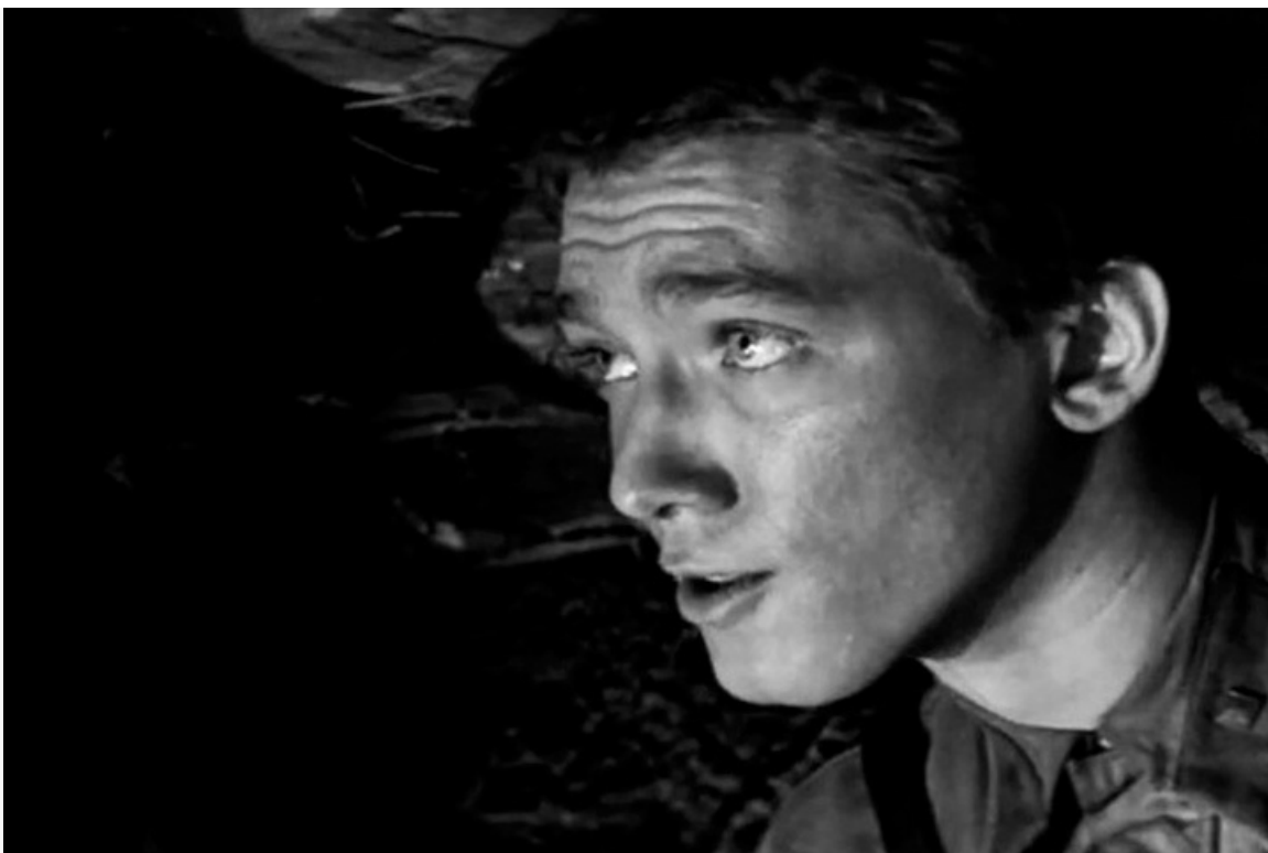
«Возмездие». Первая роль в кино, 1967 год