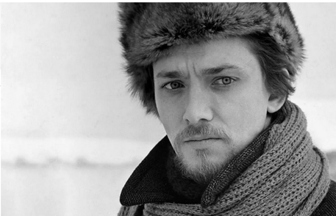
Андрей Старцов в фильме «Города и годы», 1973 год