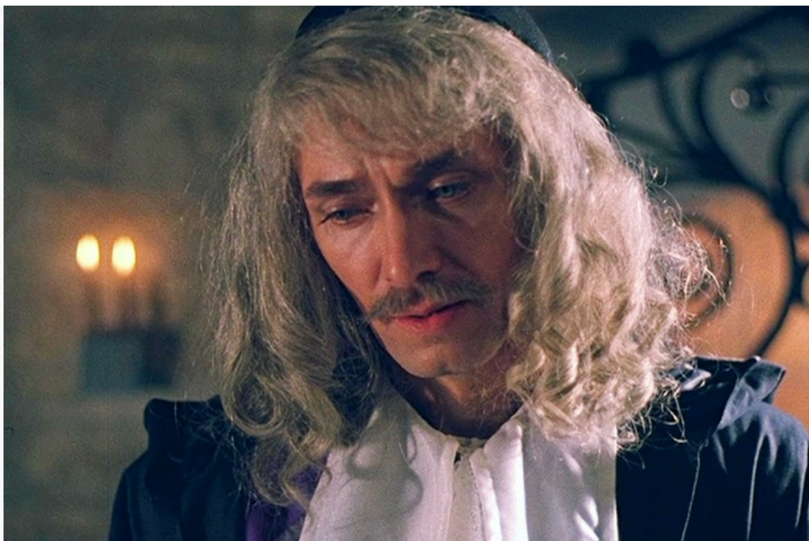
Мушкетёры тридцать лет спустя», 1993 год