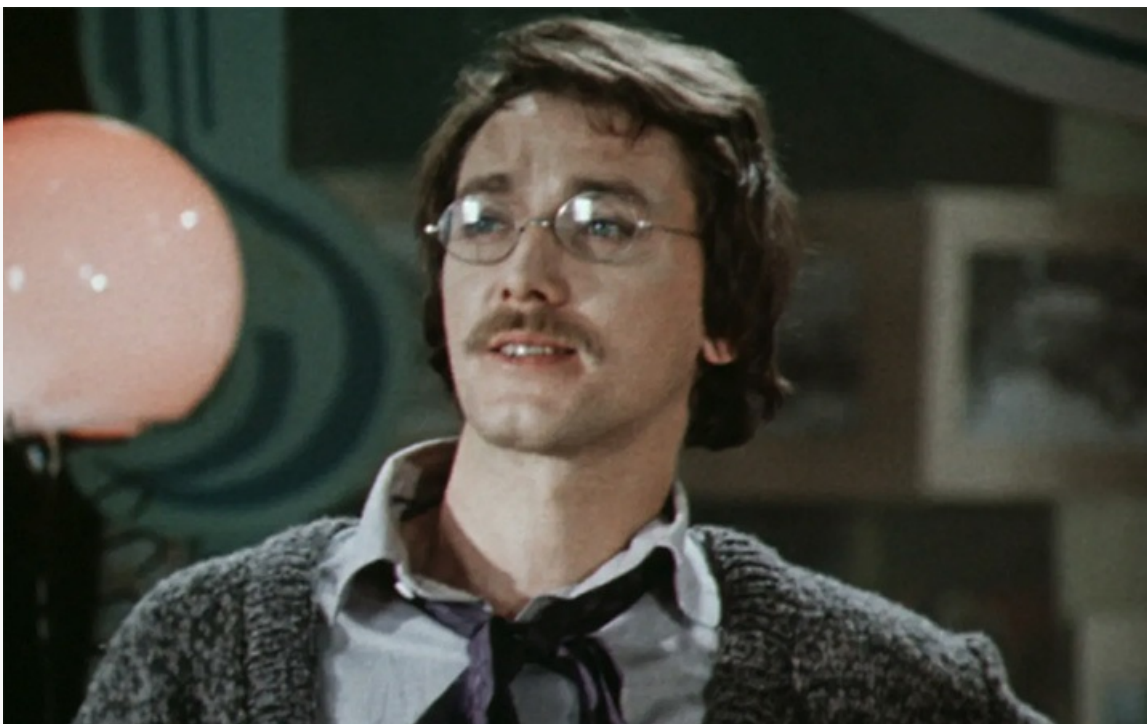
Монмартра», 1975 год

Огромная популярность пришла к Игорю Старыгину в 1979 году с ролью Арамиса в трёхсерийном музыкальном телефильме Георгия Юнгвальда-Хилькевича «Д'Артаньян и три мушкетёра» и его продолжениях: «Мушкетёры двадцать лет спустя», «Тайна королевы Анны, или Мушкетёры тридцать лет спустя» и «Возвращение мушкетёров, или Сокровища кардинала Мазарини».