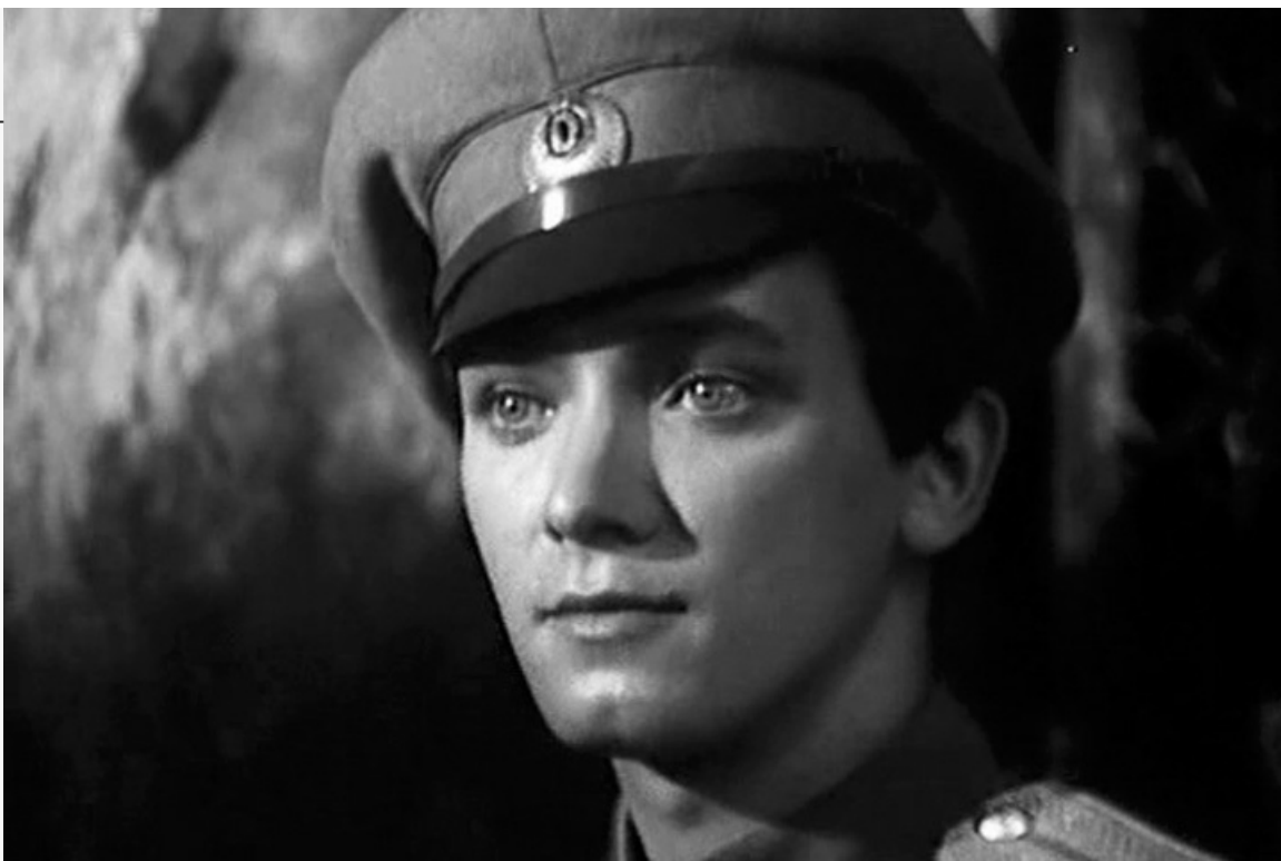
превосходительства», 1969 год