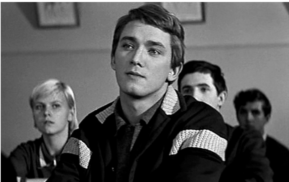
понеделника», 1968 год