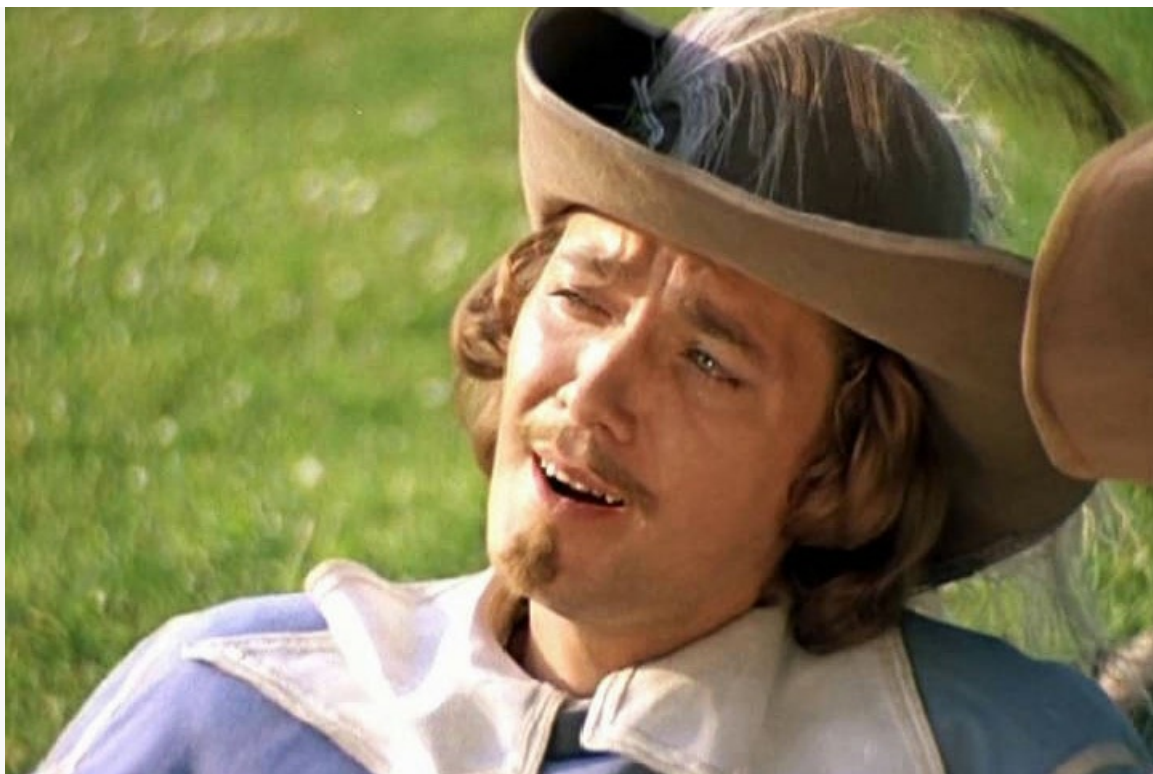
«Д'Артаньян и три мушкетёра», 1979 год