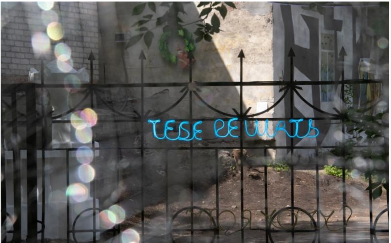
Инсталляция Алены Овсянниковой «Поиск».

Масштабная трехдневная программа фестиваля включала в себя экскурсии, выставки, artist-talk'и и лекции в области культурного активизма, креативных индустрий и современного искусства. Завершилась публичная часть мероприятия вечером 30 мая концертом группы «bSICtransit», перформансом «Мост» лаборатории «Три П» и танцами томского «ордена ЯМОМО».