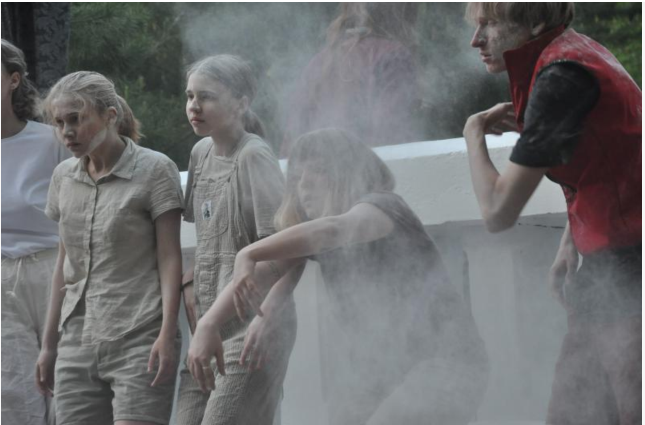
Танцы «ордена ЯМОМО».

Масштабная трехдневная программа фестиваля включала в себя экскурсии, выставки, artist-talk'и и лекции в области культурного активизма, креативных индустрий и современного искусства. Завершилась публичная часть мероприятия вечером 30 мая концертом группы «bSICtransit», перформансом «Мост» лаборатории «Три П» и танцами томского «ордена ЯМОМО».