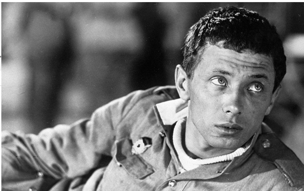
Женя Кольшкин в фильме «Женя, Женечка и «Катюша»», 1967 год