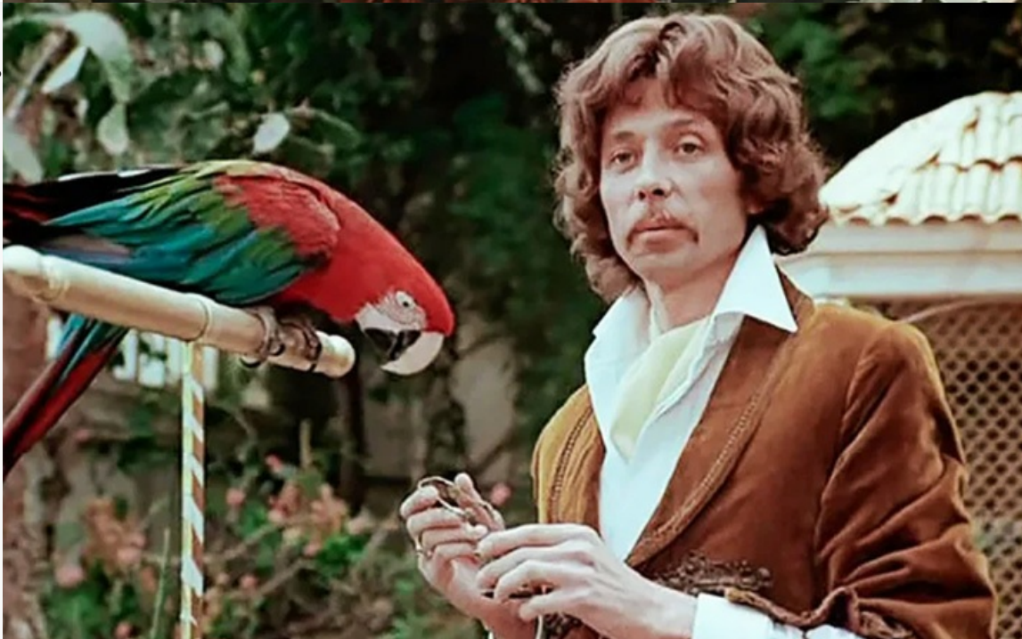
«Приключения принца Флоризеля», 1979 год

Олег Даль с юности не отличался богатырским здоровьем, что стало одним из факторов раннего ухода. Особенно это касалось проблем с сердцем. Если бы «тонкий и хрупкий» актёр себя берёг, был более сдержан и не принимал всё близко к сердцу, он бы прожил гораздо дольше. Но тогда это бы был уже не Даль.