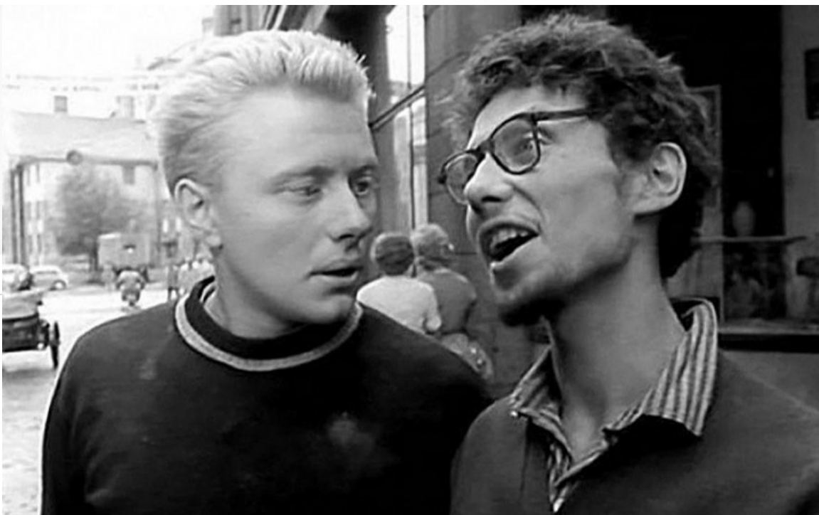
Борис Дуленко в фильме «Человек, который сомневается», 1963 год