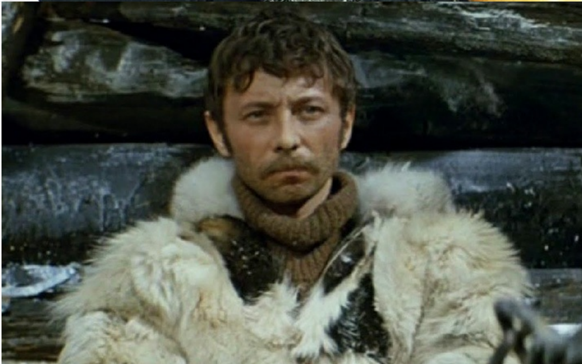
Крестовский в фильме «Земля Санникова», 1973 год