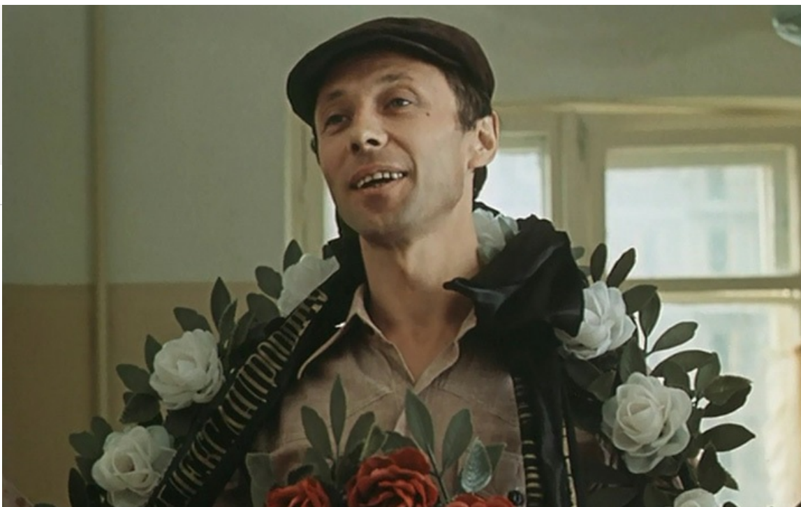
Принц Флоризель в фильме