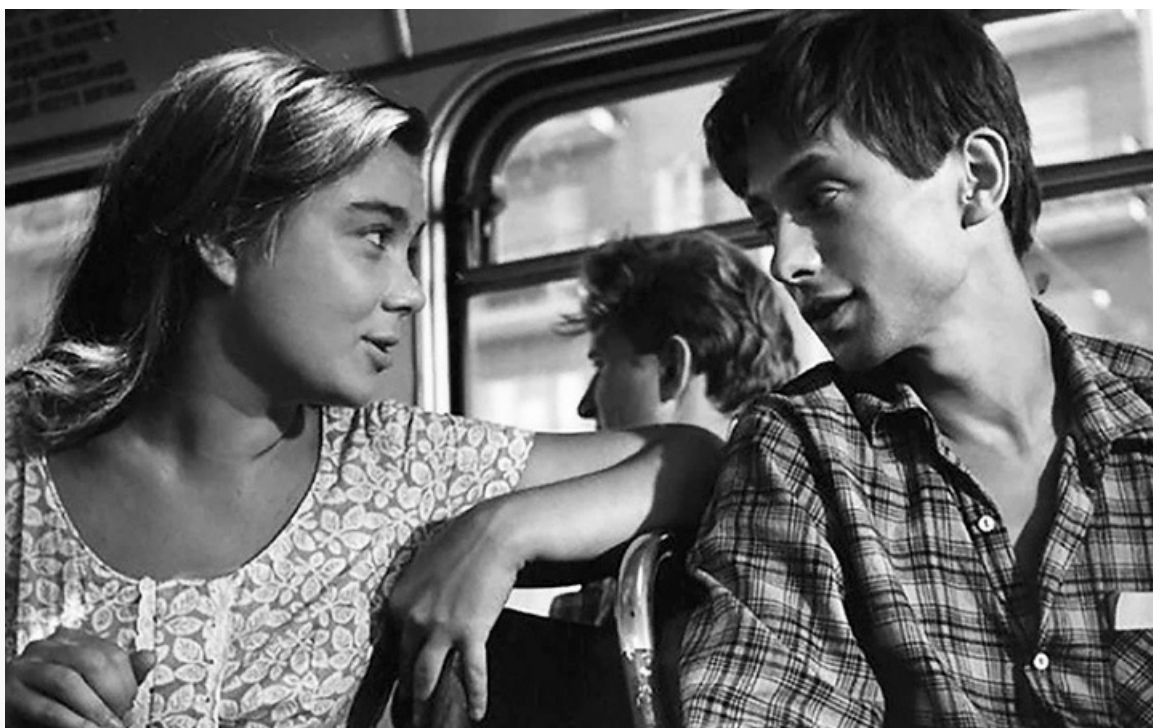
троллейбус», 1964 год