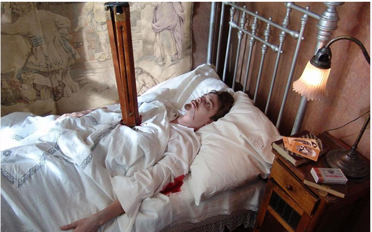
Кадр из фильма «Пелагия и белый бульдог», 2009 год

Юбилеи писателей мы традиционно отмечаем публикацией цитат из их произведений. Сегодня в подборке Бабра – мысли автора и фразы его героев из романов самой знаменитой серии Бориса Акунина о похождениях «идеального аристократа XIX века» Эраста Петровича Фандорина: «Азазель», «Турецкий