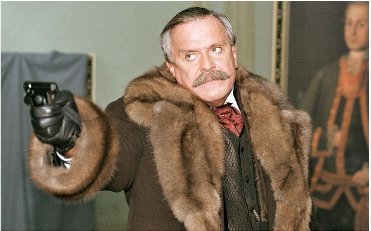
Кадр из фильма «Статский советник», 2005 год