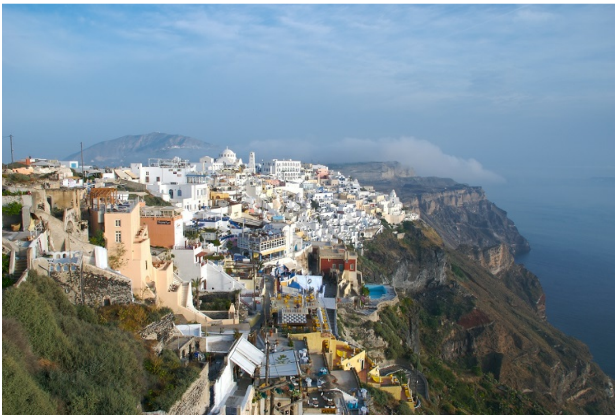
Санторини, Греция.

Автор: Елена Берёзка © Babr24.com ТУРИЗМ, ЗДОРОВЬЕ, МИР, РОССИЯ 👁 5589 17.05.2021, 09:23 📄 1057 URL: https://babr24.com/?ADE=213918 Bytes: 1855 / 1675 Версия для печати Скачать PDF