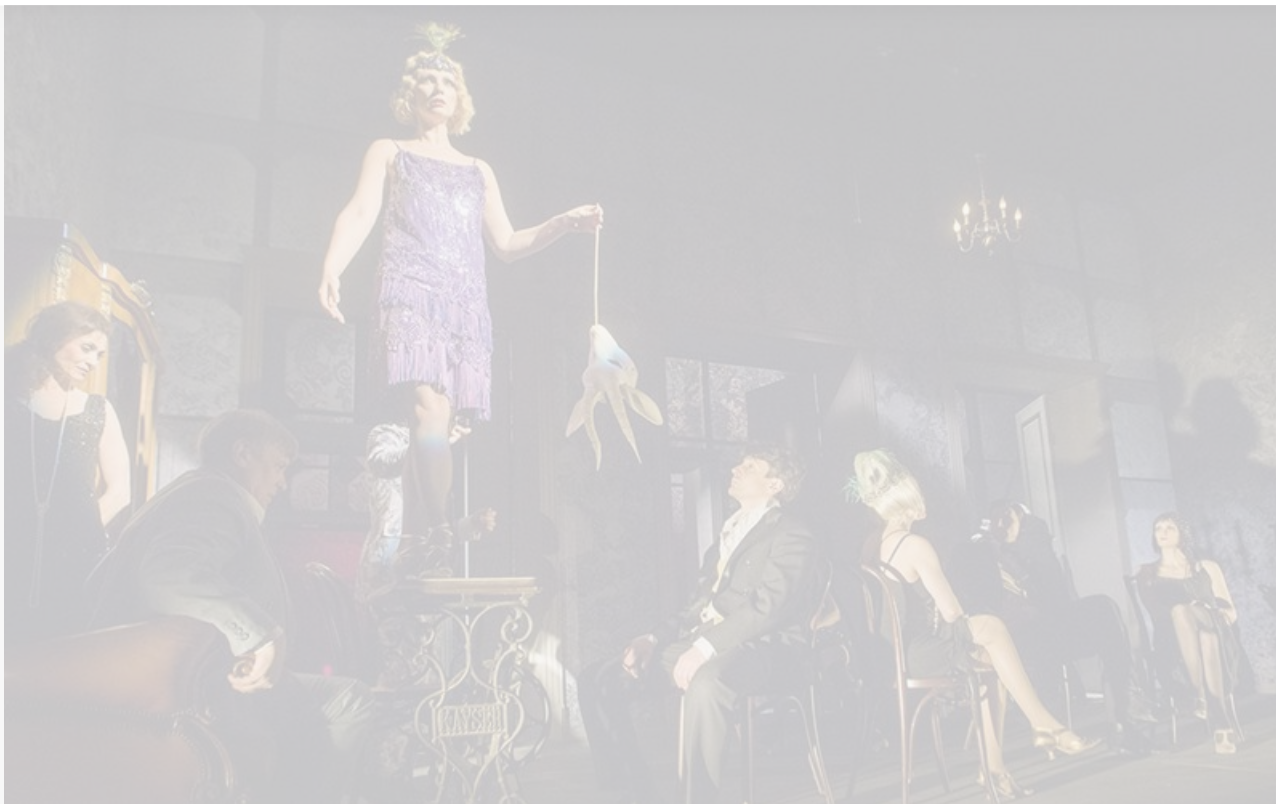
Сцена из спектакля «Зойкина квартира» Русского драматического театра Литвы, постановка 2014 года