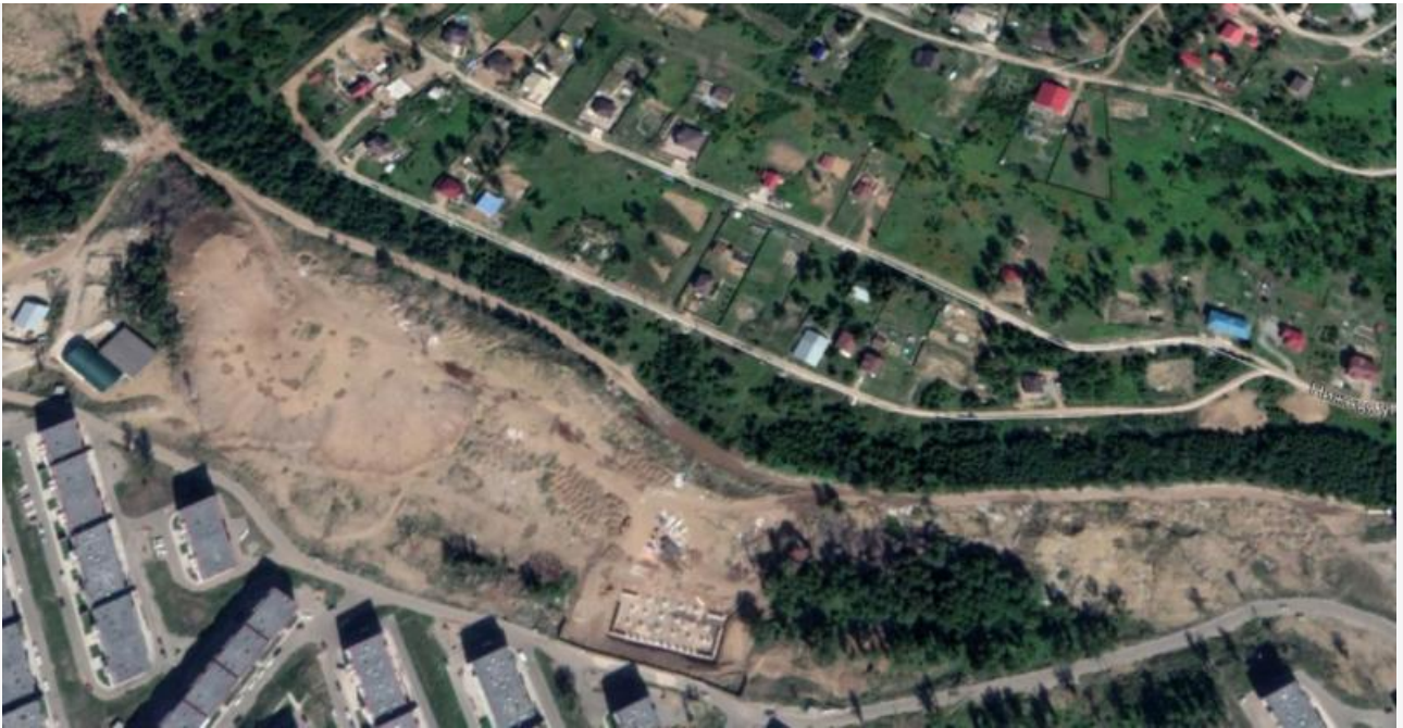
Август 2018 года. Справа жалкие остатки леса, в центре виден мусор