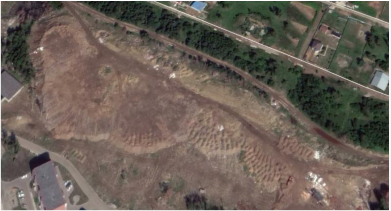
Август 2018 года. На крупном плане хорошо видны бугры. Каждый – это вываленный самосвал мусора