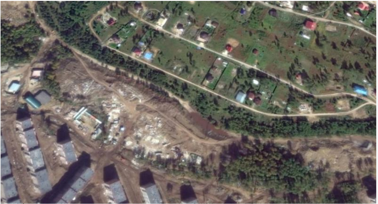
Сентябрь 2016 года. Леса всё меньше, мусор начинает проглядываться