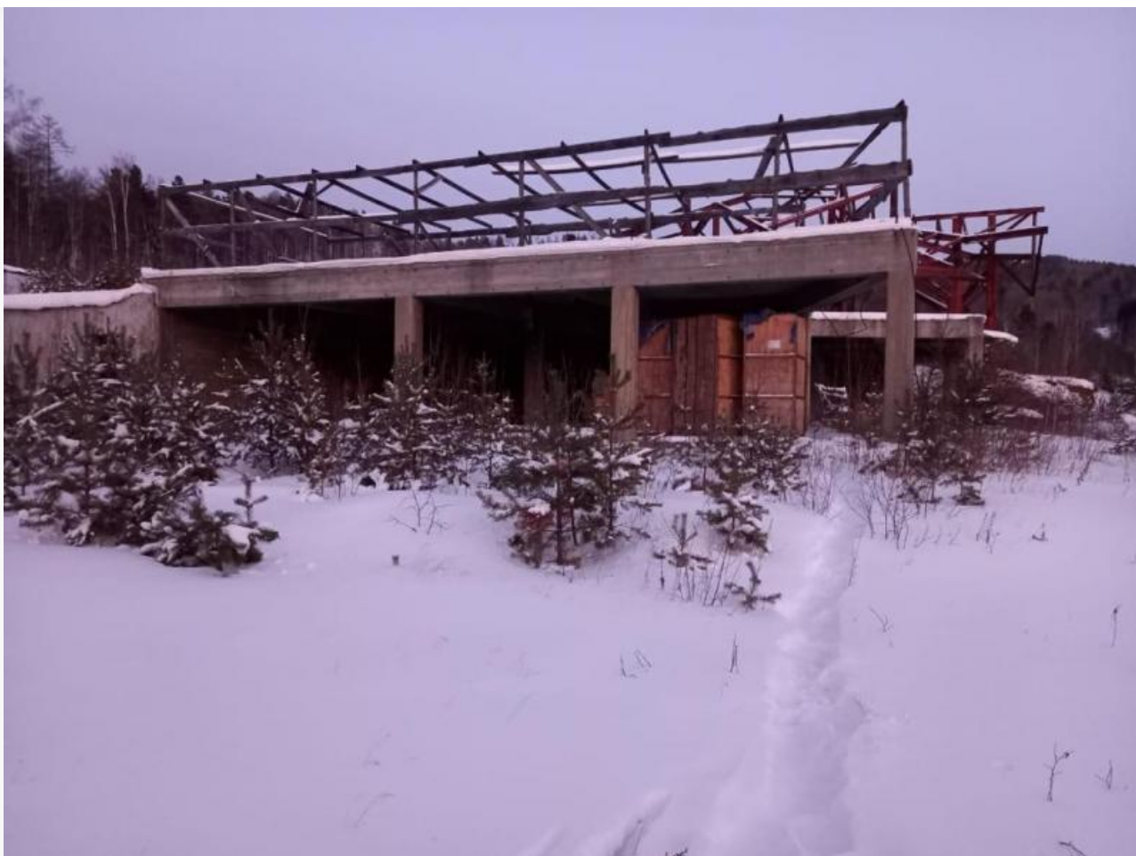
Фото на месте нелегальной стройки на территории Листвянского лесничества

Выяснилось, что принадлежащее Скворцову ООО «Пионер» строит ни больше ни меньше горнолыжный комплекс на общей площади аж 5,8 гектаров на территории Листвянского участкового лесничества.