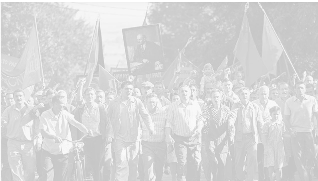
Кадр из фильма «Дорогие товарищи!». Лауреат премии «Белый слон» в номинации «Лучший фильм»

Лучший телесериал – «Псих», режиссёр Сергей Бондарчук.