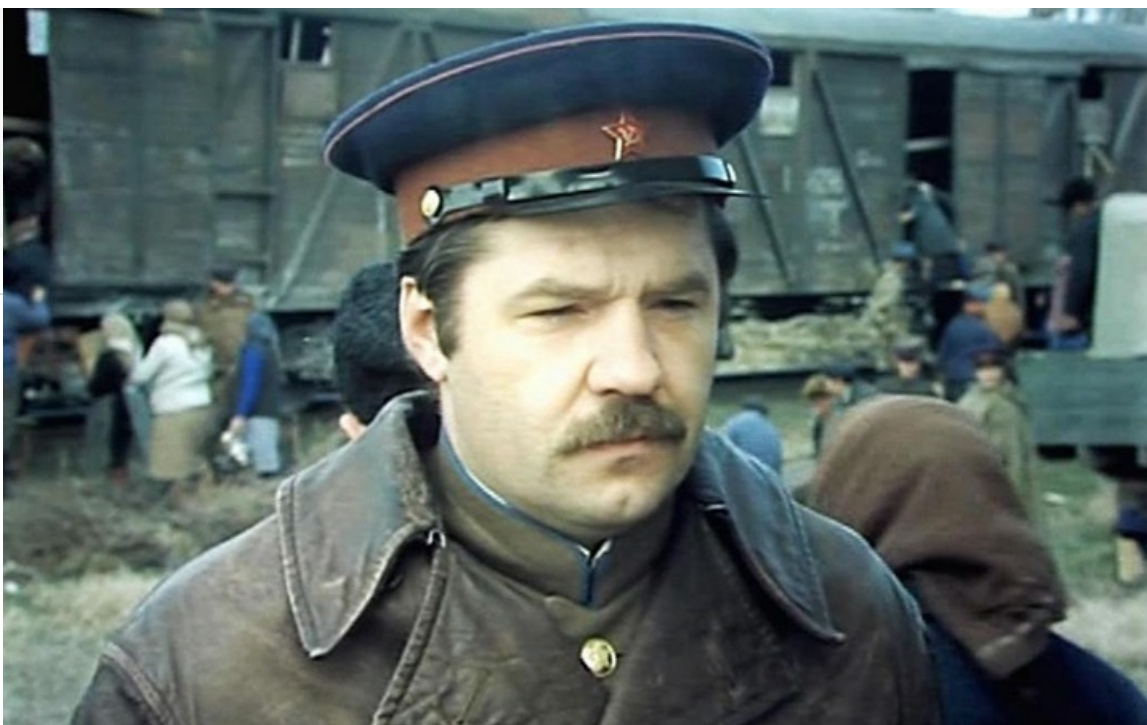
Капитан Ткач в фильме «Стук в дверь», 1989 год