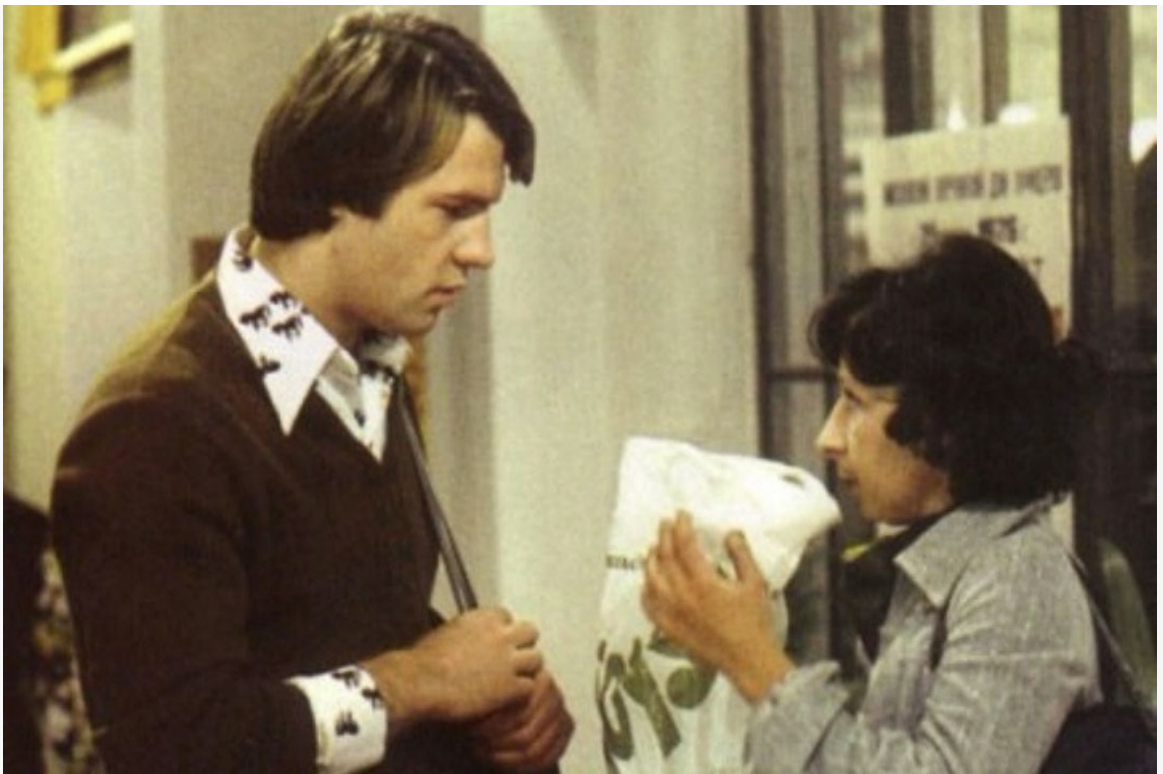
Вырезанный кадр из фильма «Служебный роман», 1977 год