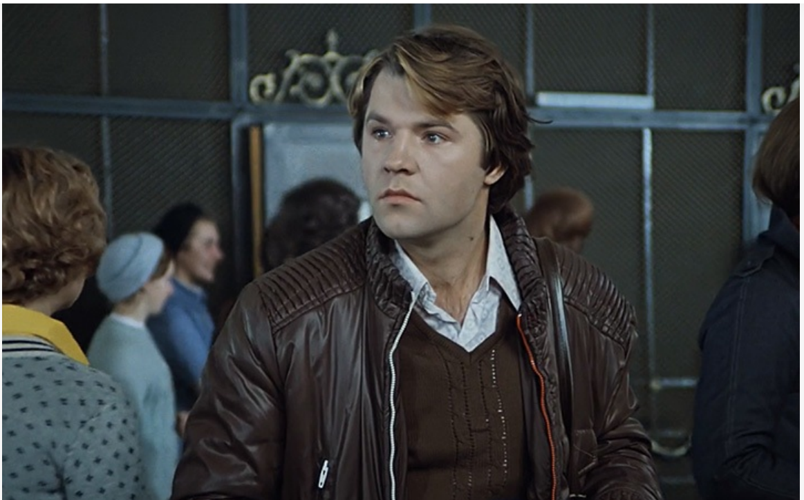
Сохранившийся кадр из фильма «Служебный роман», 1977 год