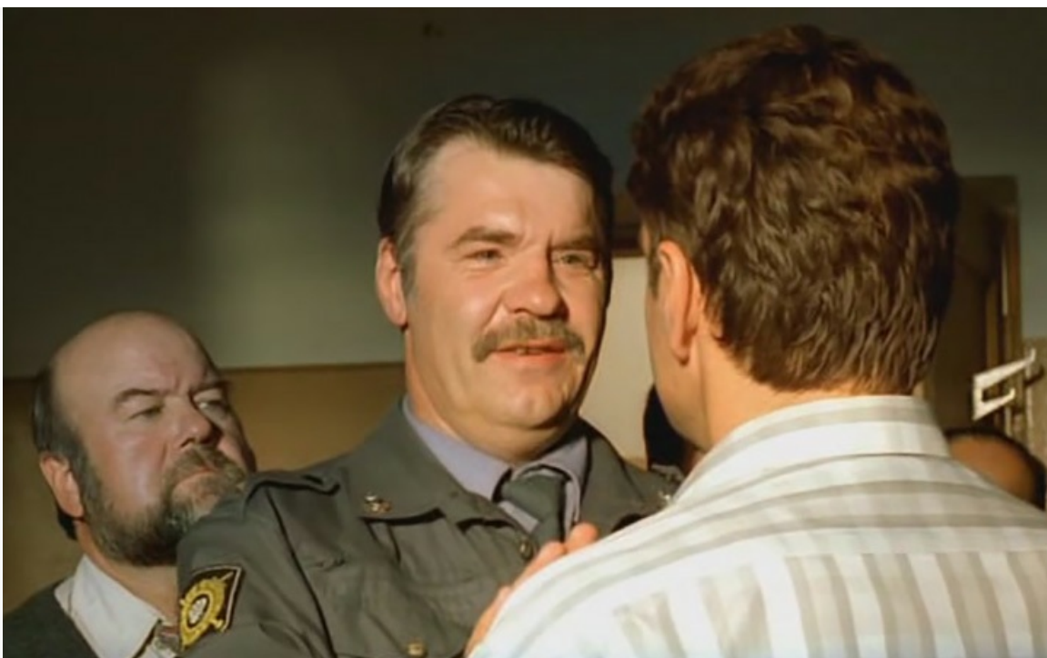
«Механическая сюита», 2002 год