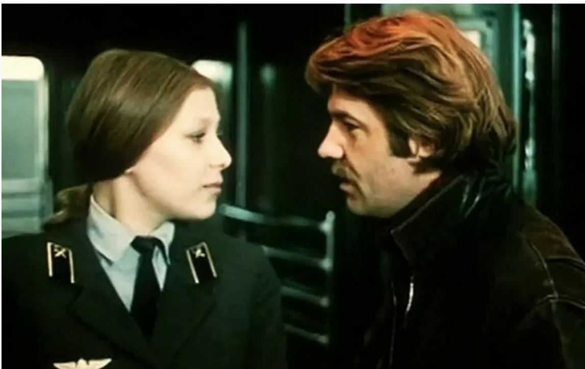
«34-й скорый», 1981 год