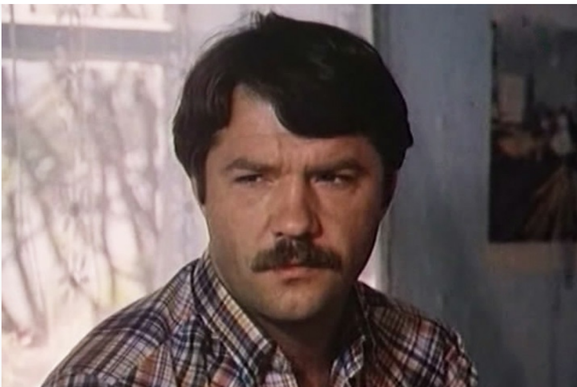
деревня...», 1985 год