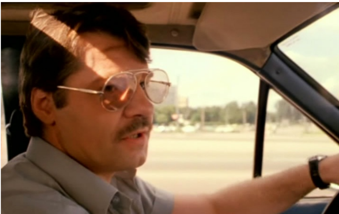
«Волкодав», 1991 год