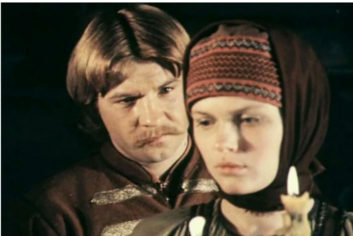
Афанасий Крыков в фильме «Россия молодая», 1981-1982 годы