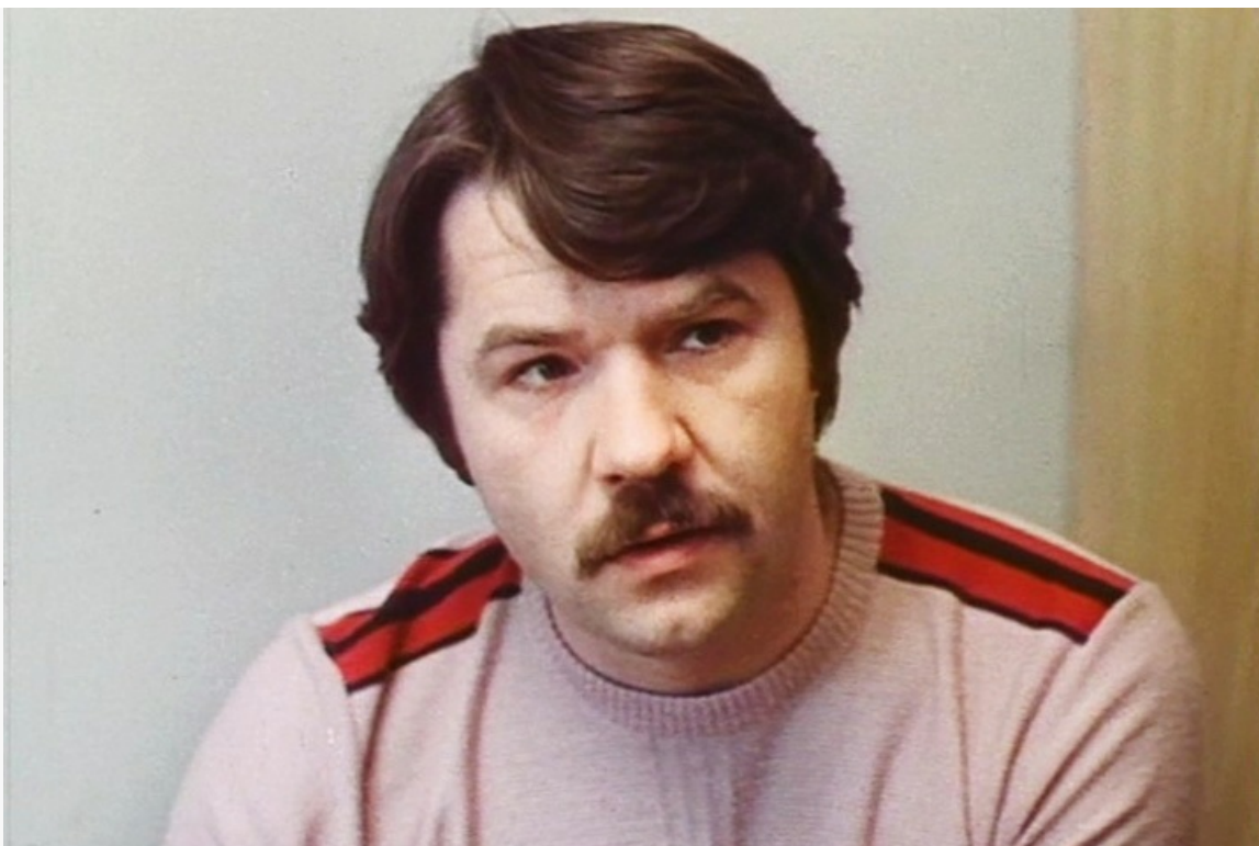
«Потерпевшие претензий не имеют», 1986 год