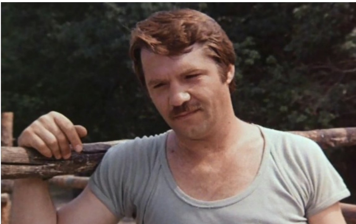
«Похищение», 1984 год