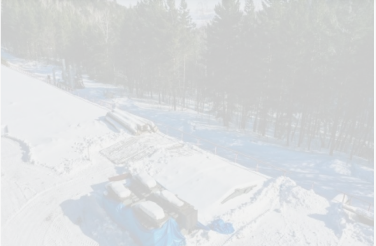
В этом месте будут захоранивать ядохимикаты

Есть основания полагать, что через 50 лет об этом все забудут или просто не найдут деньги. Есть еще вариант: за это время полигон поменяет с десяток владельцев, а когда придет время утилизации, последний скажет: «Ниче не знаю. Моя хата скраю». Мы уже наблюдали подобную картину на усольском Химпроме, улан-удэнском нефтяном озере и на БЦБК.