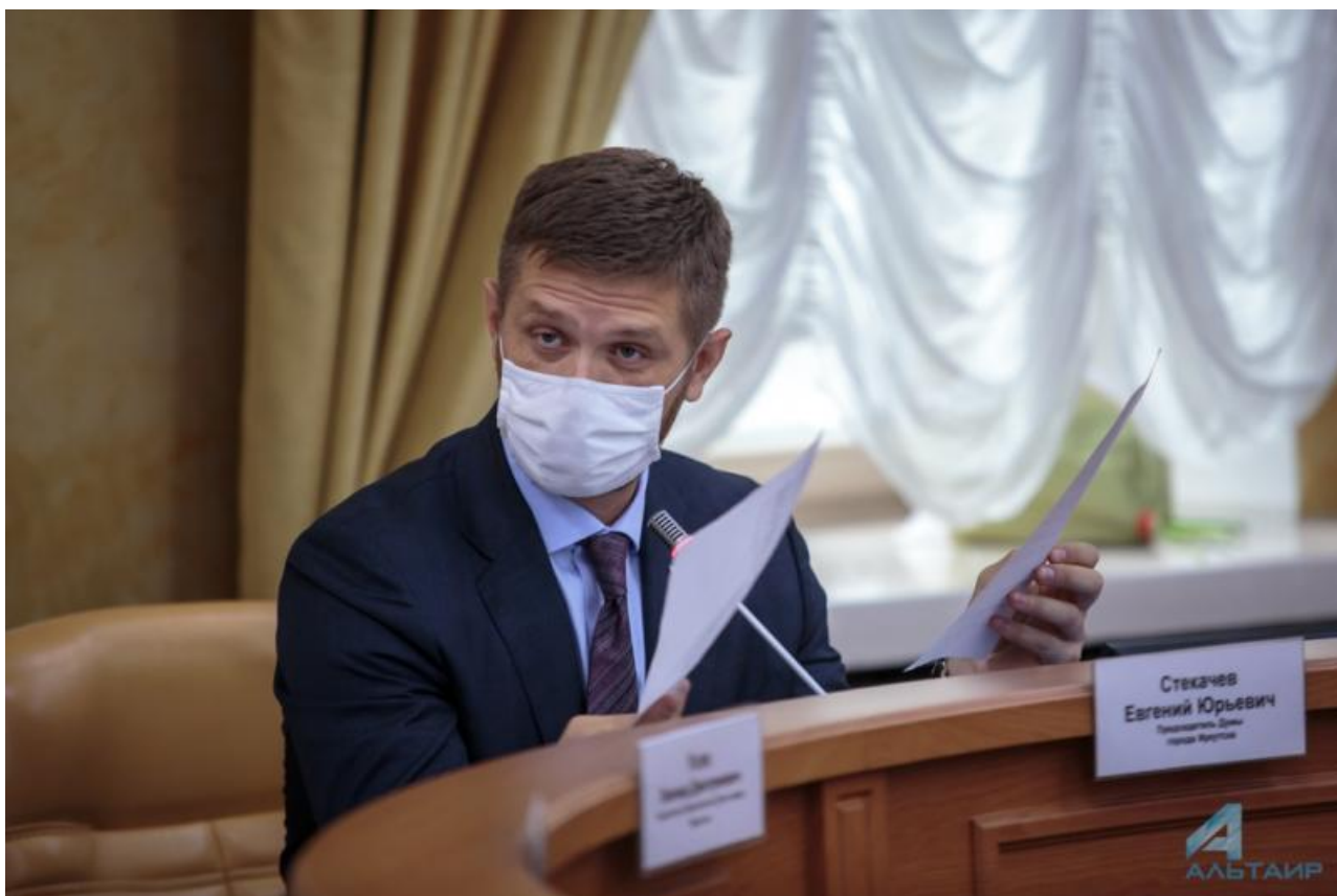
Фото: Алексей Кушниренко

Автор: Василий Сибирцев © Babr24.com ЭКОНОМИКА И БИЗНЕС, ПОЛИТИКА, ИРКУТСК 32100 23.03.2021, 17:41 1094