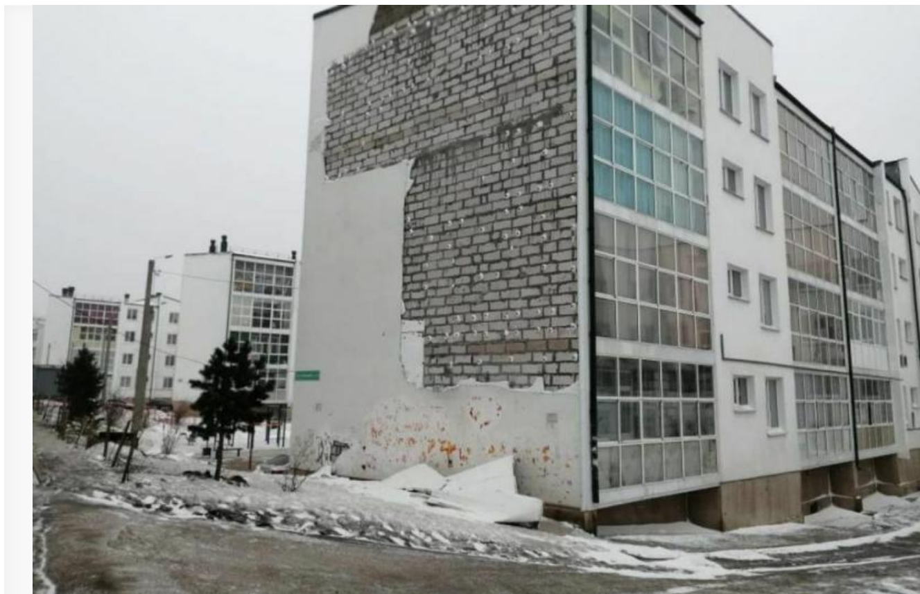
Рухнувшая облицовка жилого дома в микрорайоне «Зелёный берег»

В данный момент продаются квартиры в недодомах новой очереди, стены в которых через пару лет начнут трескаться, сайдинг отваливаться, кирпичи держаться на соплях. «Норд-Вест» только и успевает считать деньги и строить планы на будущую застройку.