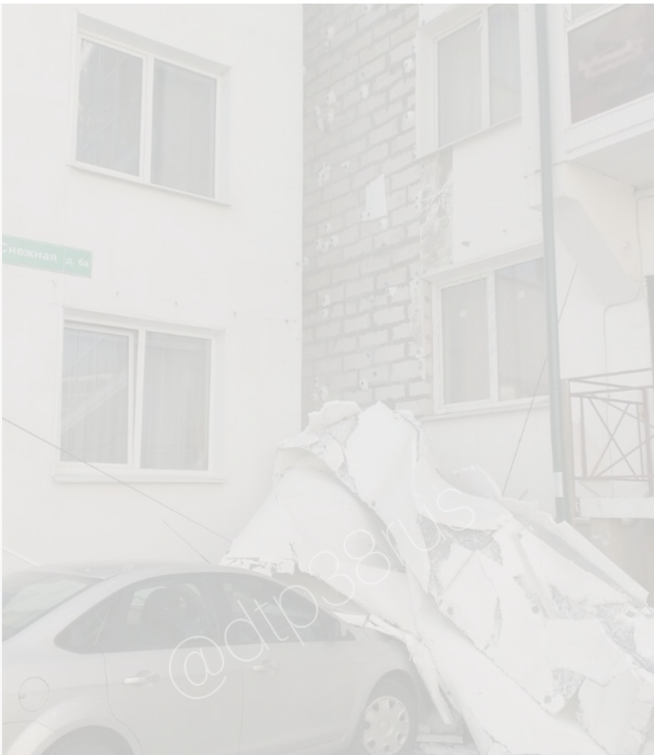
Рухнувшая облицовка в микрорайоне «Зелёный берег»

В микрорайоне «Берёзовый» ситуация едва ли лучше. Этой зимой на фасадах многих домов появились любопытные объявления следующего содержания: