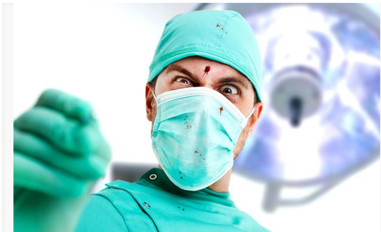
Образ врача в современной России

Однако в последние годы в России врачи из уважаемого профессионального сообщества превратились в касту потенциальных преступников. В Следственном комитете специально для них создан «Отдел судебно-медицинских исследований» с целью проведения экспертиз по делам о врачебных ошибках, а Уголовный кодекс пополняется новыми статьями с наказаниями за врачебные составы преступлений, причинение вреда здоровью и ненадлежащее оказание медицинской помощи.