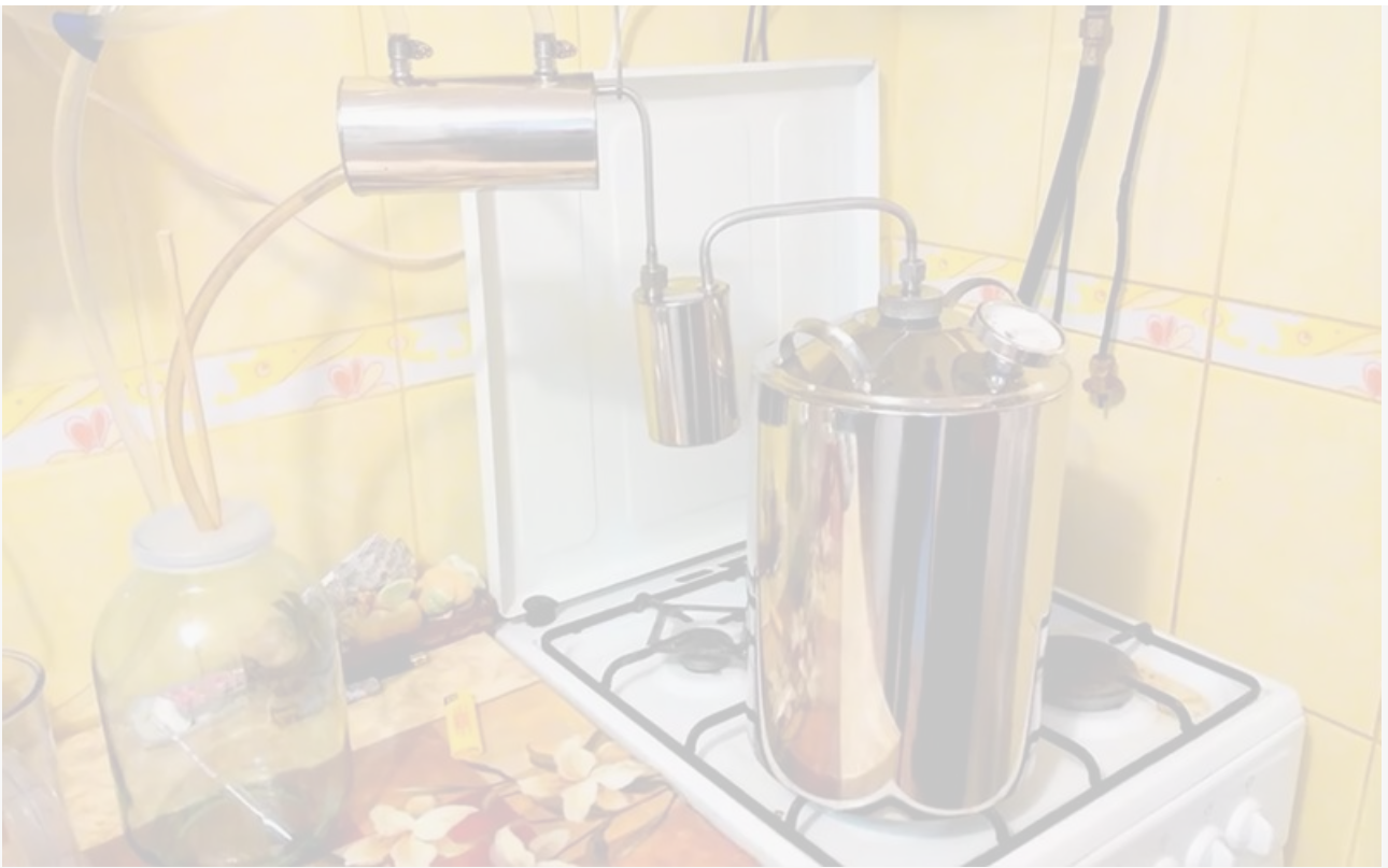
Один из секретов «трезвой России»

Ну и самое главное – в России необратимо стареет население, а методика расчёта потребления алкоголя остаётся неизменной, хотя не секрет, что старики пьют меньше молодых, которые, в свою очередь, сегодня употребляют немногим меньше, чем их предки в молодости.