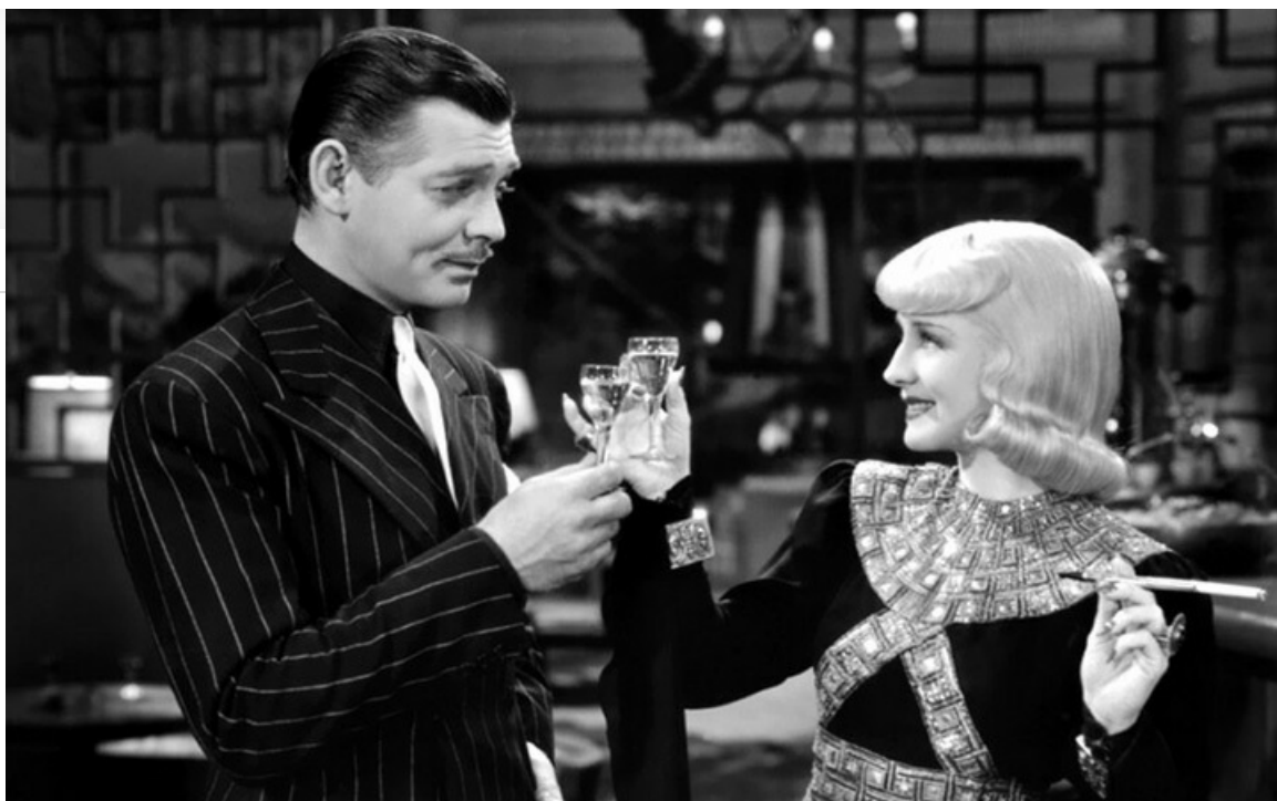
Гарри Ван в фильме «Восторг идиота», 1939 год