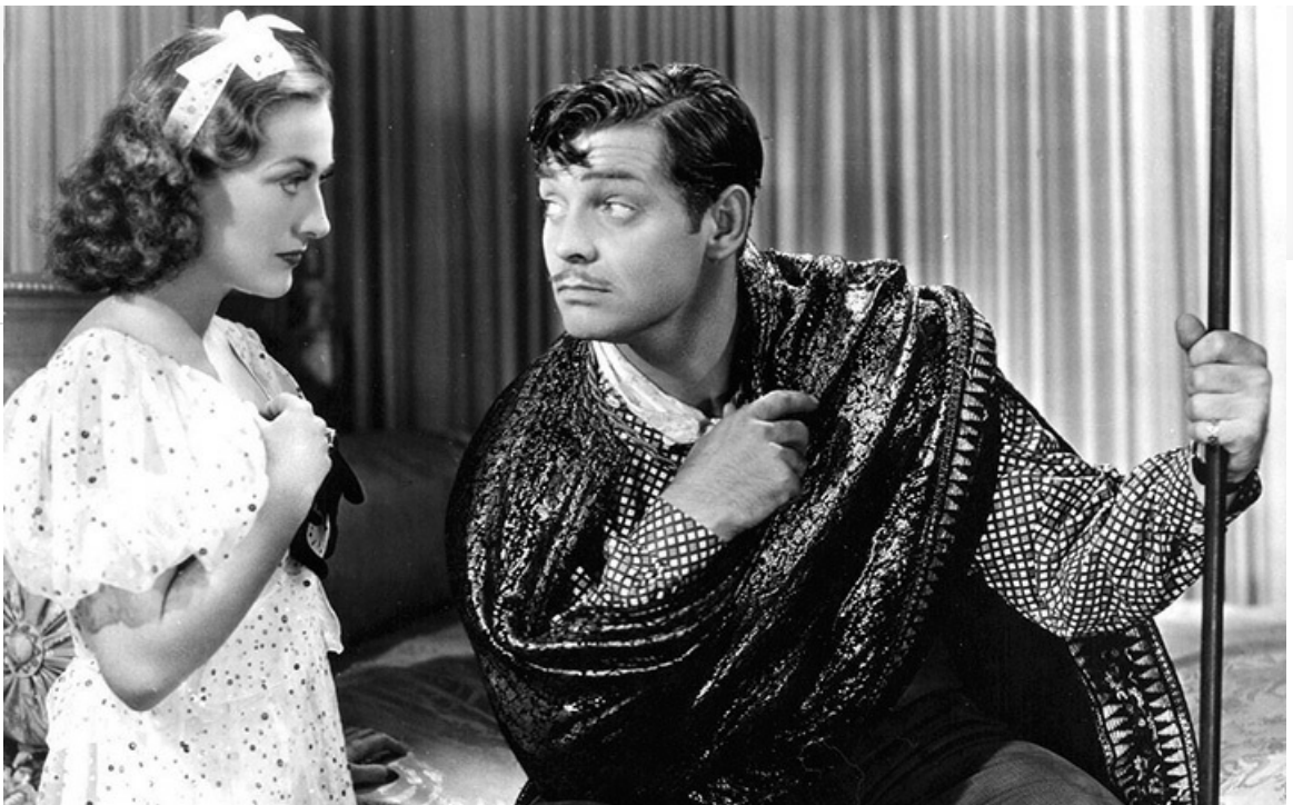
Вэн Стэнхоуп в фильме «Жена против секретарши», 1936 год