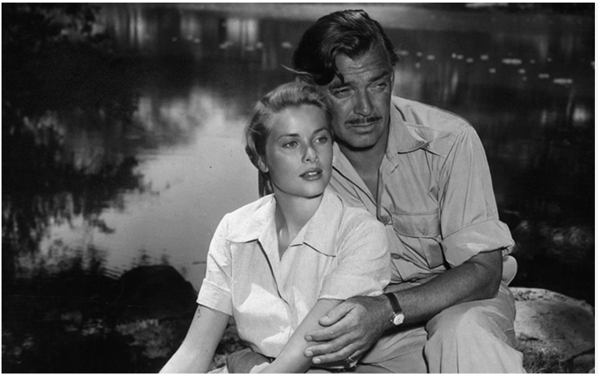
«Могамбо», 1953 год