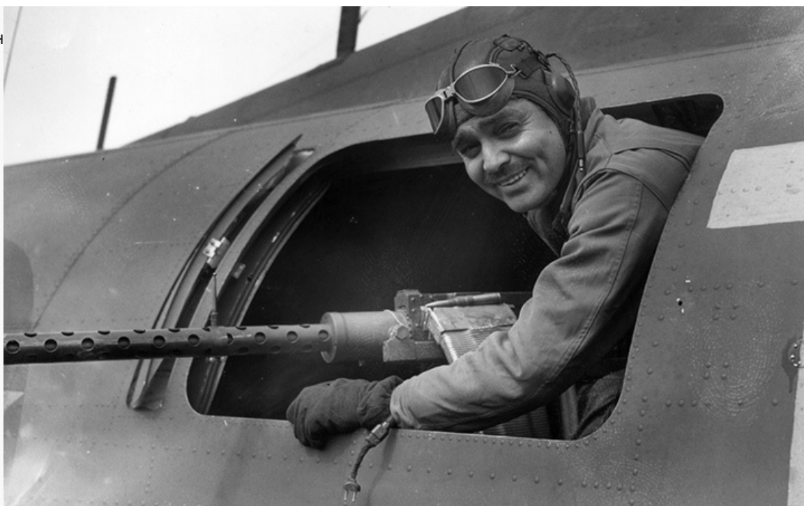
испытатель», 1938 год