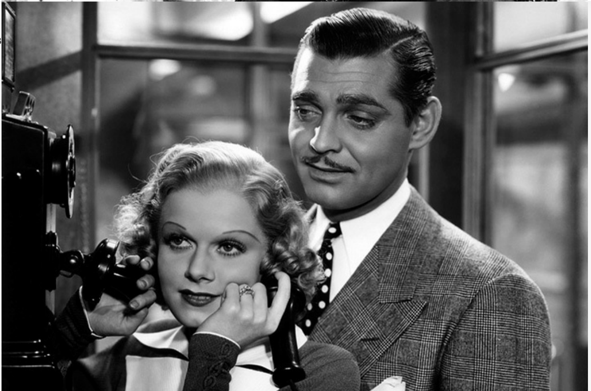
секретарши», 1936 год