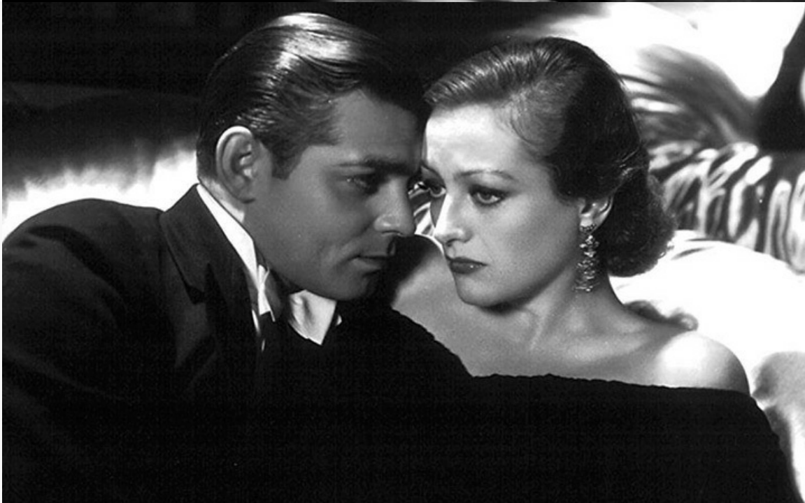
«Одержимая», 1931 год