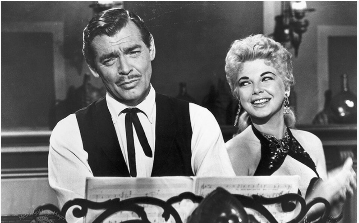
королевы», 1956 год