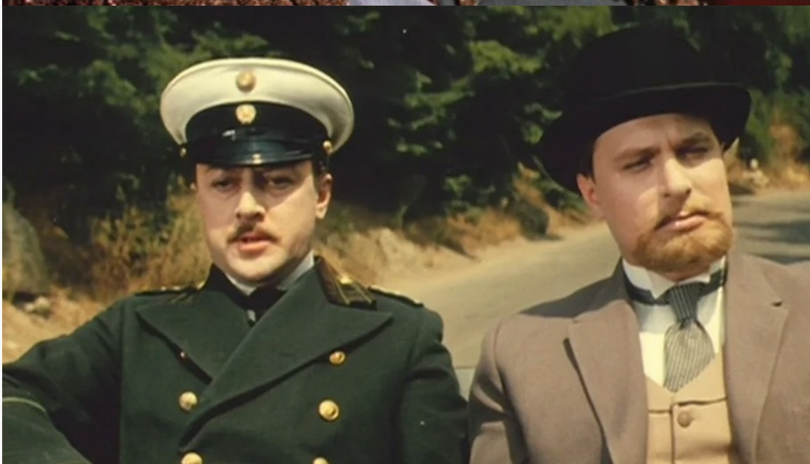
Николаевич Мирза- Булат-Тугановский в фильме «Гранатовый браслет», 1965 год