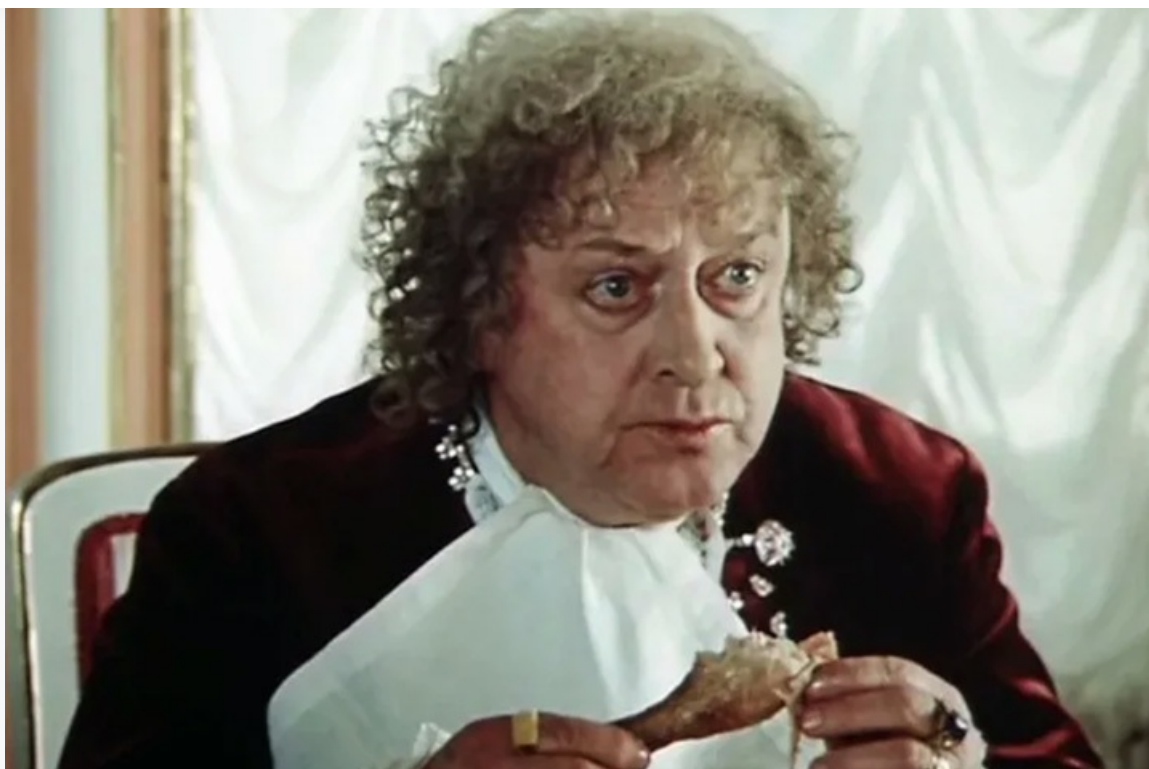
«Гардемарины, вперёд!», 1987 год