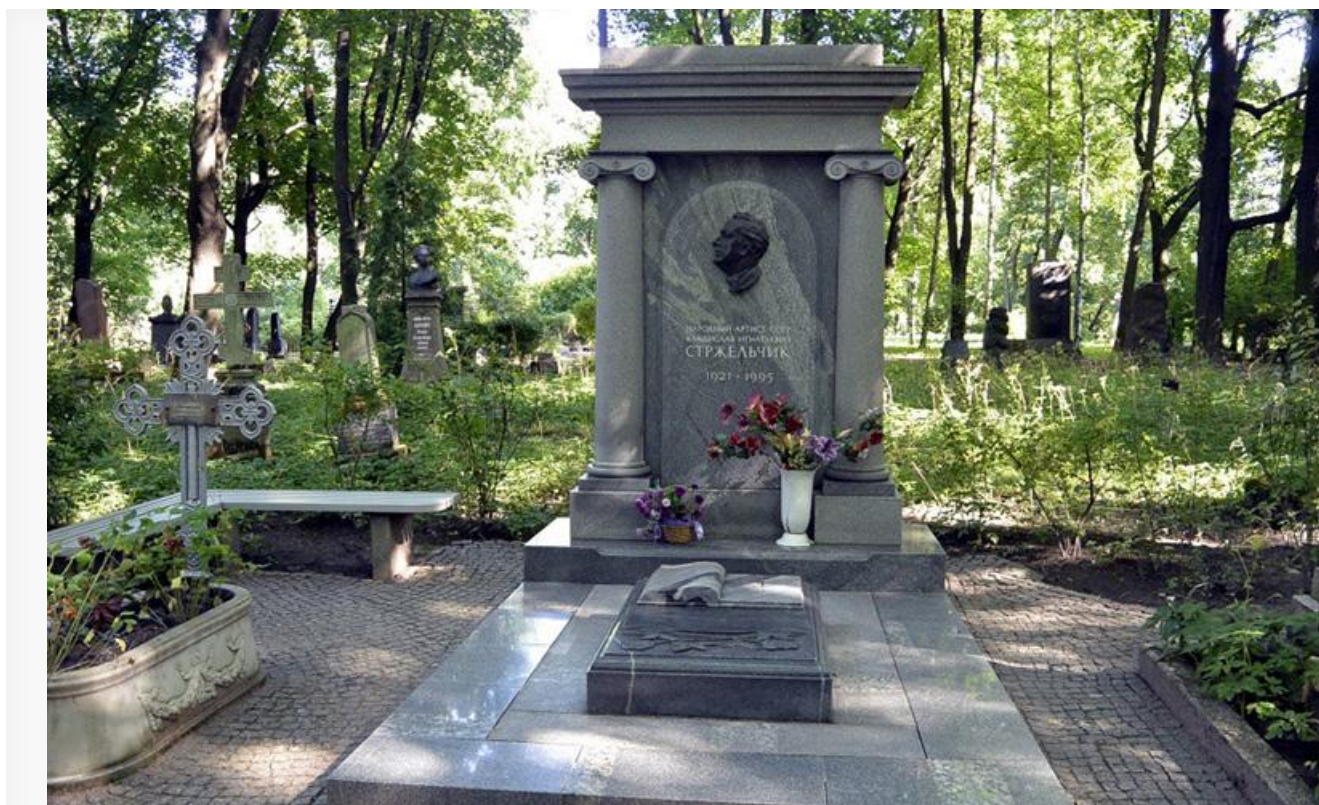
Могила Владислава Стржельчика

Похоронен народный артист на Литераторских мостках Волковского кладбища.