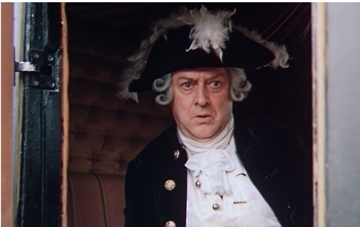
сокровищ», 1982 год

Долгие годы Владислав Стржельчик преподавал актёрское мастерство в Ленинградском государственном институте театра, музыки и кинематографа (ЛГИТМиК) и Ленинградском институте культуры имени Н. К. Крупской.