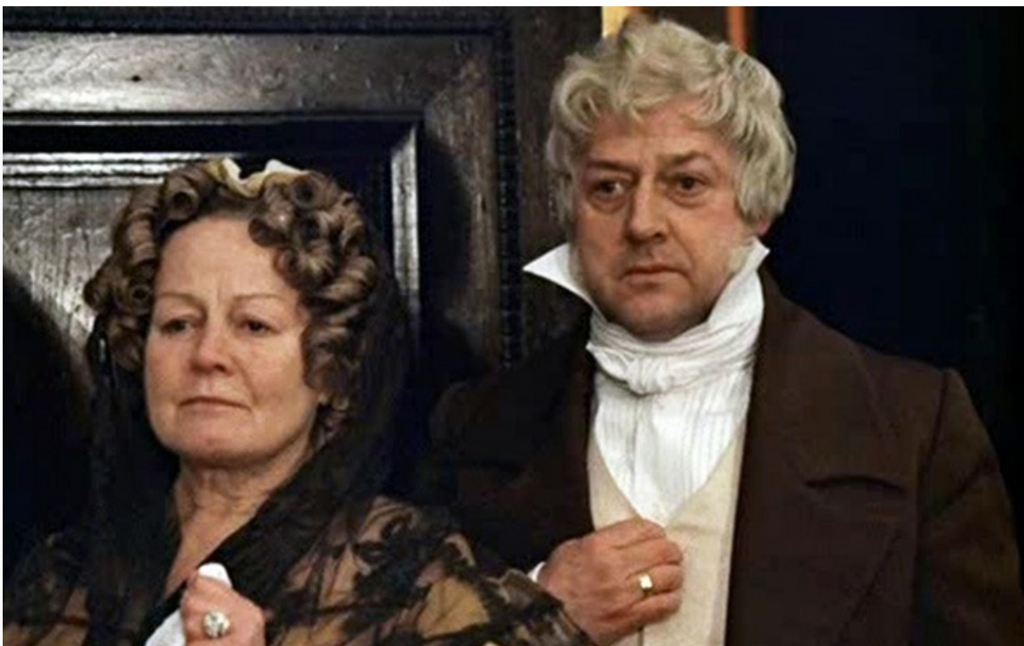
пленительного счастья», 1975 год

В 1954 году Владиславу Стрельчику было присвоено звание «Заслуженный артист РСФСР». В 1965-м он стал народным артистом РСФСР, а ещё через девять лет – народным артистом Советского Союза.