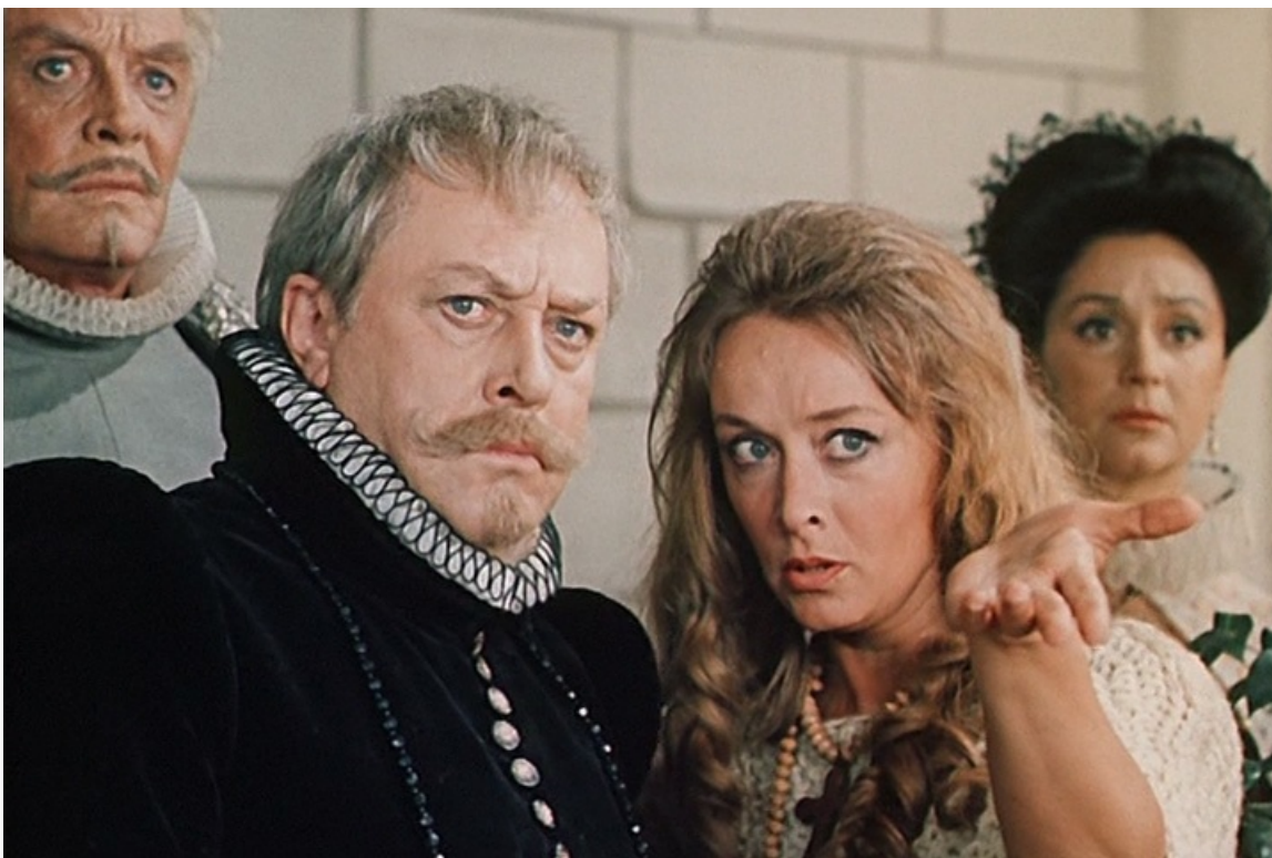
«Благочестивая Марта», 1980 год