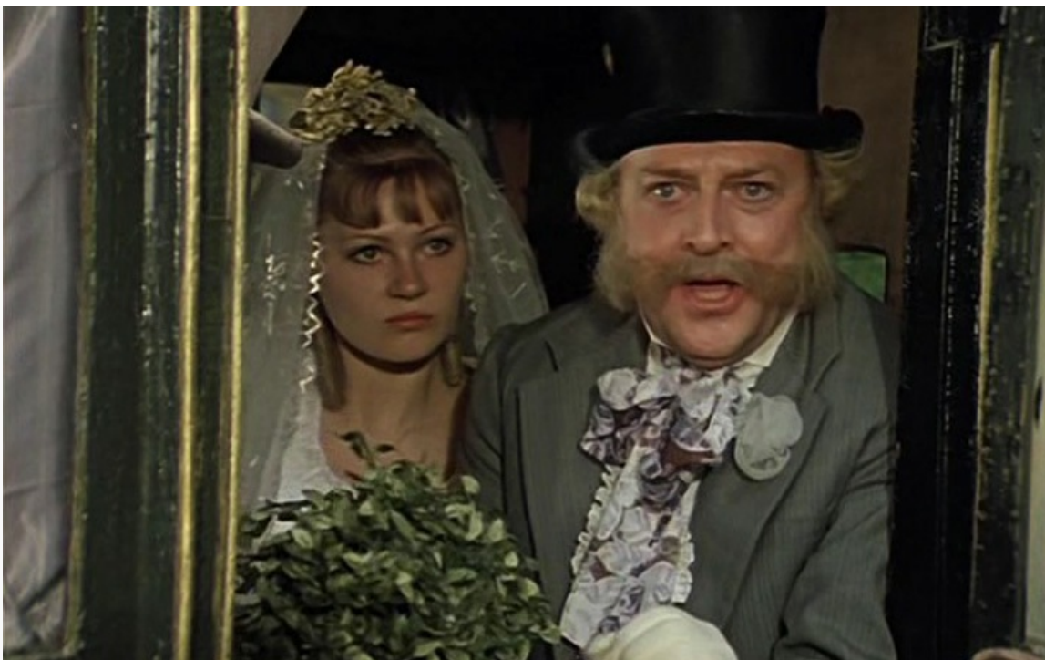
«Соломенная шляпка», 1974 год