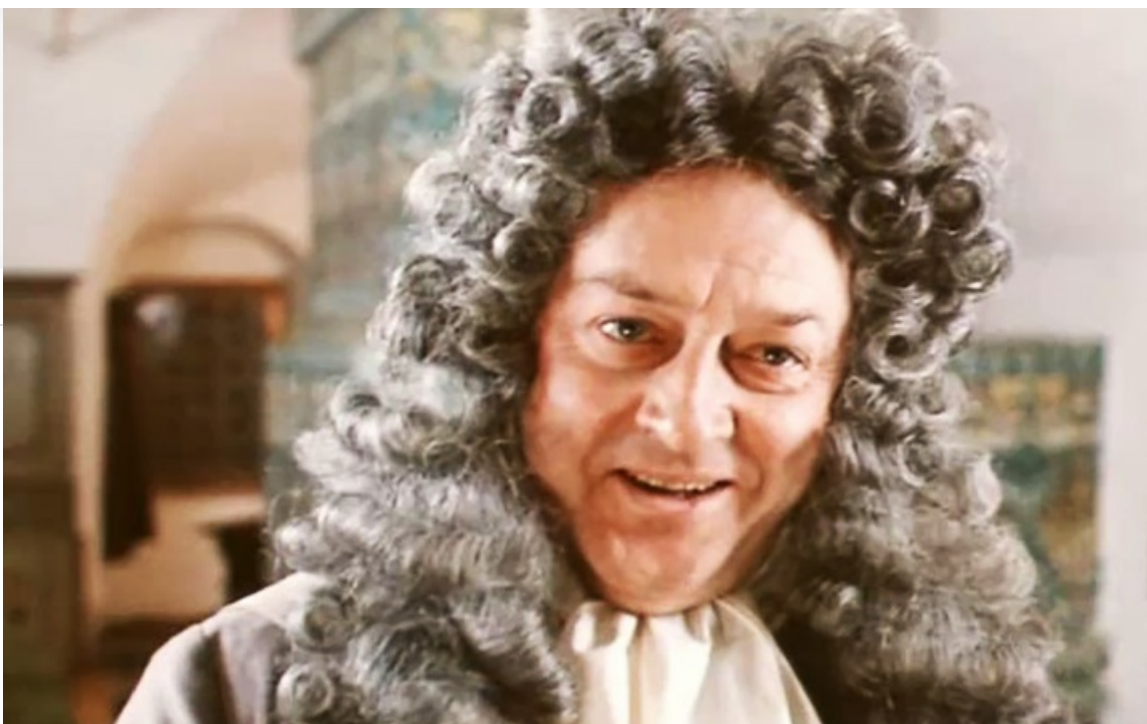
Шхипер Уркварт в фильме «Россия молодая», 1981-1982 годы