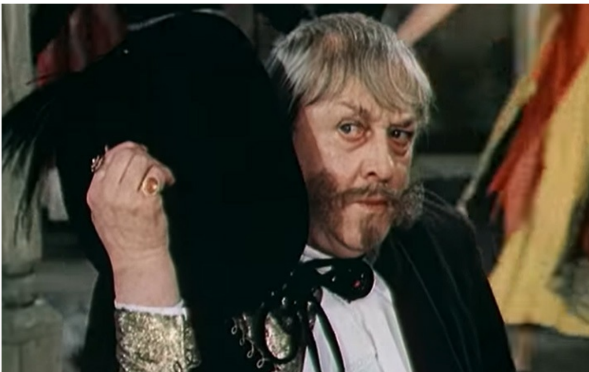
Панательяс в фильме «Перикола», 1984 год

Долгие годы Владислав Стржельчик преподавал актёрское мастерство в Ленинградском государственном институте театра, музыки и кинематографа (ЛГИТМиК) и Ленинградском институте культуры имени Н. К. Крупской.