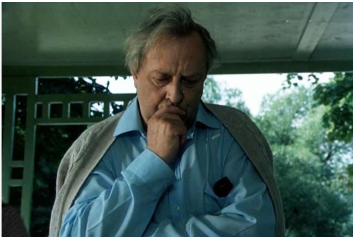
Николаевич в фильме «Время желаний», 1984 год