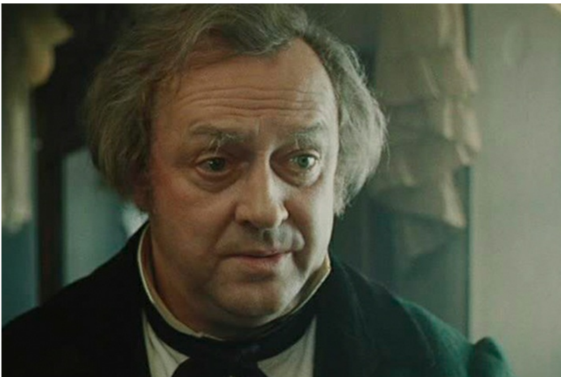
«Женитьба», 1977 год