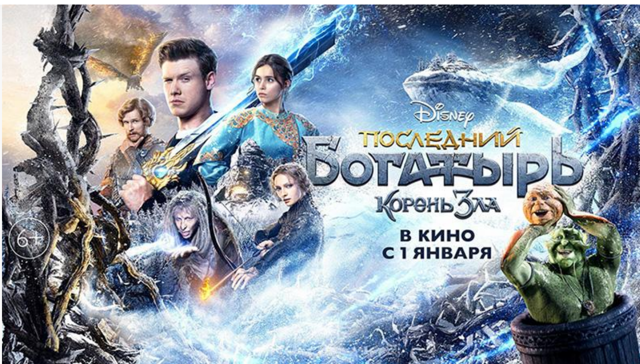
Постер к фильму «Последний богатырь: Корень зла»

Однако не стоит забывать, что лидеры рейтинга выходили в прокат в гораздо более благополучные времена при разрешённой 100-процентной заполняемости залов. Так что с учётом нынешних реалий вершина в 2 миллиарда, которую в ближайшее время покорит «Последний богатырь: Корень зла» – несомненный успех. Ведь с нижних позиций рейтинга ему вслед с завистью и недоумением смотрят такие громкие проекты последних лет, как «Полицейский с Рублёвки. Новогодний беспредел», «Викинг», «Лёд», «Экипаж», «Вторжение» и «Притяжение», не говоря уже о «Тренере», «Времени первых» и «Союзе спасения».