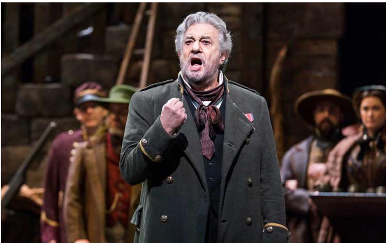
В партии Миллера в опере «Луиза Миллер». Метрополитен опера, 2018 год

Несмотря на то что у Доминго, по его словам, нет любимого музыкального произведения, знаковой для него стала опера «Травиата» Джузеппе Верди. Именно Альфред Жермон был его первой главной партией на сцене Palacio de Bellas Artes, и именно в «Травиате» он впервые выступил в роли дирижёра в 1973 году на сцене Нью-Йорк Сити Оперы.