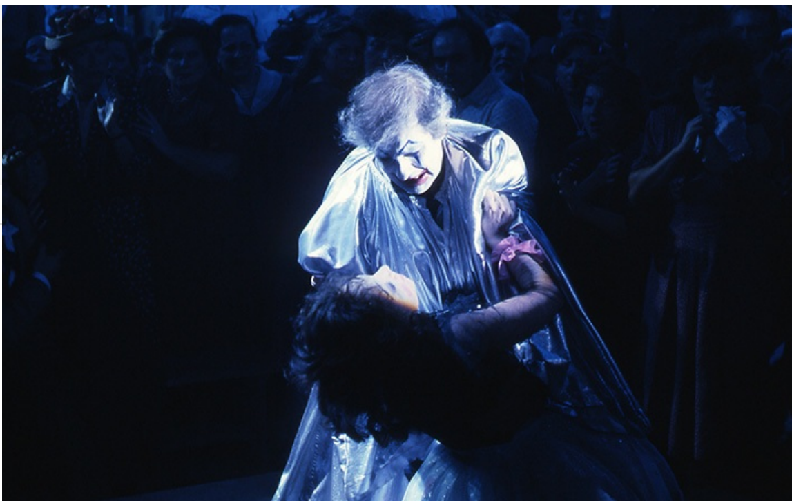
Пласидо Доминго и Тереза Стратас в фильме «Паяцы», 1982 год