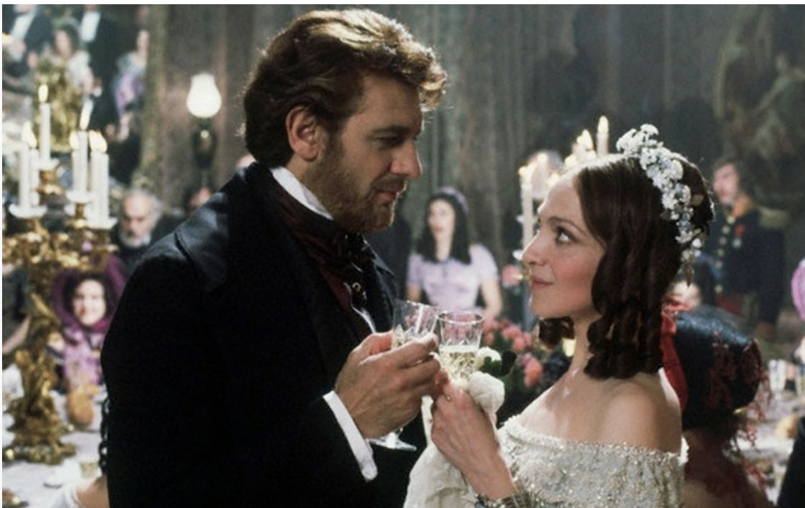
«Травиата», 1982 год