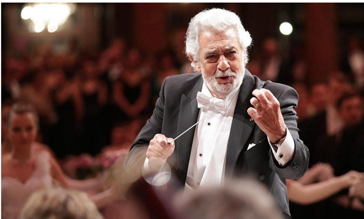
Маэстро Доминго за

Несмотря на то что у Доминго, по его словам, нет любимого музыкального произведения, знаковой для него стала опера «Травиата» Джузеппе Верди. Именно Альфред Жермон был его первой главной партией на сцене Palacio de Bellas Artes, и именно в «Травиате» он впервые выступил в роли дирижёра в 1973 году на сцене Нью-Йорк Сити Оперы.