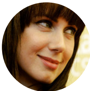
Автор текста: Лера Крышкина , журналист.

Связаться с редакцией Бабра в Иркутской области: irkbabr24@gmail.com