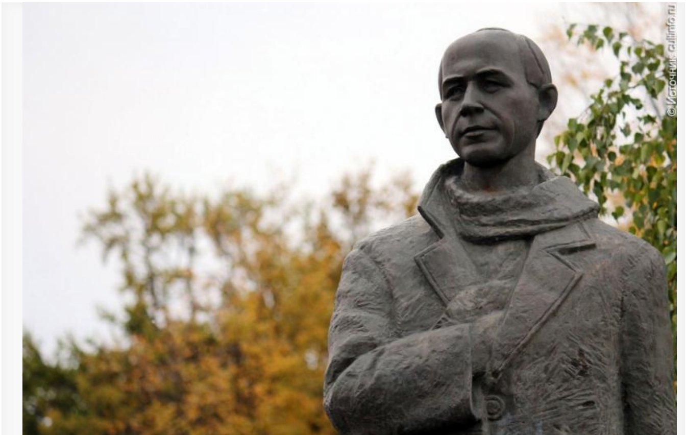
Памятник в Вологде