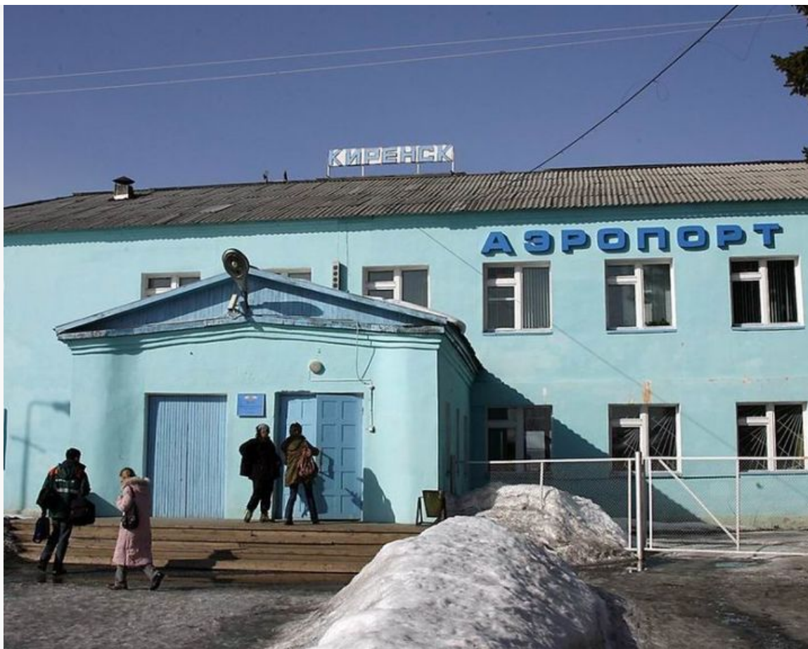
Современный аэровокзал Киренска.