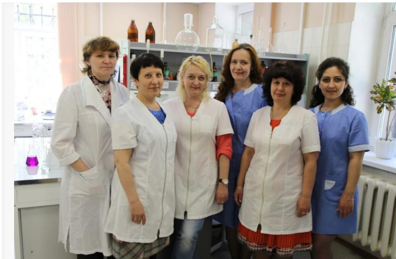
2015 год, Лиана с