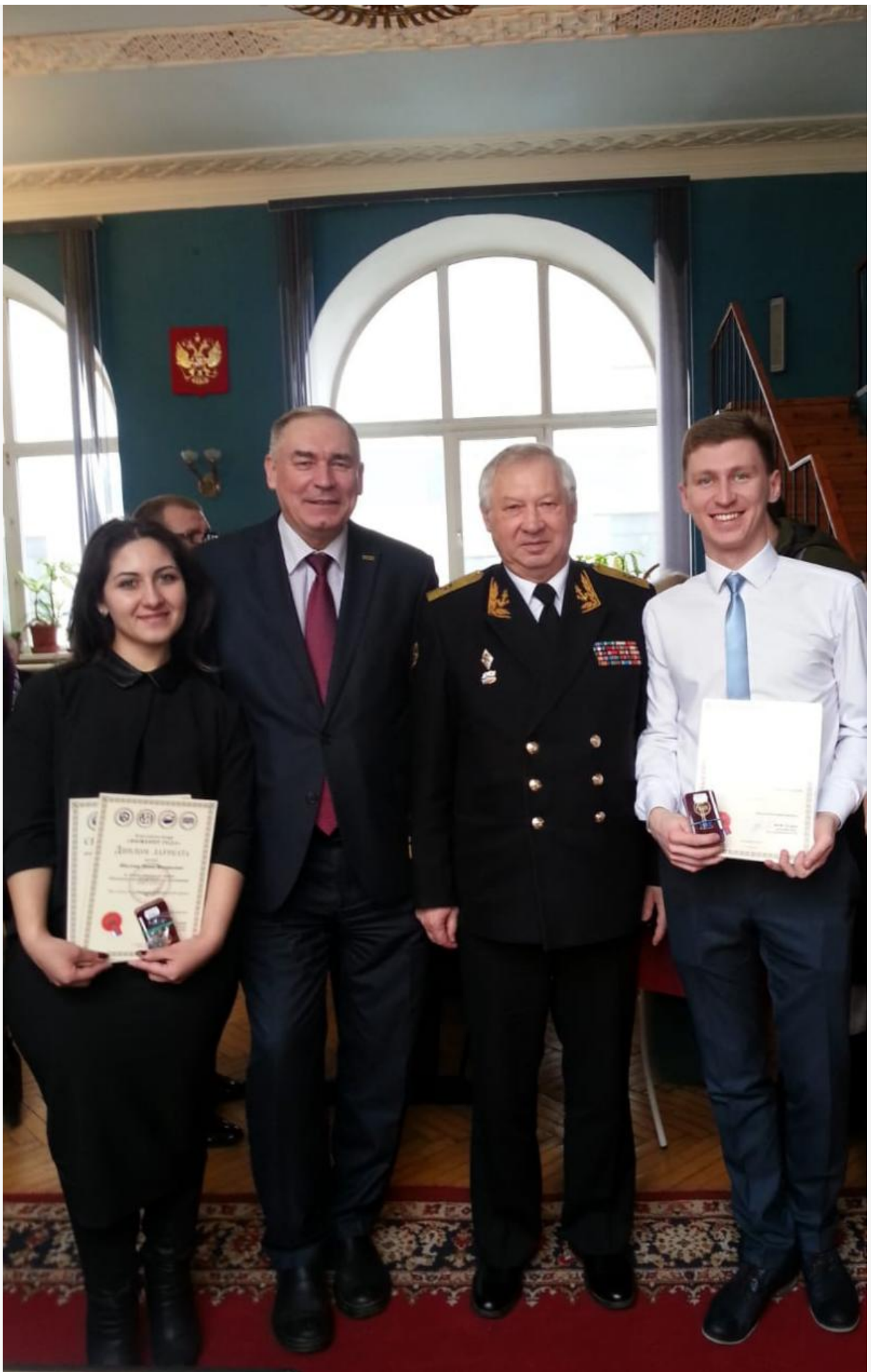
Москва, Дом инженерной славы