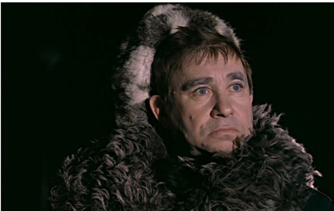
«Чародеи», 1982 год