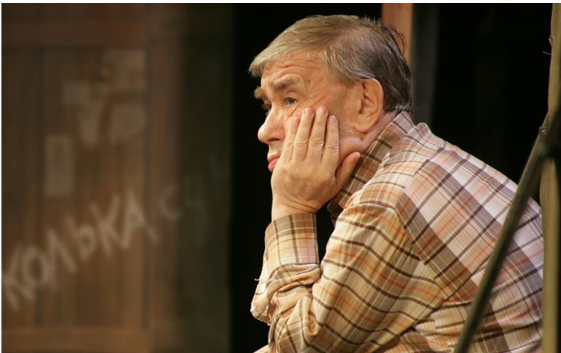
Васильевич в спектакле «Дон Педро». Театр комедии Акимова, постановка 1997 года