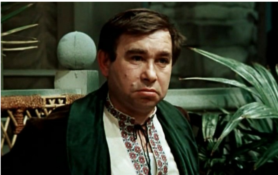
«12 стульев», 1976 год