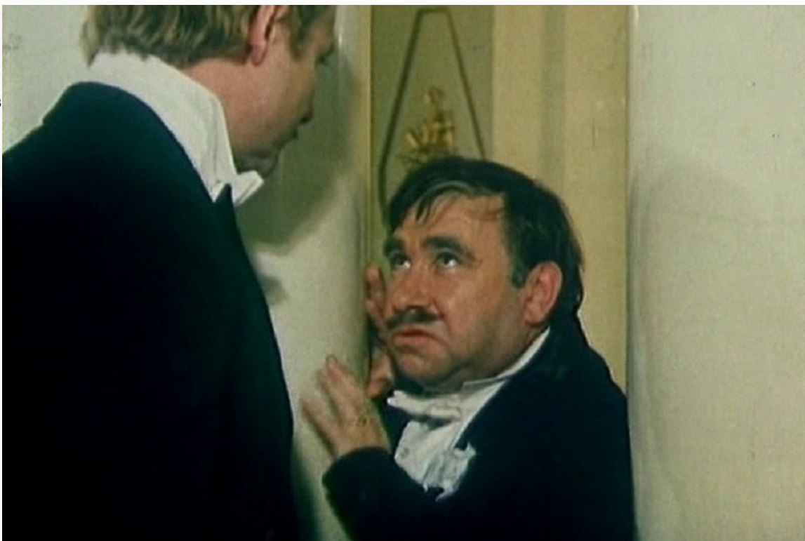
Граф Вильгельм фон Экенберг в фильме «Сильва», 1981 год

В силу долгих мытарств по разным театрам и позднего дебюта в кино и на подмостках Северной столицы, официальное признание пришло к