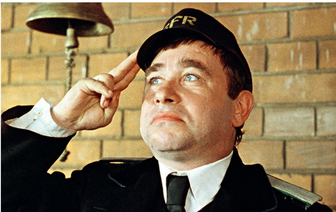
«Безымянная звезда», 1978 год