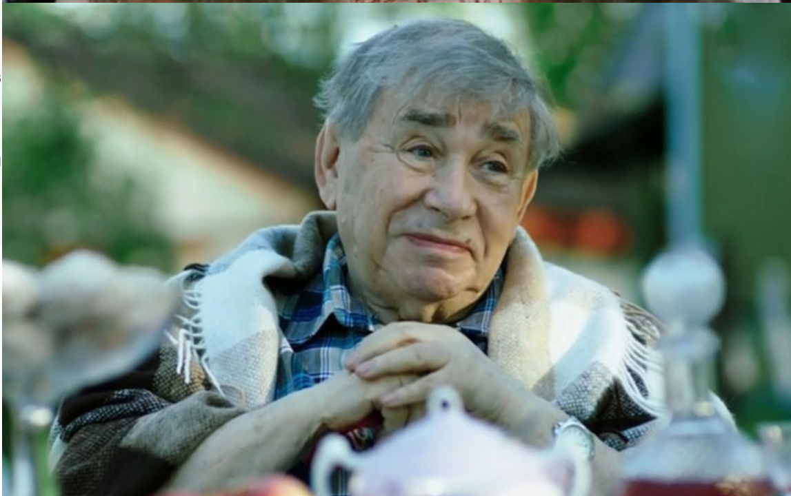
Михаил Светин скончался от инсульта 30 августа 2015 года на 85 году жизни. После прощания в

Театре имени Акимова любимого миллионами актёра похоронили на Серафимовском кладбище Санкт-Петербурга.