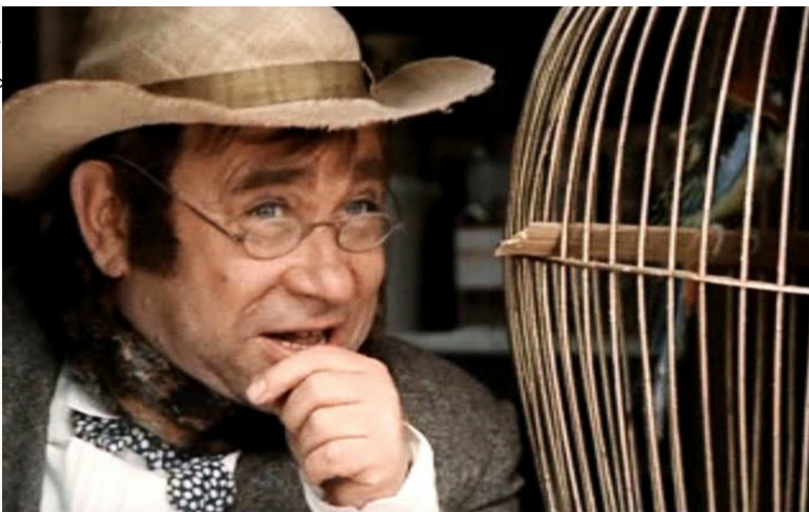
Капуцинов», 1987 год