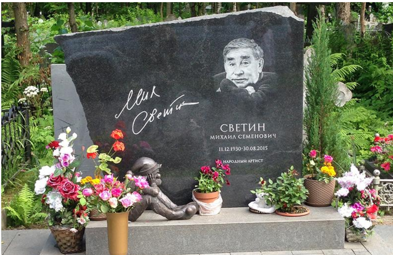
Могила Михаила Светина