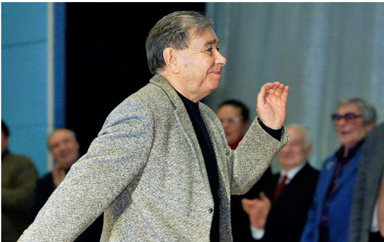
Михаил Светин на кинофестивале «Литература и кино» в Гатчине, 2006 год

11 декабря исполняется 90 лет со дня рождения выдающегося советского и российского актёра театра и кино, народного артиста России Михаила Светина.