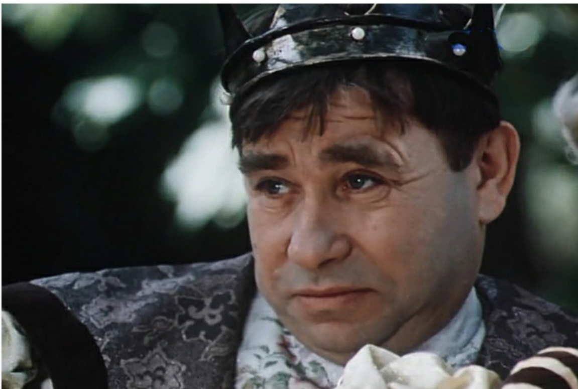
волшебника», 1984 год