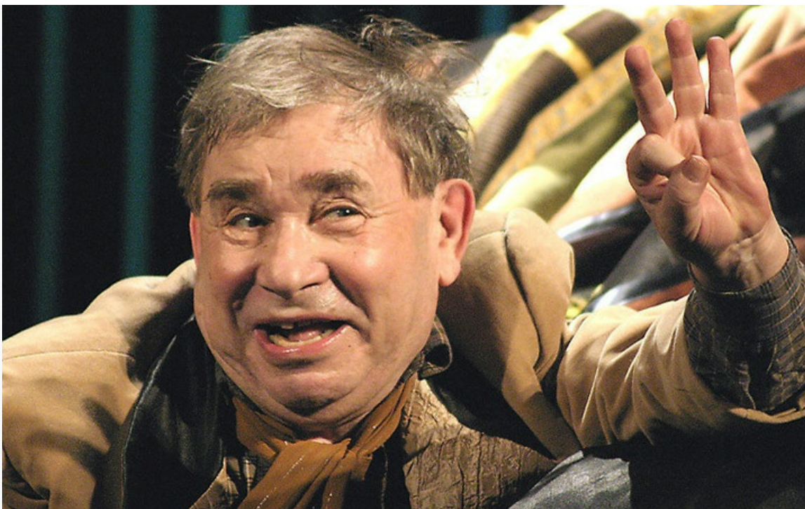
Кречинского». Театр комедии Акимова, постановка 2004 года