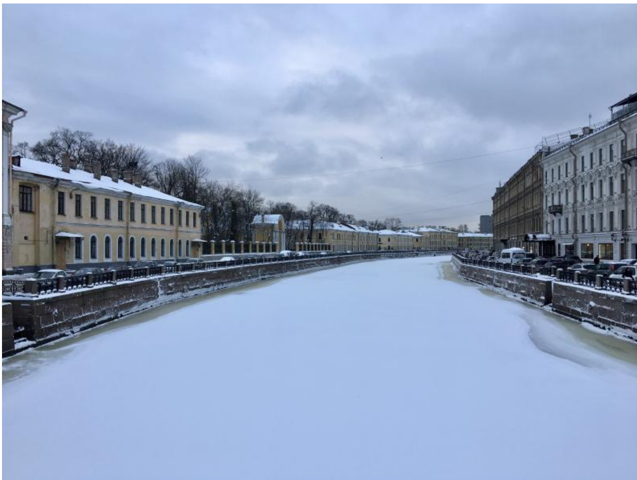
Фото: atorus.ru .

Автор: Елена Берёзка © Babr24.com ЭКОНОМИКА И БИЗНЕС, ЗДОРОВЬЕ, ТУРИЗМ, РОССИЯ 👁 18484 09.12.2020, 19:20 🔄 1086