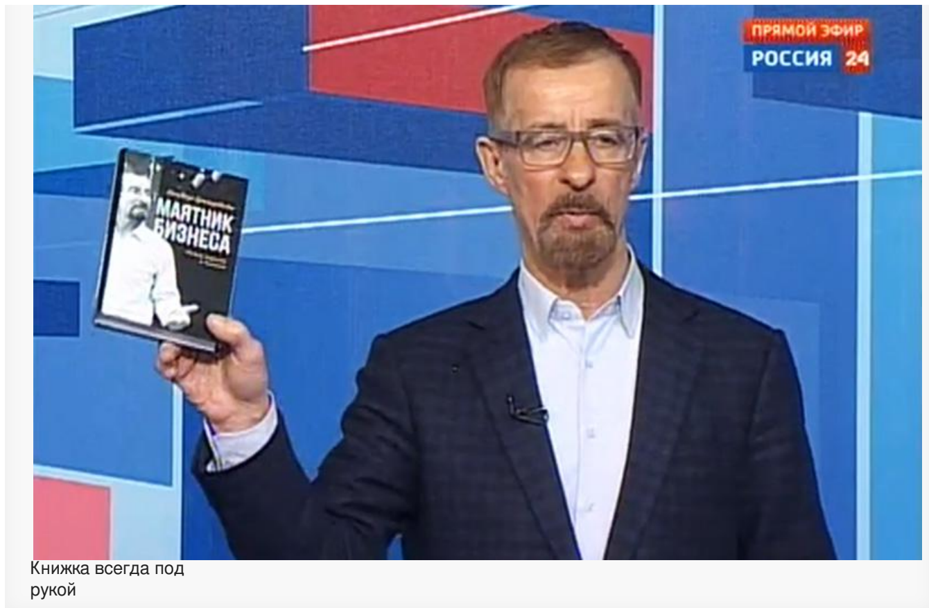
Книжка всегда под рукой