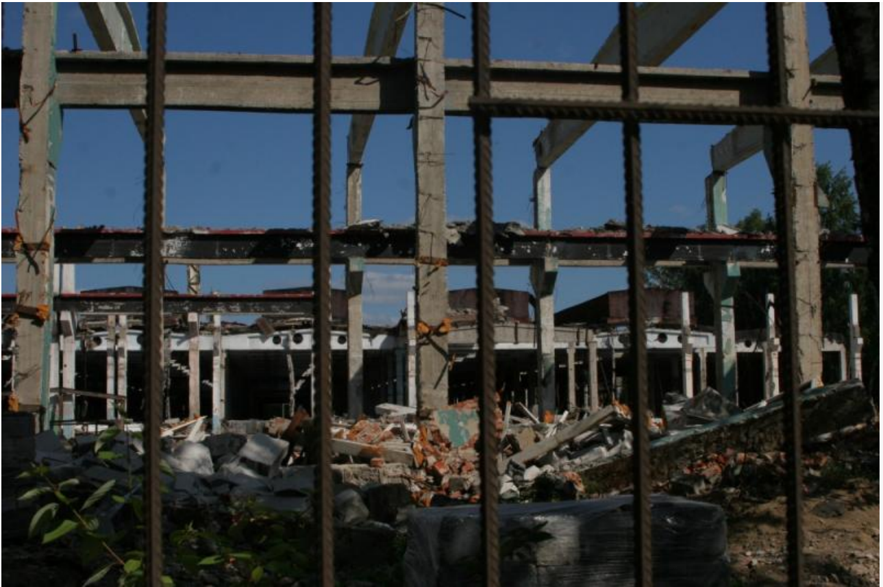
Руины Радиотехнического завода

2013 год был «богат» на банкротства, в частности разорилось Томское продовольственное объединение «Контур», созданное ещё в 1960 году. Основная деятельность предприятия – разработка и производство средств автоматизации и автоматизированных комплексов. По результатам инвентаризации, имущество «Контур» составило 486,7 миллионов рублей. Большую часть активов и земли скупил опять-таки Аминов. И опять-таки за бесценок: нежилые помещения завода площадью 48 988 квадратных метров за 5,6 миллиона рублей; земельный участок площадью 7 347 квадратных метров и производственные помещения площадью 5 810 квадратных метров за 6,7 миллиона рублей и так далее.