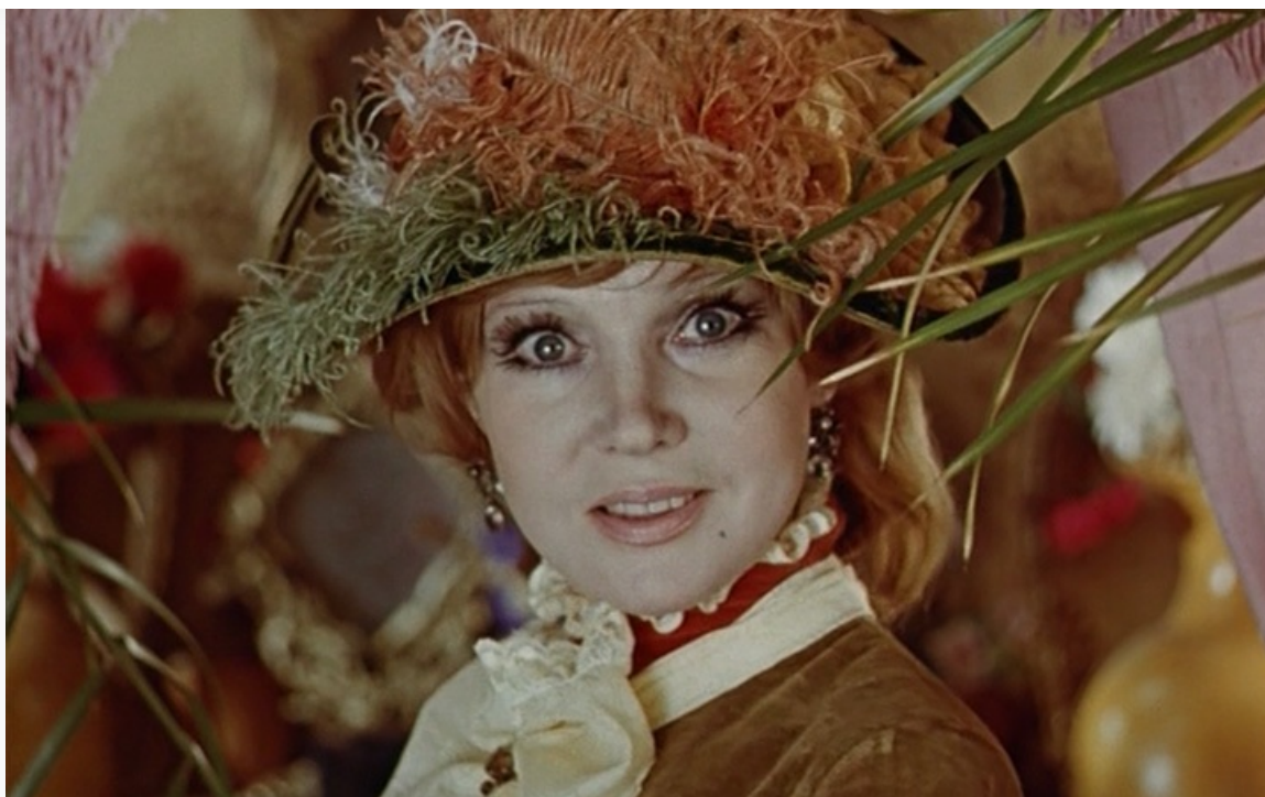
«Красавец-мужчина», 1978 год