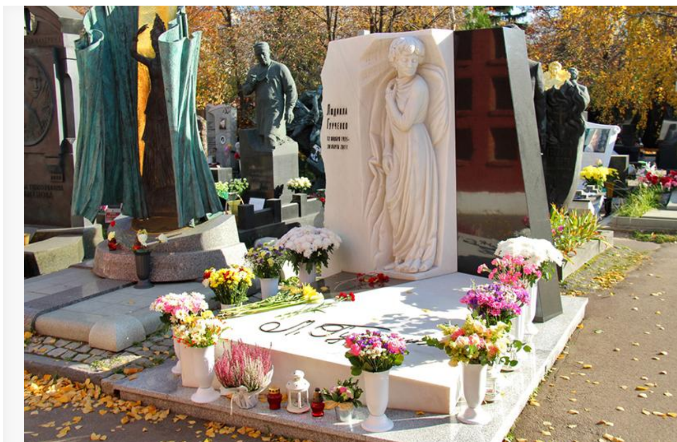
Могила Людмилы Гурченко

Подробнее о жизни и перипетиях творческого пути Людмилы Гурченко можно прочитать в её книгах «Моё взрослое детство», «Аплодисменты» и «Люся, стоп!».