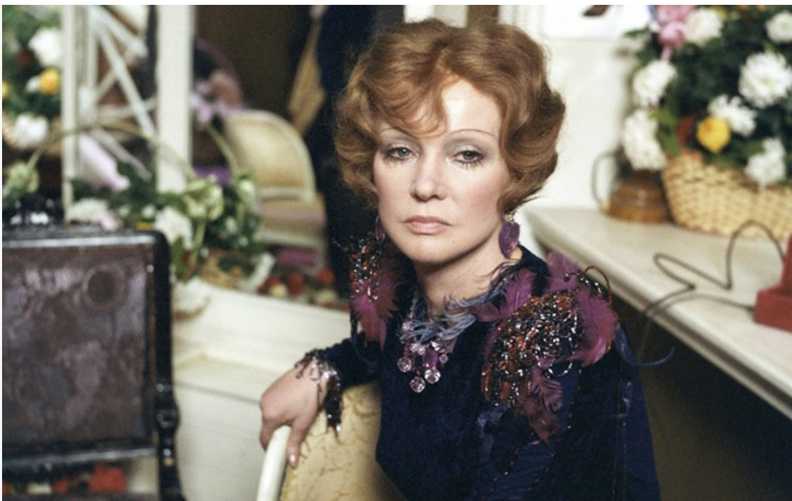
«Рецепт её молодости», 1983 год

Будущая легенда отечественного кинематографа родилась 12 ноября 1935 года в Харькове в творческой семье музыкантов местной филармонии. После окончания школы с первой попытки поступила в столичный Всесоюзный государственный институт кинематографии на курс Сергея Герасимова и Тамары Макаровой.