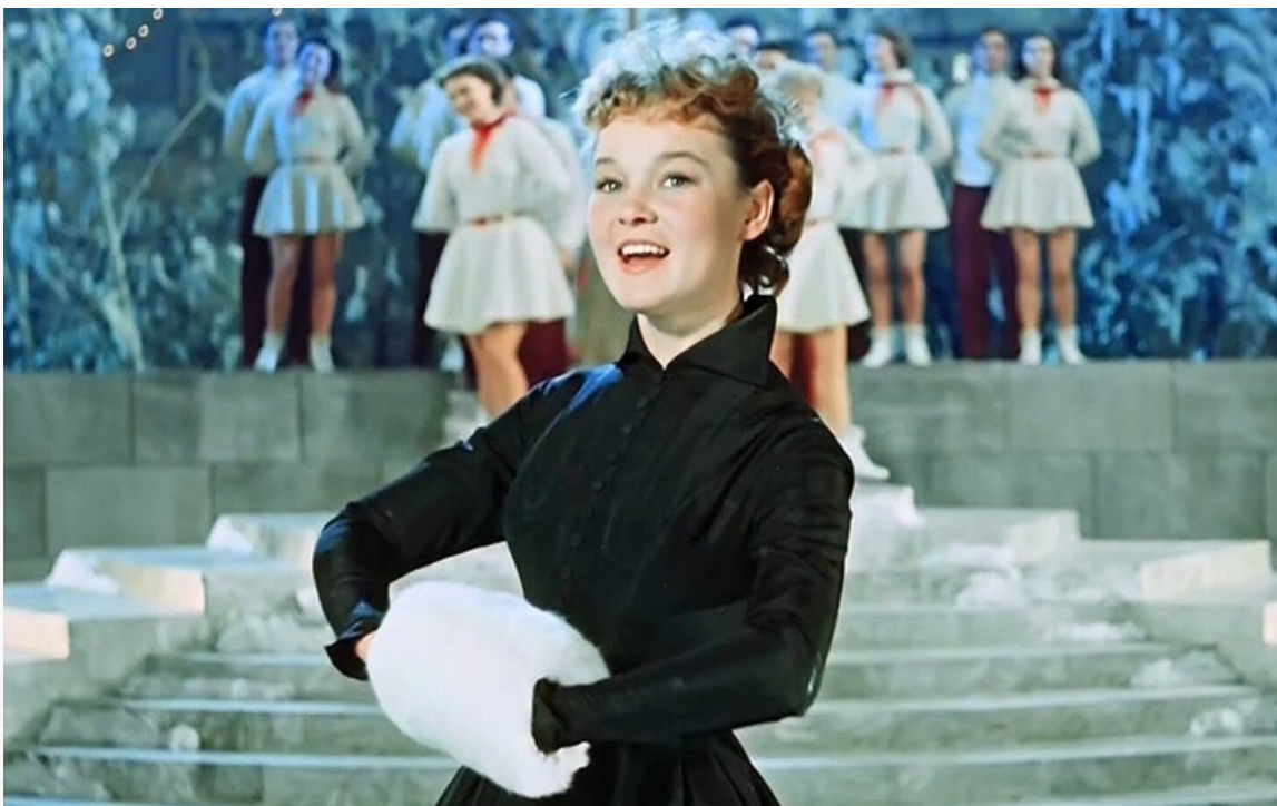
«Карнавальная ночь», 1956 год