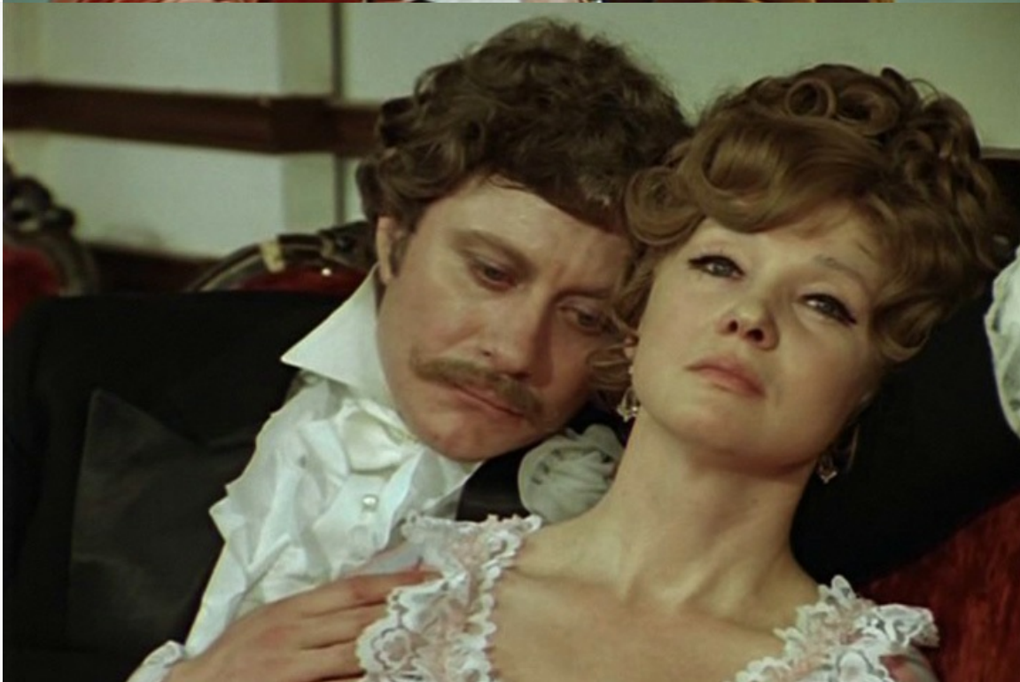
«Соломенная шляпка», 1974 год