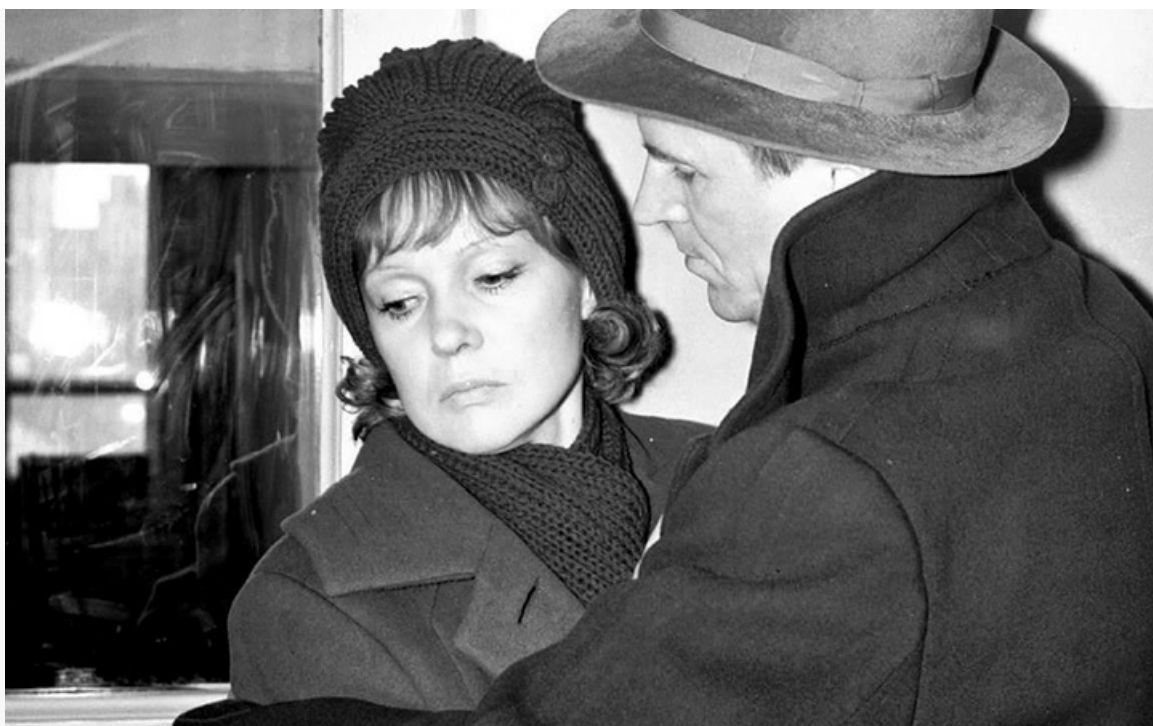
Васильевна в фильме «Пять вечеров», 1978 год

Поистине звёздным временем для актрисы, если не считать сумасшедшего по популярности кинодебюта, стала первая половина 1980-х годов прошлого века. На экраны страны один за другим вышли фильмы с участием Гурченко «Любимая женщина механика Гаврилова», «Полёты во сне и наяву», «Вокзал для двоих», «Рецепт её молодости», «Любовь и голуби», «Прохиндиада, или Бег на месте».