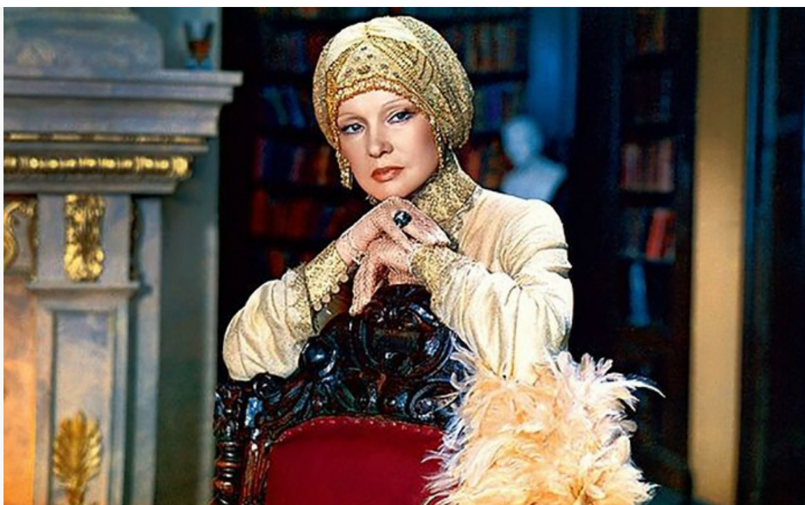
«Идеальный муж», 1980 год