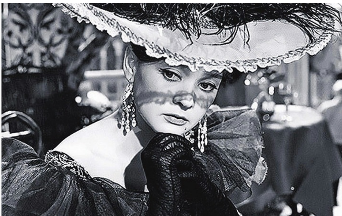
«Гулящая», 1961 год