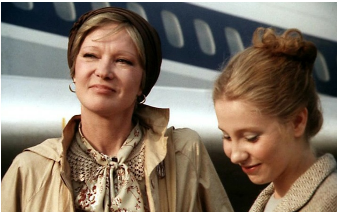
Ада Петровна в фильме «Отпуск за свой счёт», 1981 год