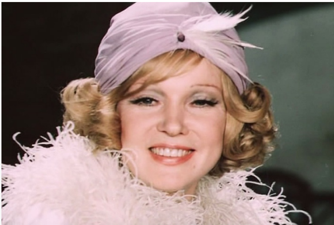
«Небесные ласточки», 1976 год