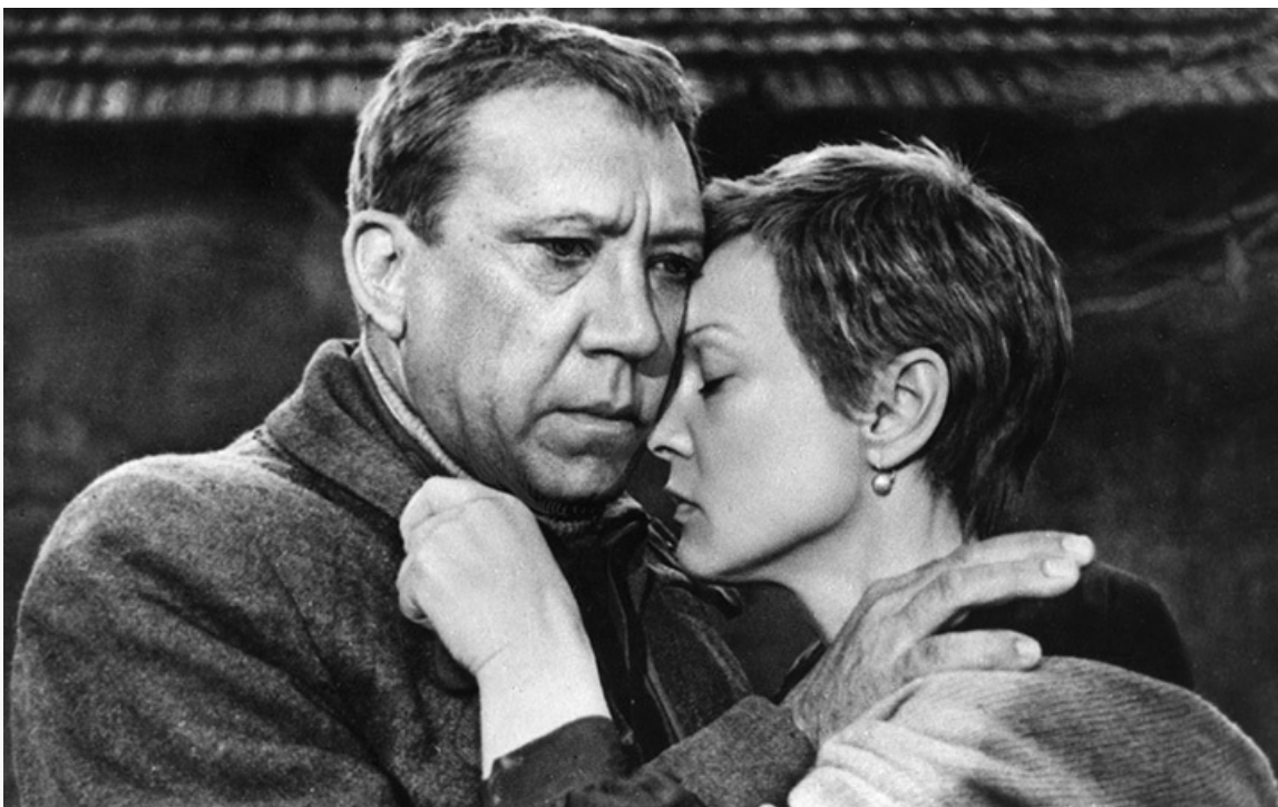
Николаевна в фильме «Двадцать дней без войны», 1976 год