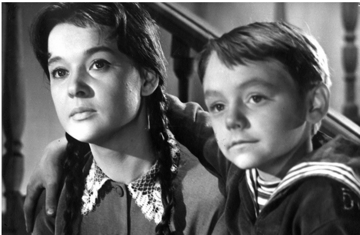
«Балтийское небо», 1961 год