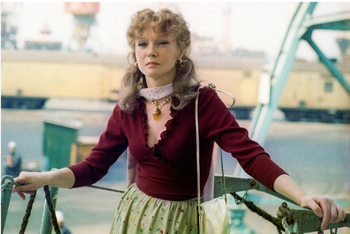
Гаврилова», 1981 год