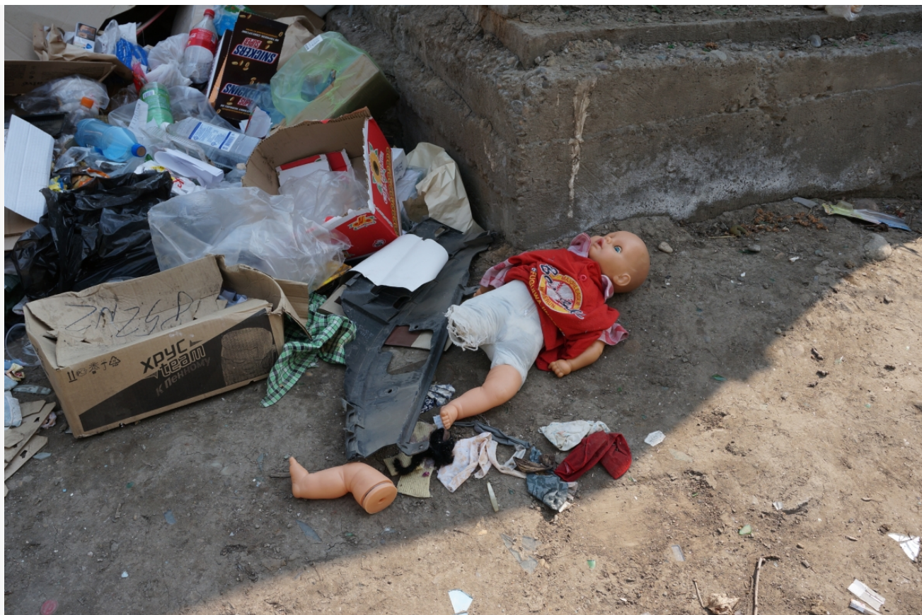
Автор: Даниил Тетерин Фото из альбома "Мусор" © Фотобанк "RuBabr"

В ответ на претензии государственных контролеров, Ассоциация «Чистая страна» обвиняла во всем неосознательное население, не забывая пополнять свои счета взносами от «убыточных» региональных операторов.