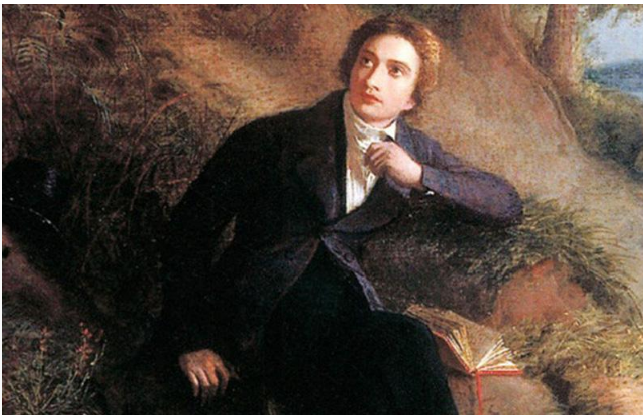
Картина «Джон Китс слушает соловья в Хэмпстедской Пустоши» кисти художника Джозефа Северна (фрагмент)

31 октября литературный мир отмечает 225-летие со дня рождения великого британского поэта-романтика Джона Китса.