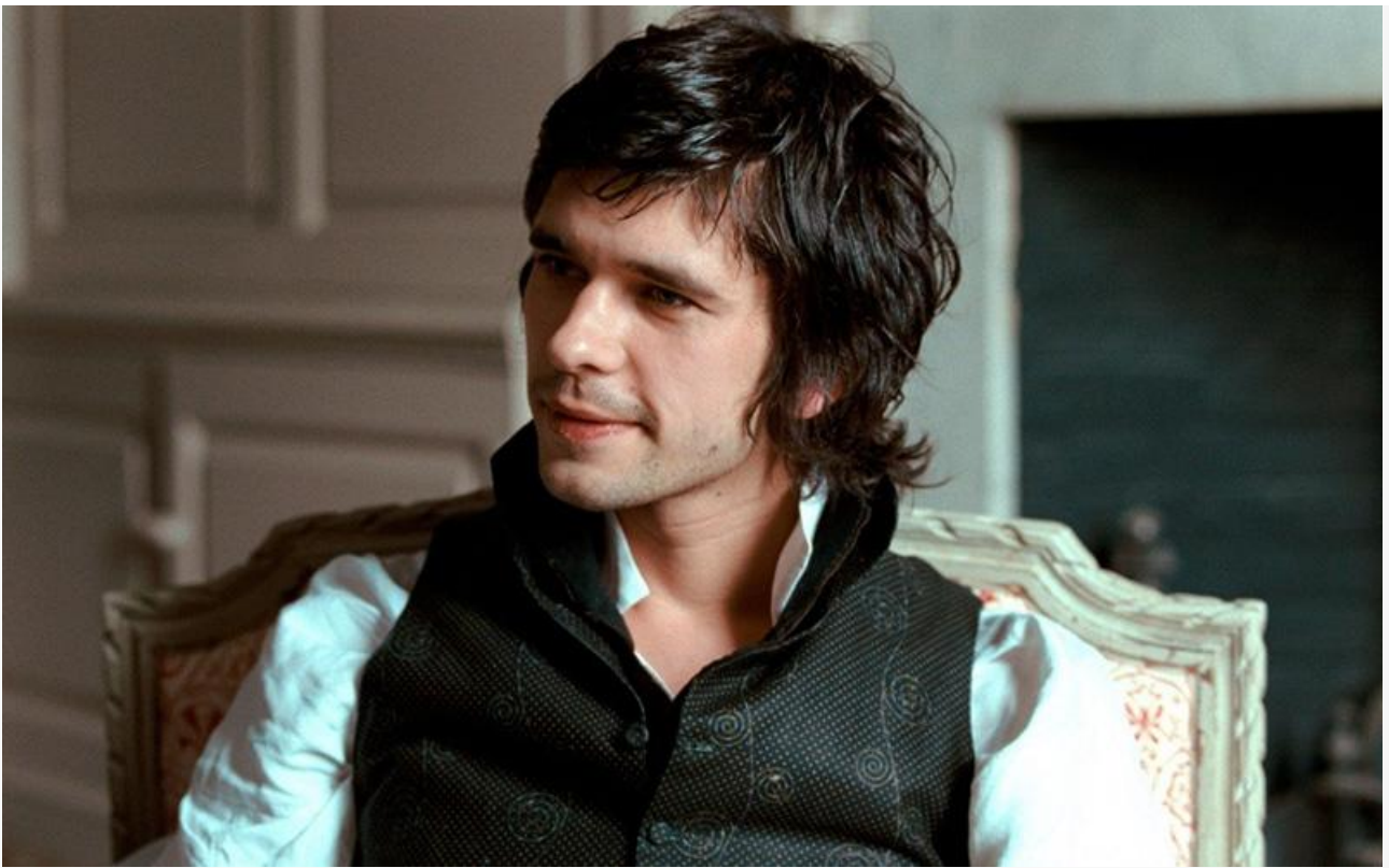
Бен Уишоу в роли Джона Китса в фильме «Яркая звезда»

К юбилею поэта мы по традиции публикуем отрывки из его стихотворений, сонетов и поэмы «Эндимион» в переводах Самуила Маршака, Сергея Сухарева, Бориса Пастернака и Вильгельма Левика.