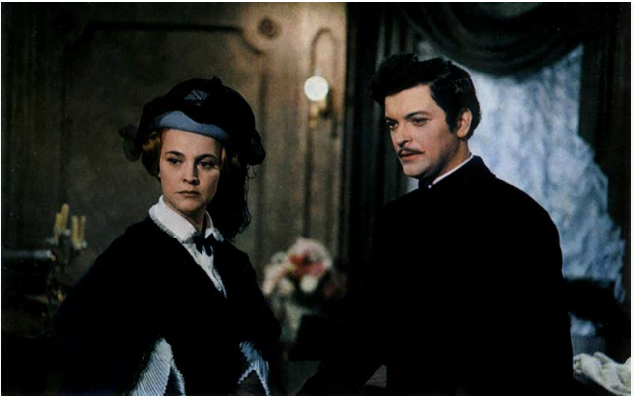
Гирт Яковлев в роли Штрауса в фильме «Прощание с Петербургом»