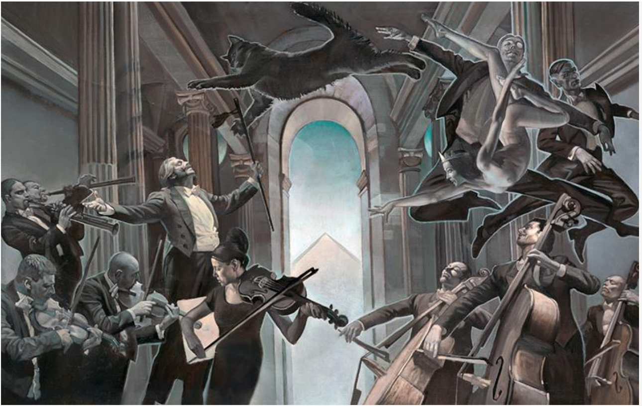
Иоганн Штраус дирижирует оркестром на балу у сатаны.