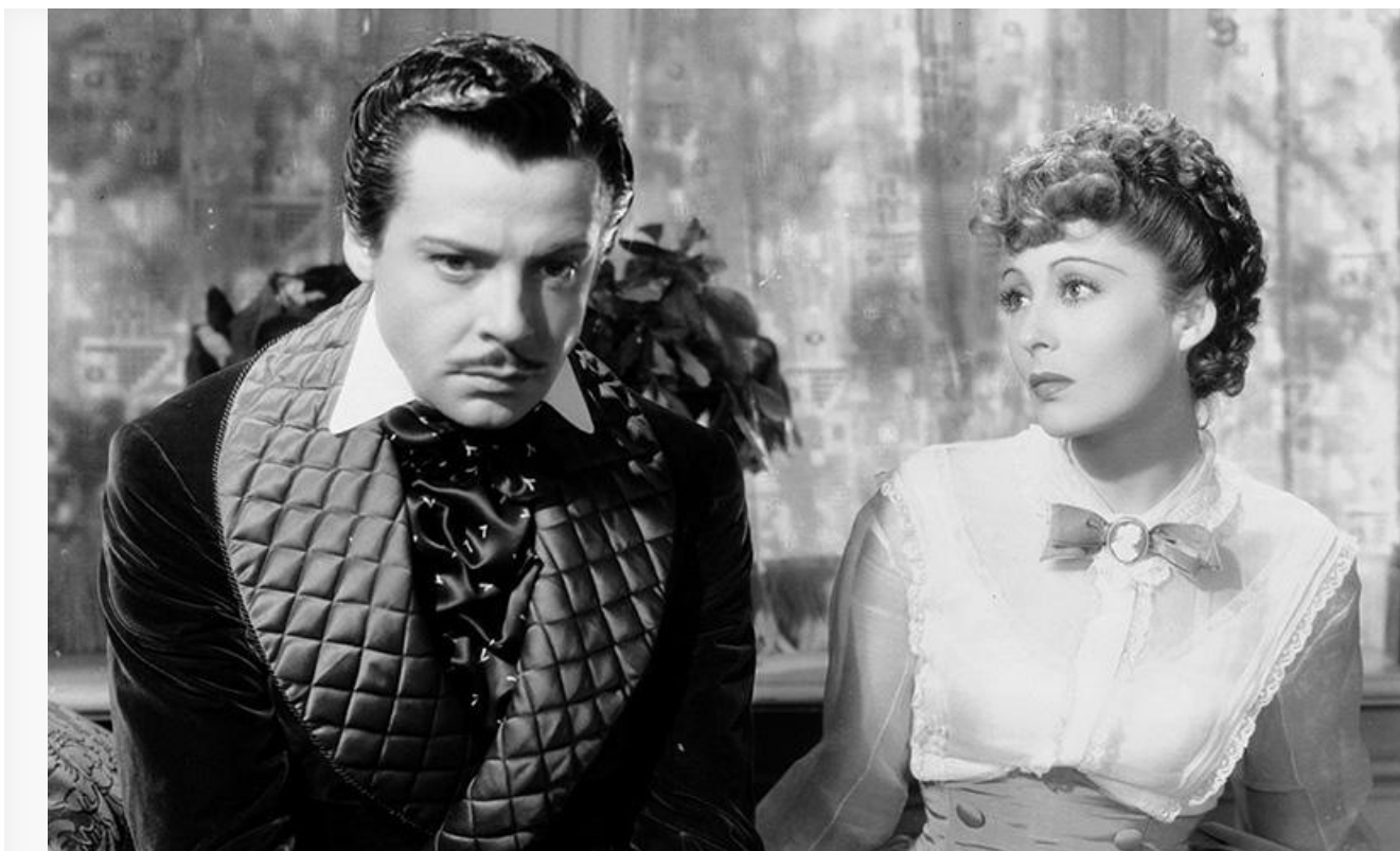
Фернан Гравей в роли Штрауса в фильме «Большой вальс»

Картина наполнена музыкой «короля вальсов» в обработке американского кинокомпозитора российского происхождения Дмитрия Тёмкина.