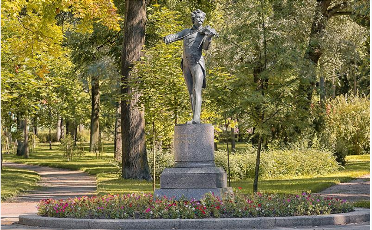
Памятник Иоганну Штраусу в Павловске

Жизни и творчеству Штрауса посвящён ещё один фильм – знаменитый «Большой вальс» Жюльена Девилье с Фернаном Гравеем и Милицей Корьюс в главных ролях, вышедший на экраны в 1938 году.