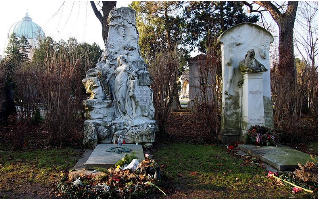
Могила Иоганна Штрауса (справа могила Иоганнеса Брамса)