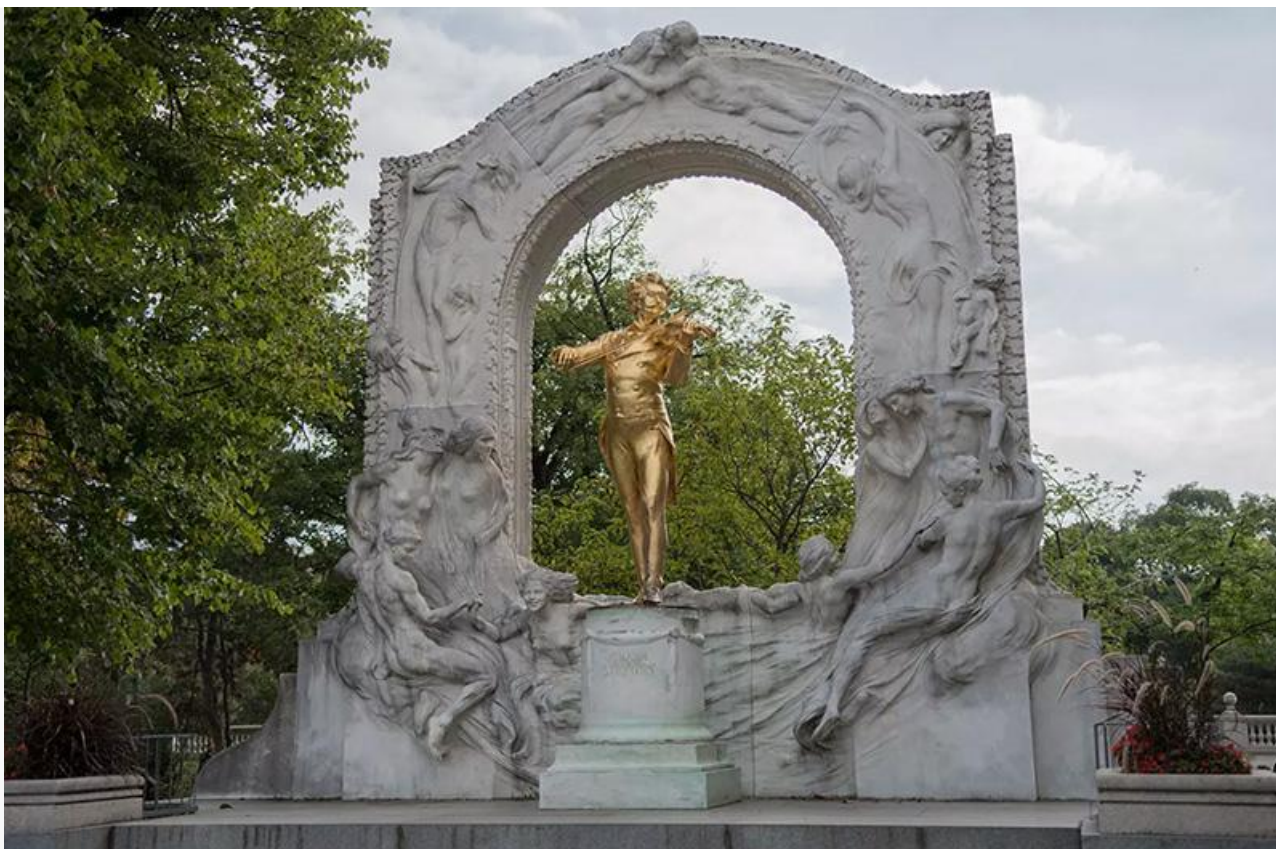
Памятник Иоганну Штраусу-младшему в Вене

По иронии судьбы, именно сыну Штраус I обязан тем, что его имя окончательно не кануло в лету. После ранней смерти отца Иоганн за свой счёт издал полное собрание сочинений родителя, взял под своё крыло музыкантов его оркестра и не забывал на концертах исполнять его произведения.