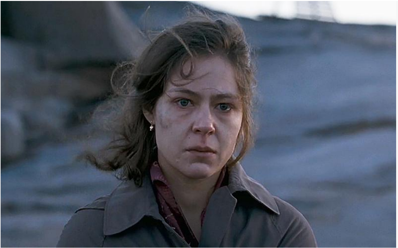
Елена Лядова в фильме «Левиафан», 2014 год

Ну а за пределами призовой тройки, так же как и в мужском рейтинге, началось веселье. На четвёртом и пятом местах расположились Вера Брежнева (30 баллов) и Кристина Асмус (29,5 балла). Заслуги первой сводятся к высокой медийности и съёмках в «Ёлках последних», «Джунглях» и «Любви в большом городе», второй – к ролям в драме «А зори здесь тихие...», скандальном «Тексте» и патриотичных «Чемпионах», да к званию самой сексуальной женщины России от журнала Maxim в далёком 2010-м.