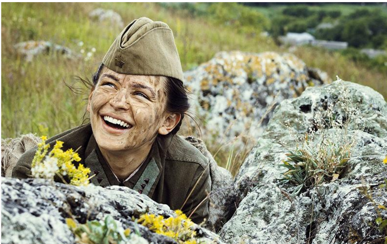
Юлия Пересильд в фильме «Битва за Севастополь», 2015 год

Также в десятке лучших Ксения Раппопорт с «Золотым орлом» и призами кинофестивалей в Таормине и Москве, а также Ирина Горбачёва с «Никой» и «Золотым орлом» за фильм «Аритмия».