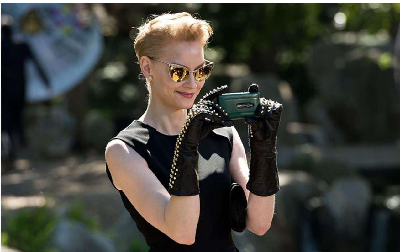
Светлана Ходченкова в фильме «Росомаха: Бессмертный», 2013 год

Однако главную лепту в победу актрисы внесли её съёмки в зарубежных проектах «Шпион, выйди вон!» и «Росомаха: Бессмертный», а также премия «Золотой орёл» за лучшую женскую роль второго плана (фильм «Довлатов»). Баллов за медийность добавили звание «Женщина года» от журнала Glamour и приз за лучшую женскую роль Пхеньянского кинофестиваля (фильм «Василиса»).