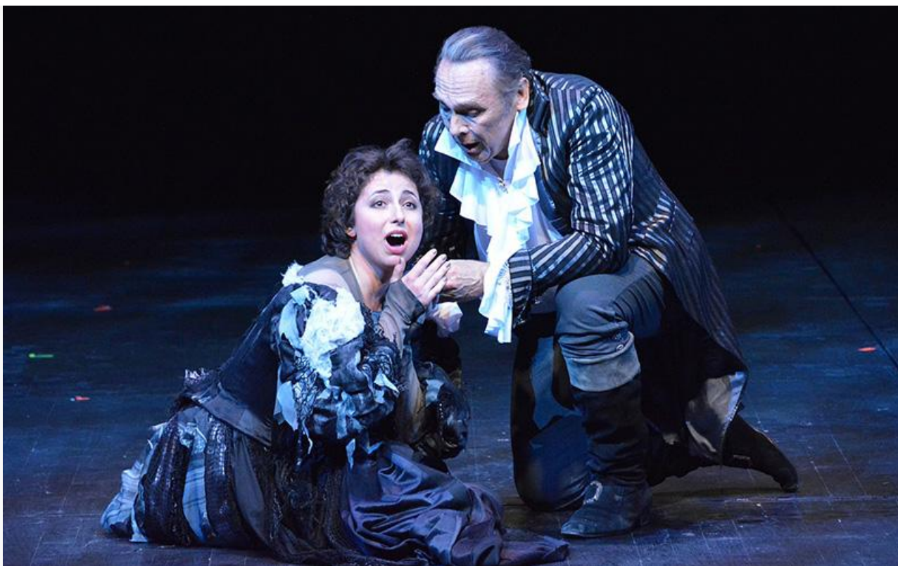
75-летие певца на сцене «Геликон-оперы», 2016 год

После ухода из Большого театра в 1989 году легендарный тенор ещё семь лет выступал на сцене Берлинской государственной оперы.