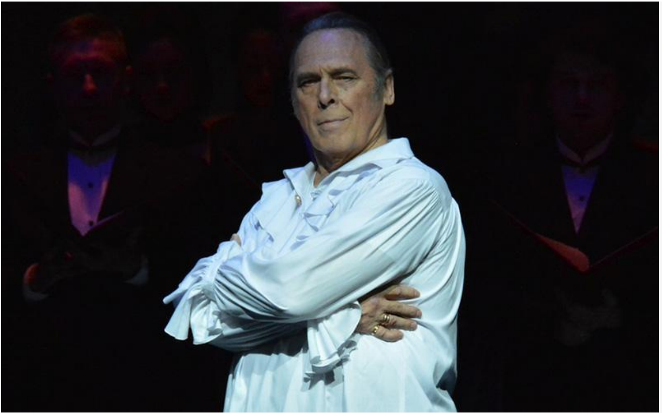
75-летие певца на сцене «Геликон-оперы», 2016 год

Владислав Пьявко – автор нескольких сборников стихотворений, книги воспоминаний «Тенор... (Из хроники прожитых жизней)», а также пьесы «Исповедь тенора», поставленной в 2019 году на сцене Владимирского академического театра драмы.