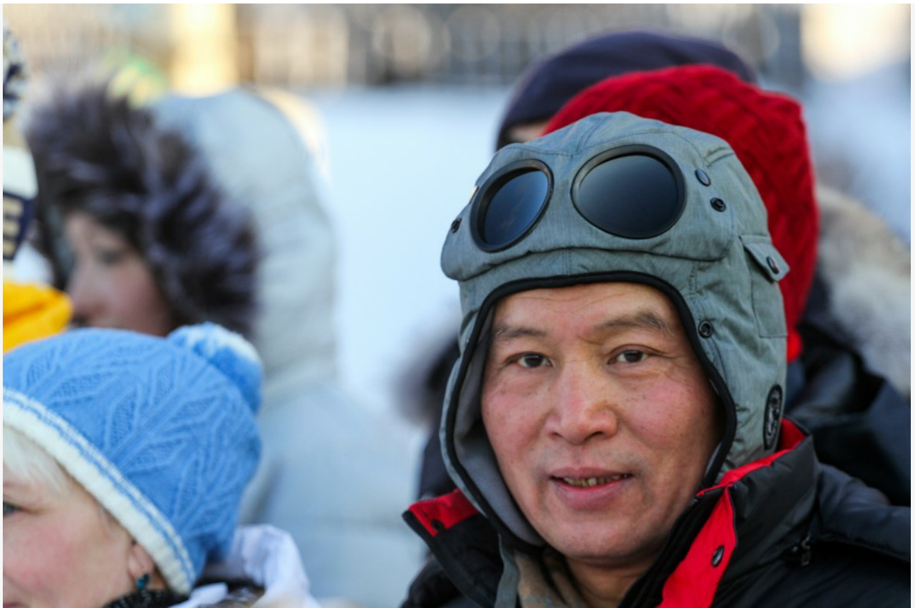
Автор: Кирилл Шипицин Фото из альбома "Байкал - китайские туристы" © Фотобанк "RuBabr"

Для начала обратим внимание на наших нелегальных коллег. Эти ребята действуют сплочённо и уверенно, предоставляя полный спектр услуг. Они набирают клиентуру в Китае и сопровождают её от самолёта до самолёта.