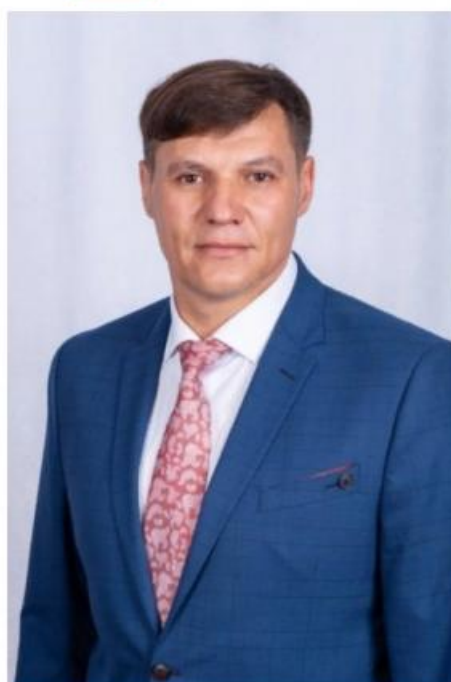
Депутат по избирательному округу № 21