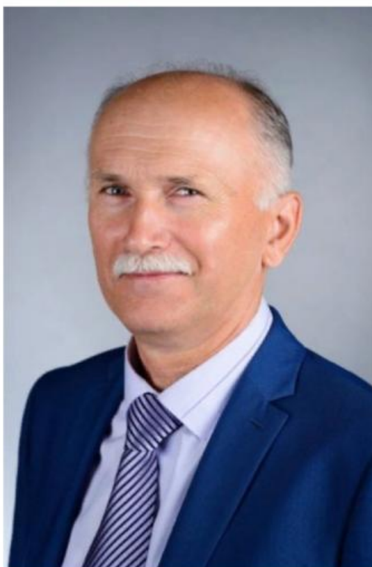
Депутат по избирательному округу № 2