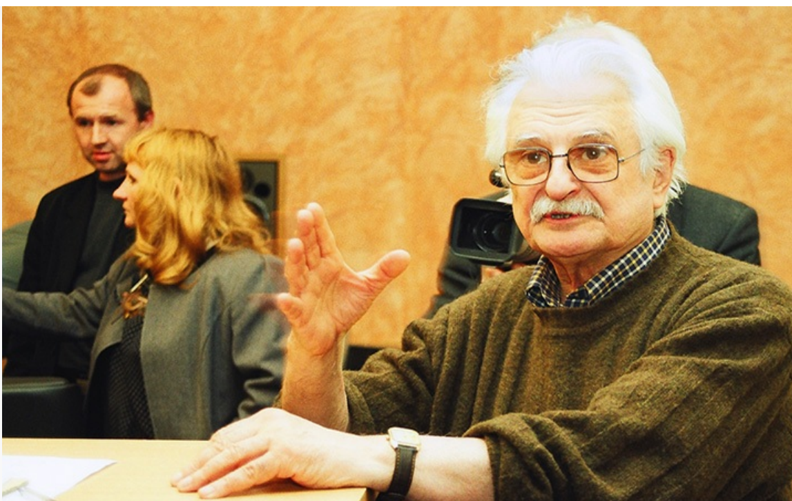
документального фильма «Люди 1941 года», 2001 год

Родился будущий флагман кинематографической оттепели шестидесятых, чью фильмографию называют «многотомной энциклопедией советской жизни», 4 октября 1925 года в Тифлисе (сейчас Тбилиси, Грузия), где вырос и окончил школу.