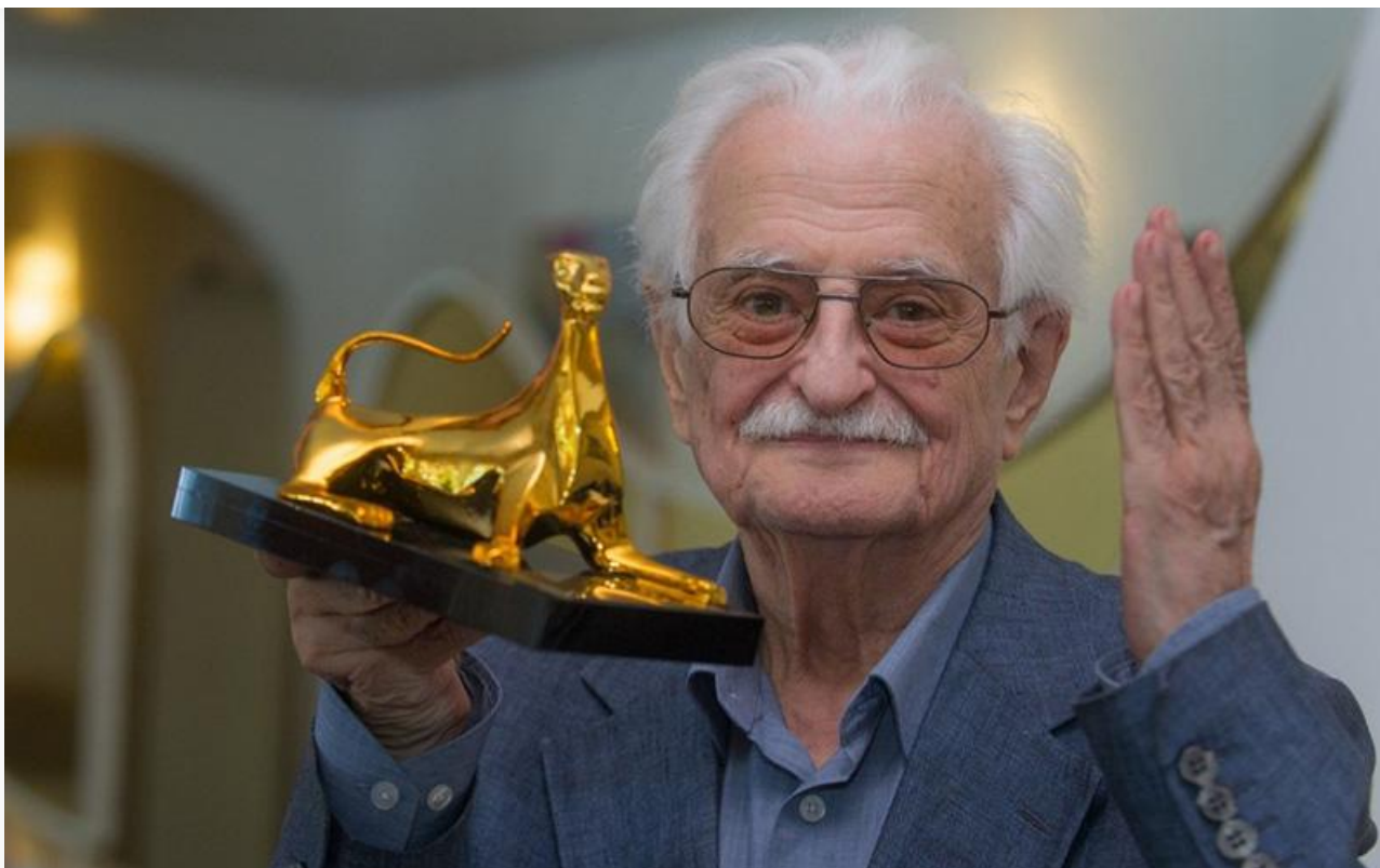
Марлен Хуциев с «Почётным Леопардом» Международного кинофестиваля в Локарно за вклад в мировое киноискусство, 2015 год

4 октября исполняется 95 лет со дня рождения великого советского и российского кинорежиссёра и педагога грузинского происхождения, лауреата Государственной премии России, призов множества кинофестивалей, премий «Ника» и «Золотой овен», заслуженного деятеля искусств РСФСР, народного артиста СССР Марлена Хуциева.