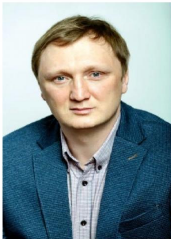
Депутат по избирательному округу № 1С

Категория: Депутаты Создано: 02 марта 2015