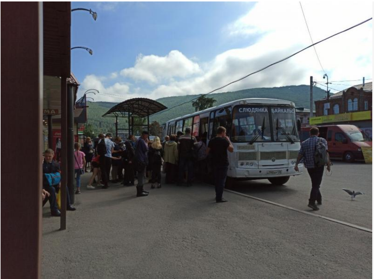
Очередь в автобус в Слюдянке. Люди без средств индивидуальной защиты, дистанция не соблюдается

Так почему власти на муниципальном и региональном уровне замалчивают реальное количество больных коронавирусом? В этой ситуации есть все основания предполагать, что цифры намерено занижены по одной простой причине: на носу выборы. А выборы – дело, которое не повернуть без общественного отклика. Вот «сверху» и дали указ сгладить ситуацию для организации хорошей явки. Ценой жизнью и здоровьем людей.