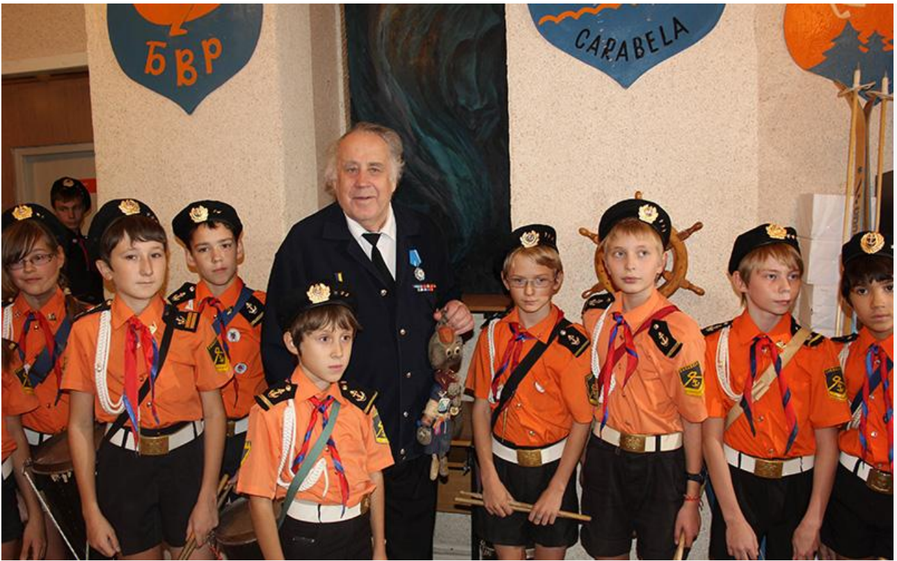
Владислав Крапивин в родной «Каравелле» после возвращения из Тюмени в Екатеринбург, 2013 год

Без лишних преувеличений Крапивин – ярчайшее явление современной детской литературы. Его социальные произведения и повести философско-фантастического цикла «В глубине Великого Кристалла» изданы многомиллионными тиражами и переведены на множество языков мира, а трилогия «Мальчик со шпагой» вошла в серию «Золотая библиотека. Избранные произведения для детей и юношества».