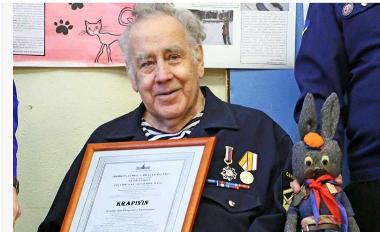
Владислав Крапивин с сертификатом о присвоении планете его имени

В память о любимом с детства авторе мы публикуем не по-детски глубокомысленные и мудрые фразы его героев из романов, рассказов и повестей «Мальчик со шпагой», «Журавлёнок и молнии», «Та сторона, где ветер», «Трое с площади Карронад», «Дети Синего Фламинго», «Бронзовый мальчик», «Голубятня на жёлтой поляне», «Стража Лопухастых островов», «Колыбельная для брата» и «Гуси-гуси, га-га-га...».