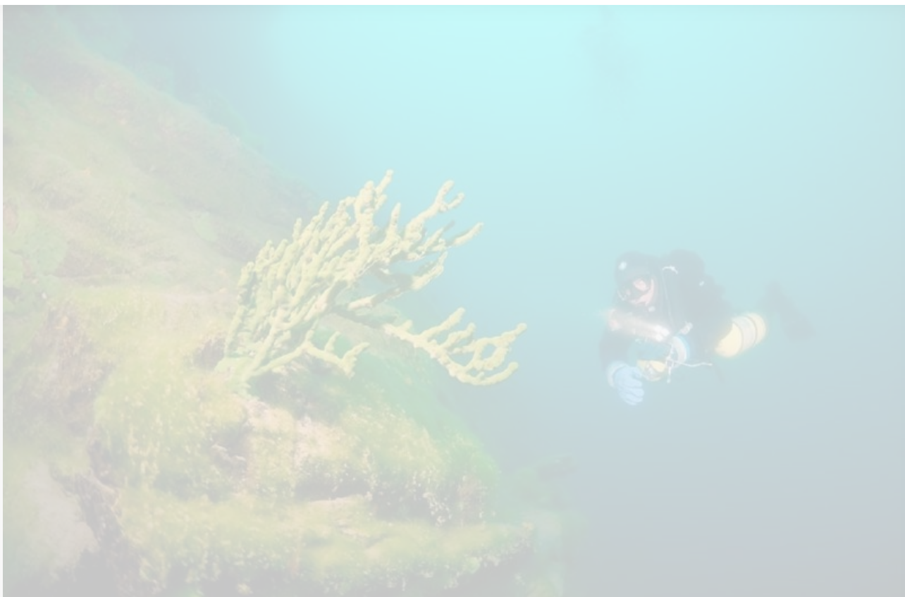
Крестовка. Губки значительно меньше. Водоросли `ушли` за свал. 2012

В конце Наталья сообщает, что тема дейли-дайвинга в Листвянке закрыта. Ни ей, ни другим не хочется нырять в помойке, с ревущими моторами над головой.