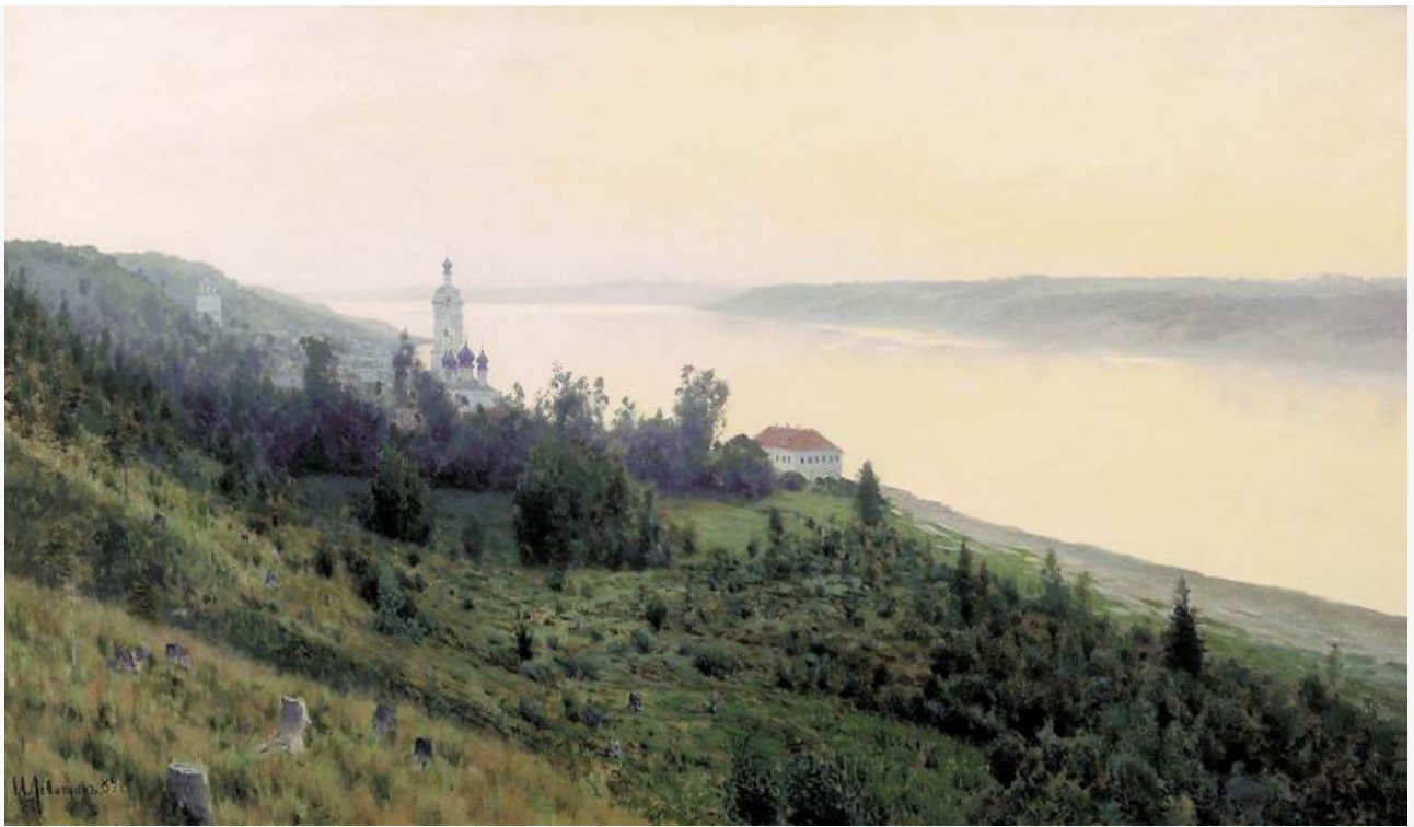
Вечер. Золотой Плѣс, 1889. Хранится в Третьяковской галерее