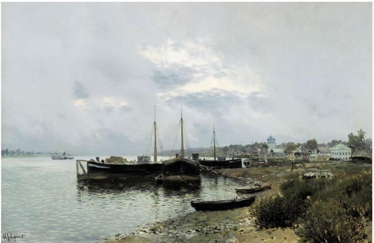
После дождя. Плѣс, 1889. Хранится в Третьяковской галерее