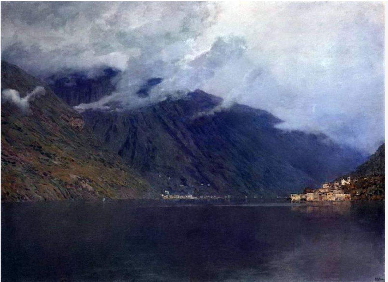
Озеро Комо, 1895. Хранится в Русском музее