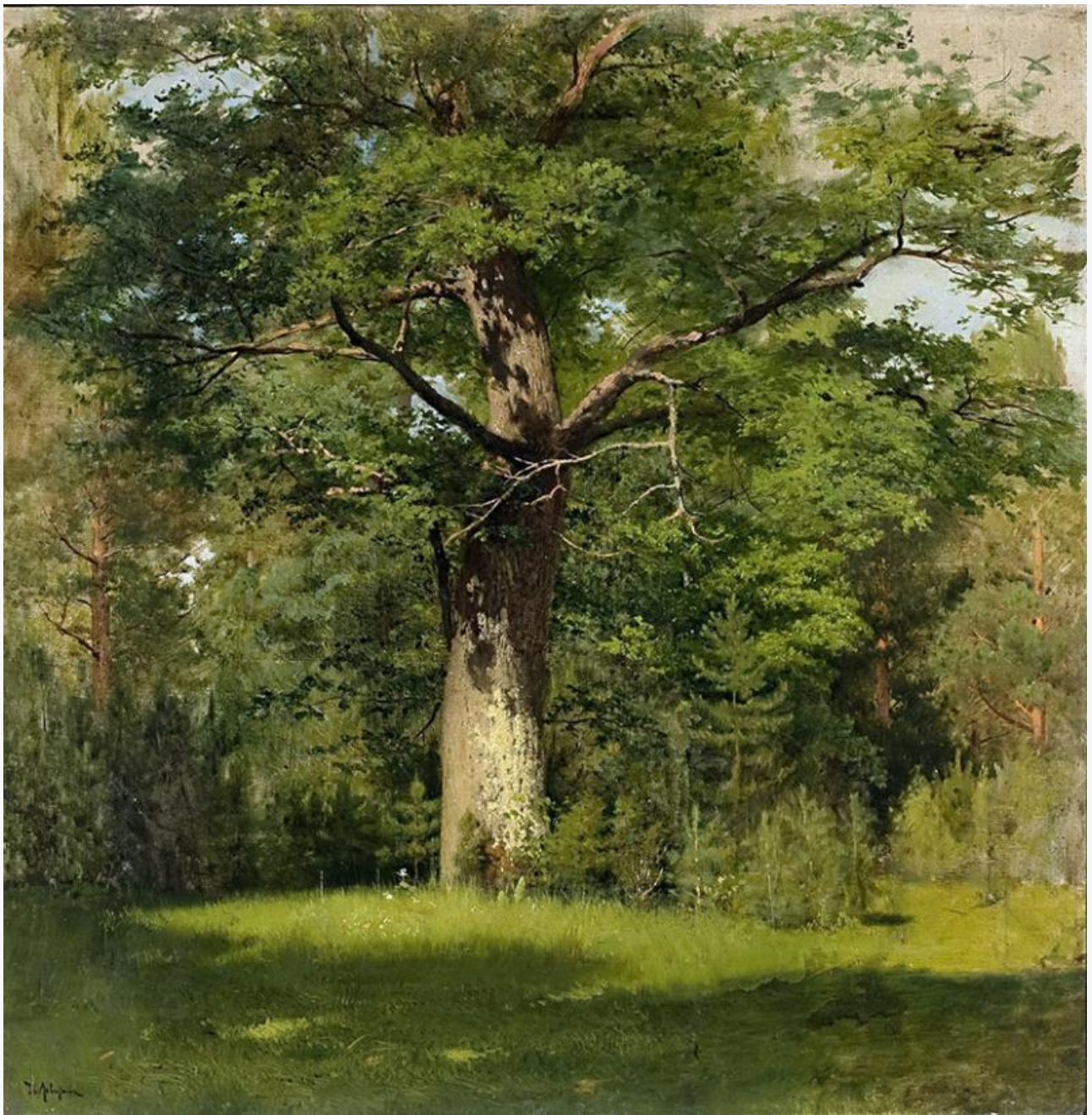
Дуб, 1880. Хранится в Третьяковской галерее