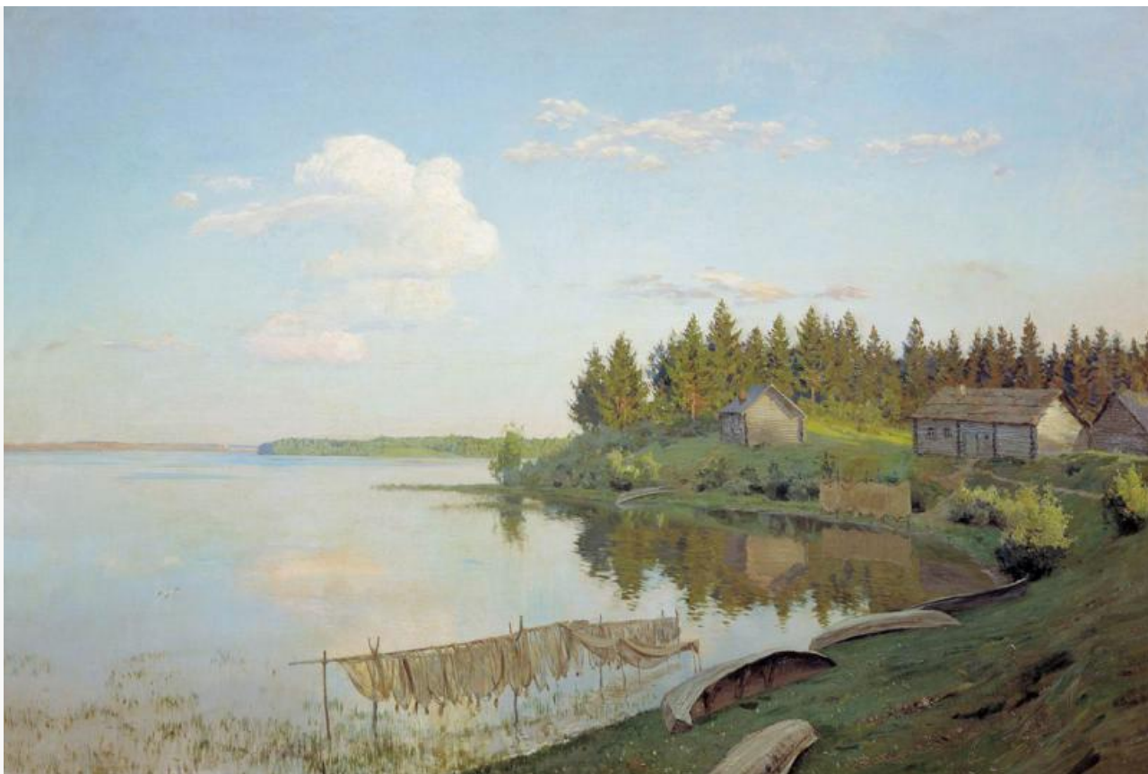
На озере (Тверская губерния), 1893. Хранится в Саратовском художественном музее