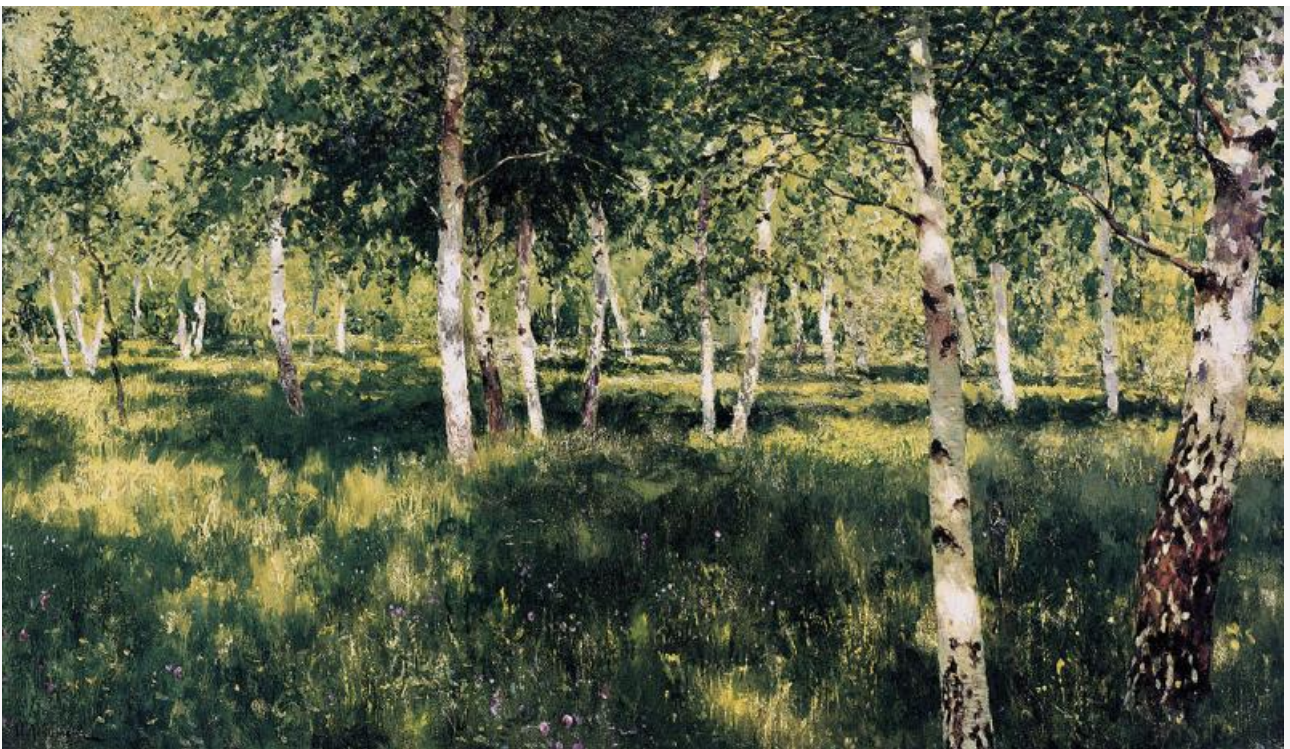
Берёзовая роща, 1885- 1889. Хранится в Третьяковской галерее