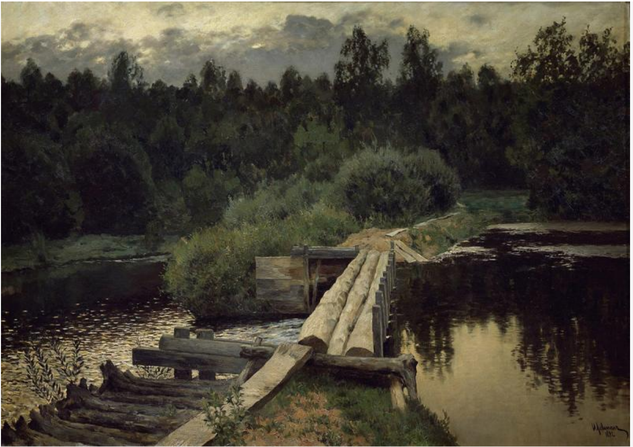
У омута, 1892. Хранится в Третьяковской галерее