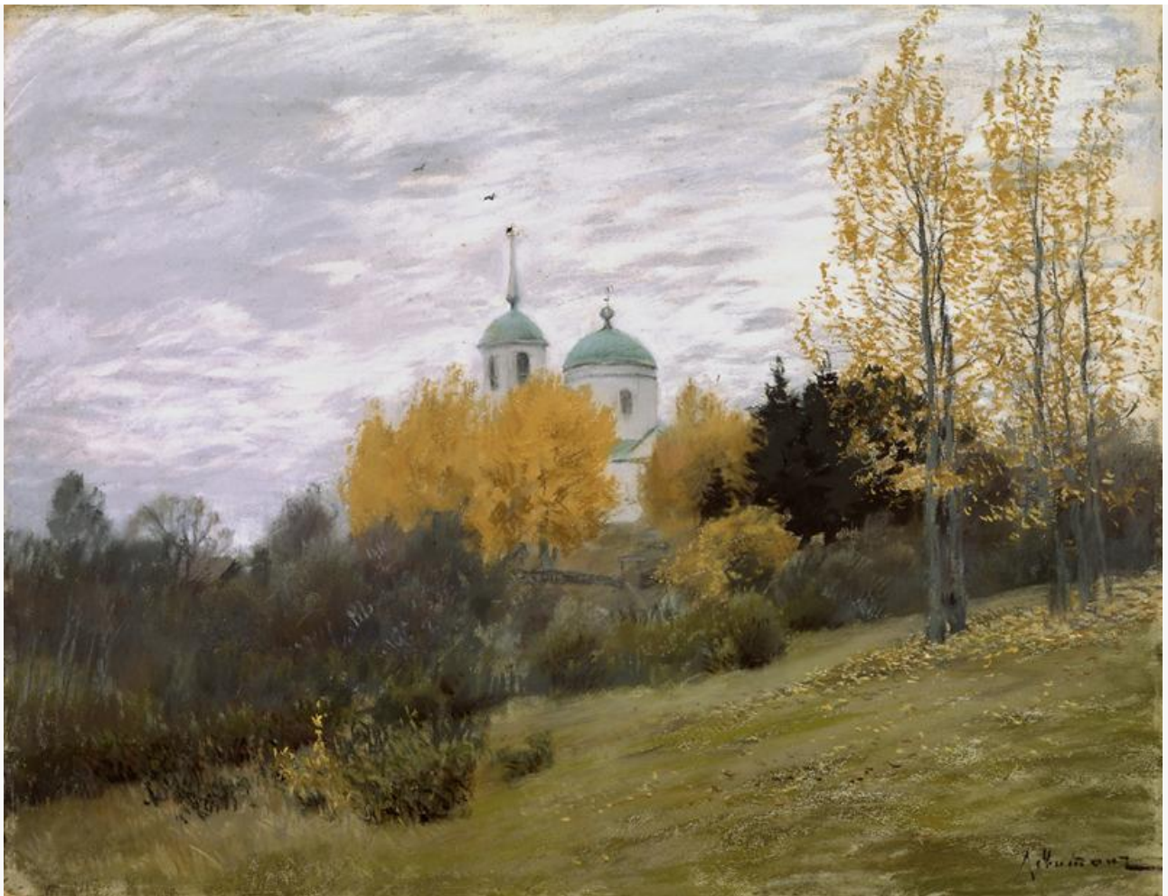
Осенний пейзаж с церковью, 1893-1895. Хранится в Третьяковской галерее