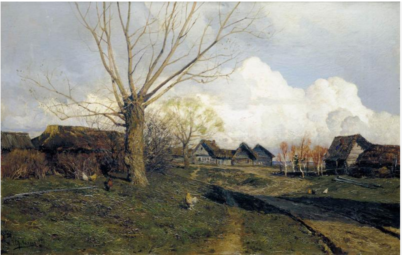
Саввинская слобода под Звенигородом, 1884. Хранится в Третьяковской галерее