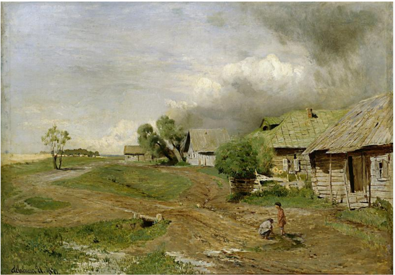
Перед грозой, 1879. Хранится в Нижегородском художественном музее