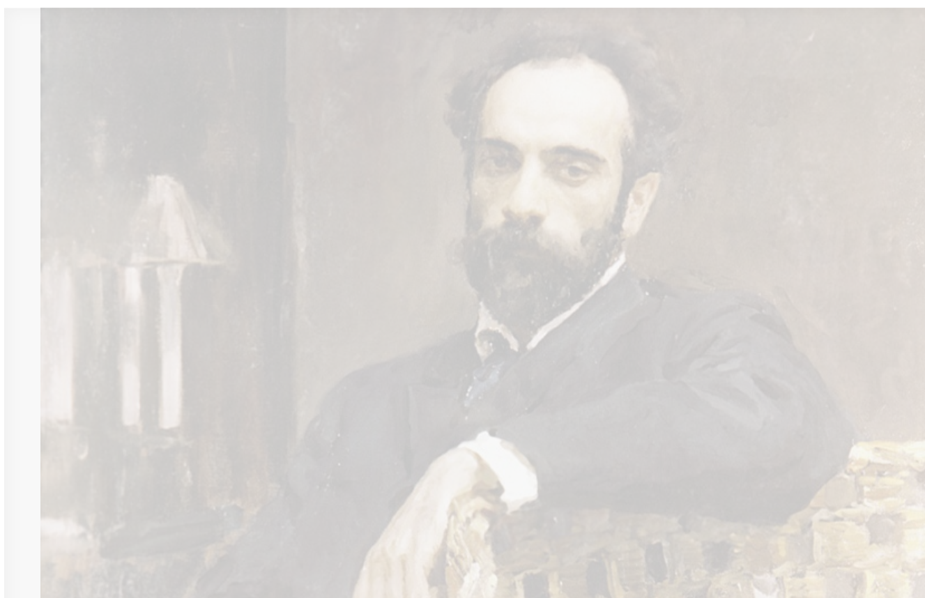
Исаак Левитан. Портрет кисти Валентина Серова (фрагмент)

30 августа исполнилось 160 лет со дня рождения великого русского художника, признанного мастера пейзажа, академика Императорской академии художеств Исаака Левитана.