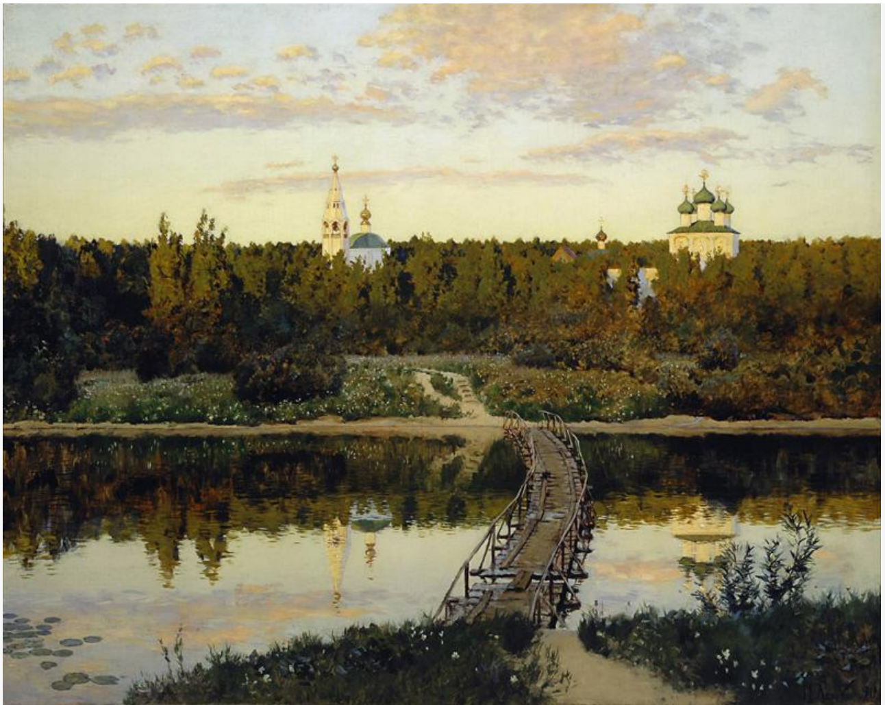
Тихая обитель, 1890. Хранится в Третьяковской галерее