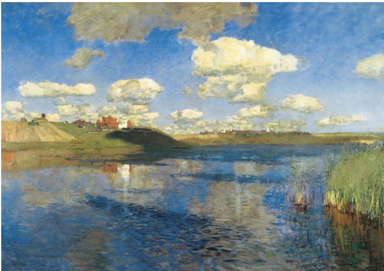
Озеро, 1899-1900. Хранится в Русском музее