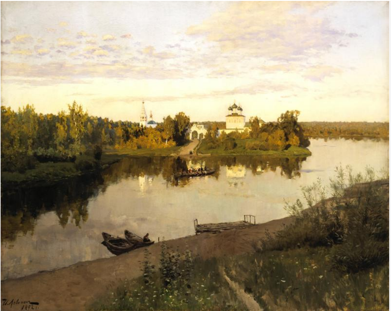
И. Айвазовский 1892 г. Вечерний звон, 1892. Хранится в Третьяковской галерее