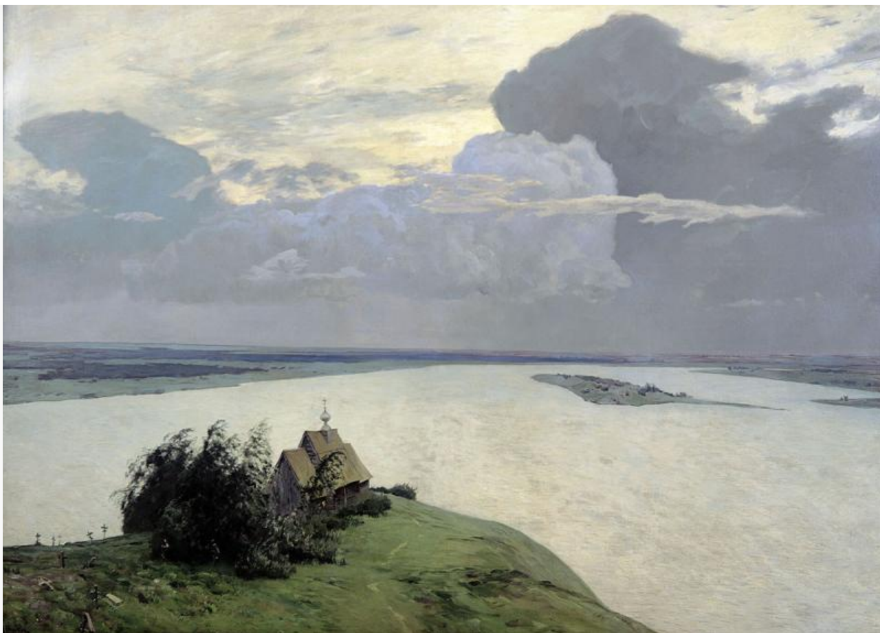
Над вечным покоем,