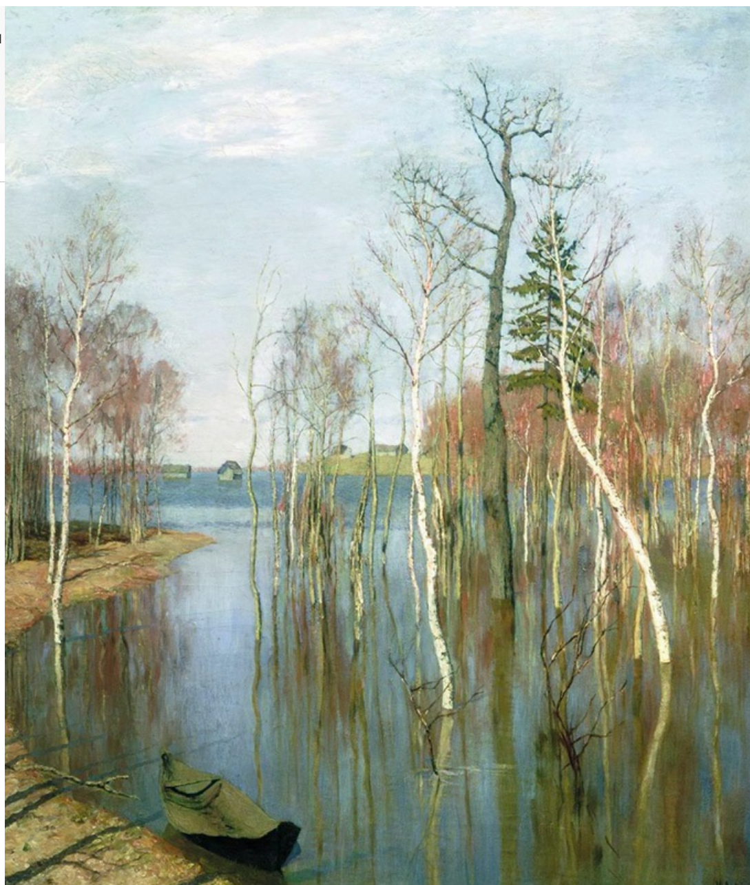
Весна. Большая вода, 1897. Хранится в Третьяковской галерее