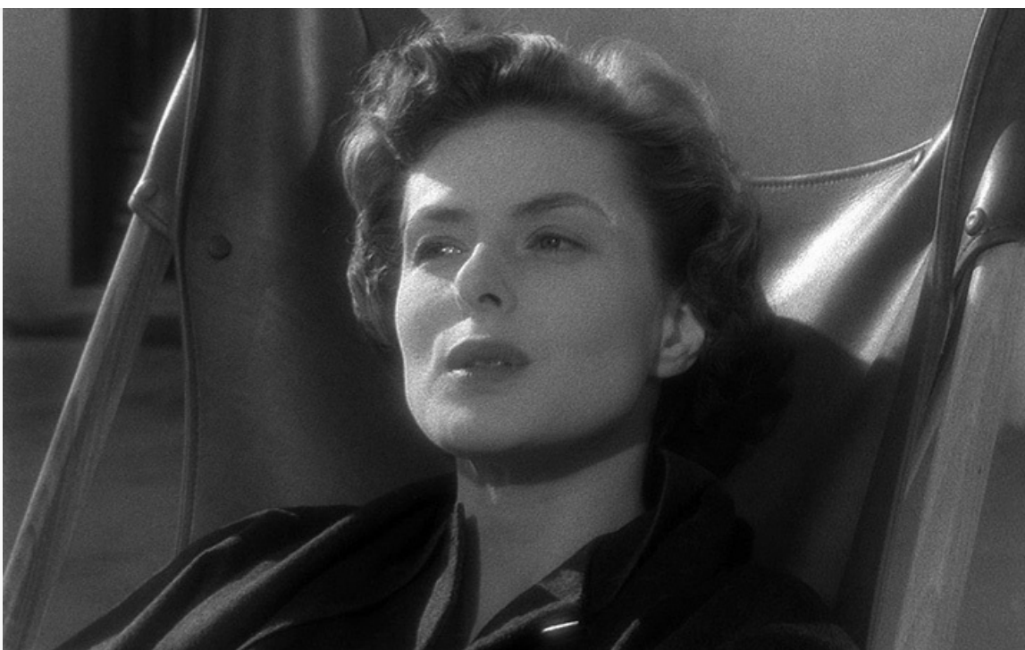
«Путешествие в Италию». Франция, Италия, 1954 год

На следующий год после возвращения в Голливуд Ингрид Бергман получила своего второго «Оскара» за лучшую женскую роль в фильме «Анастасия». Спустя ещё три года актриса была удостоена именной звезды на Голливудской «Аллее славы».