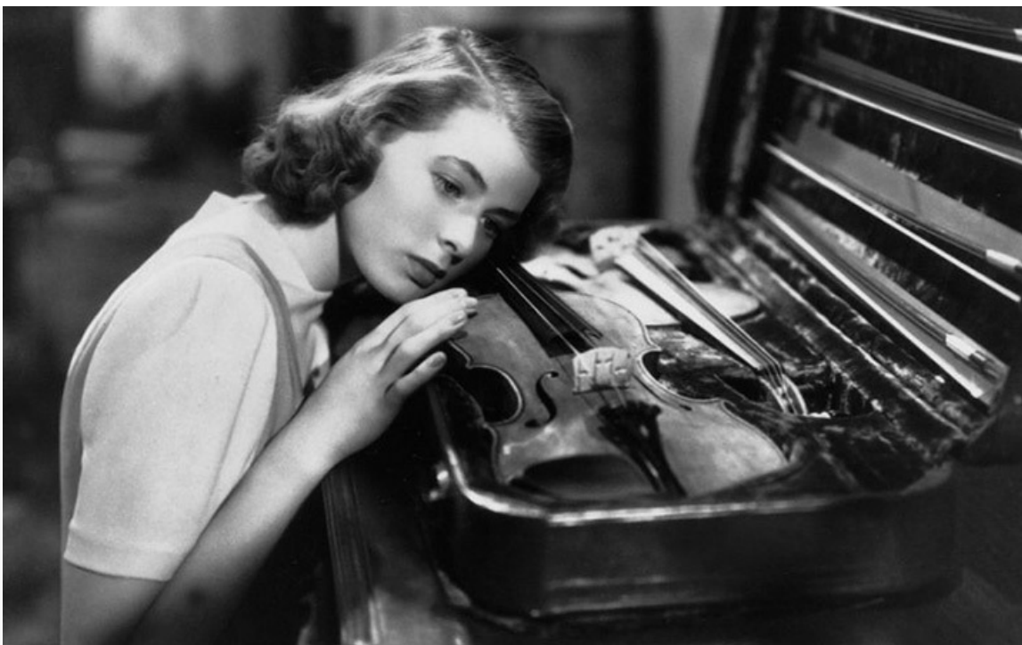
«Интермеццо». США, 1939 год

После успеха «Интермеццо» последовали новые голливудские контракты. Сначала на фильм «Доктор Джекилл и мистер Хайд», затем на съёмки в «Ярости в небесах», «Касабланке», «По ком звонит колокол» и «Газовом свете».