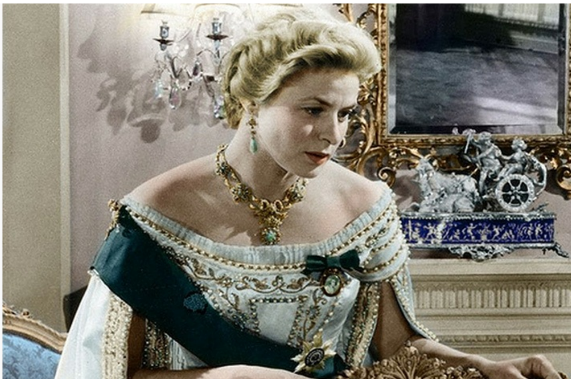
«Анастасия». Премии «Оскар», «Золотой глобус» и «Давид ди Донателло», 1956 год