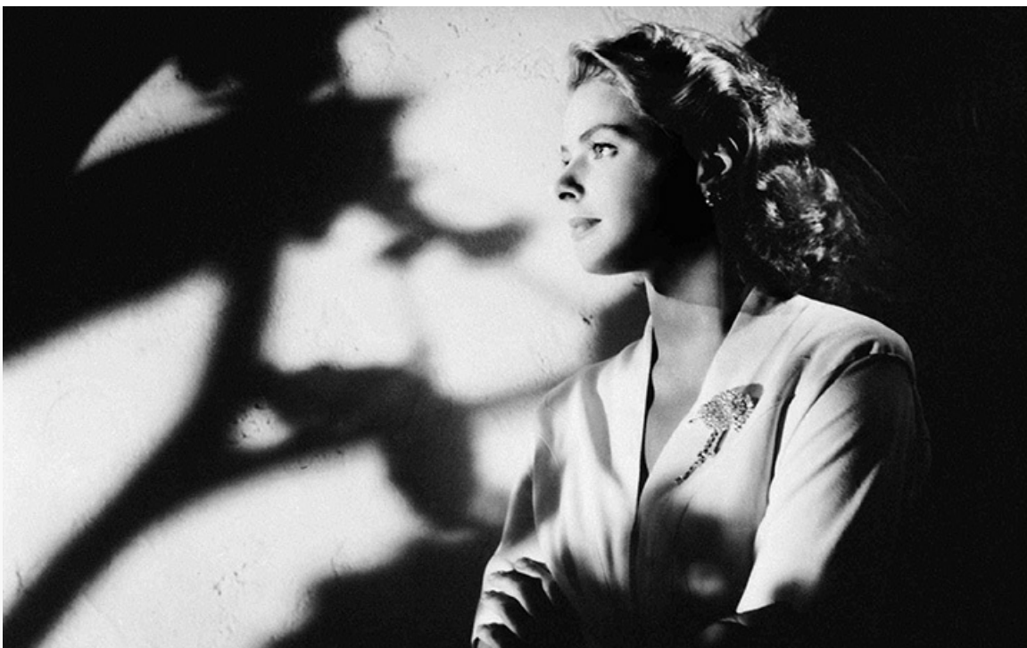
«Касабланка». США, 1942 год