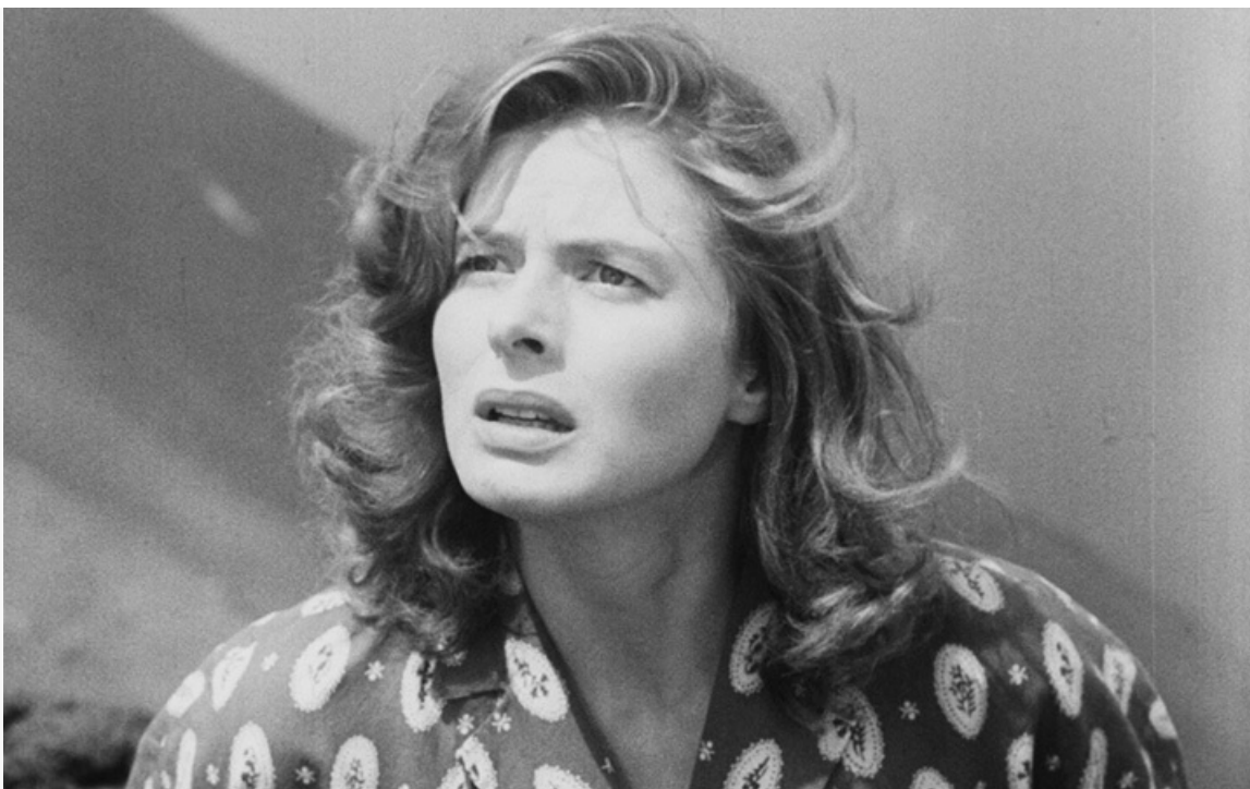
«Стромболи, земля Божья». Италия, США, 1950 год