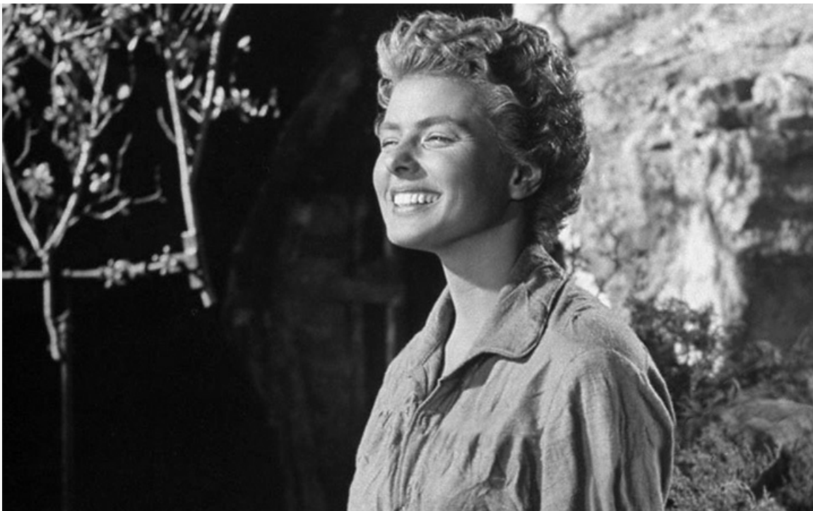
Номинация на «Оскар», США, 1943 год