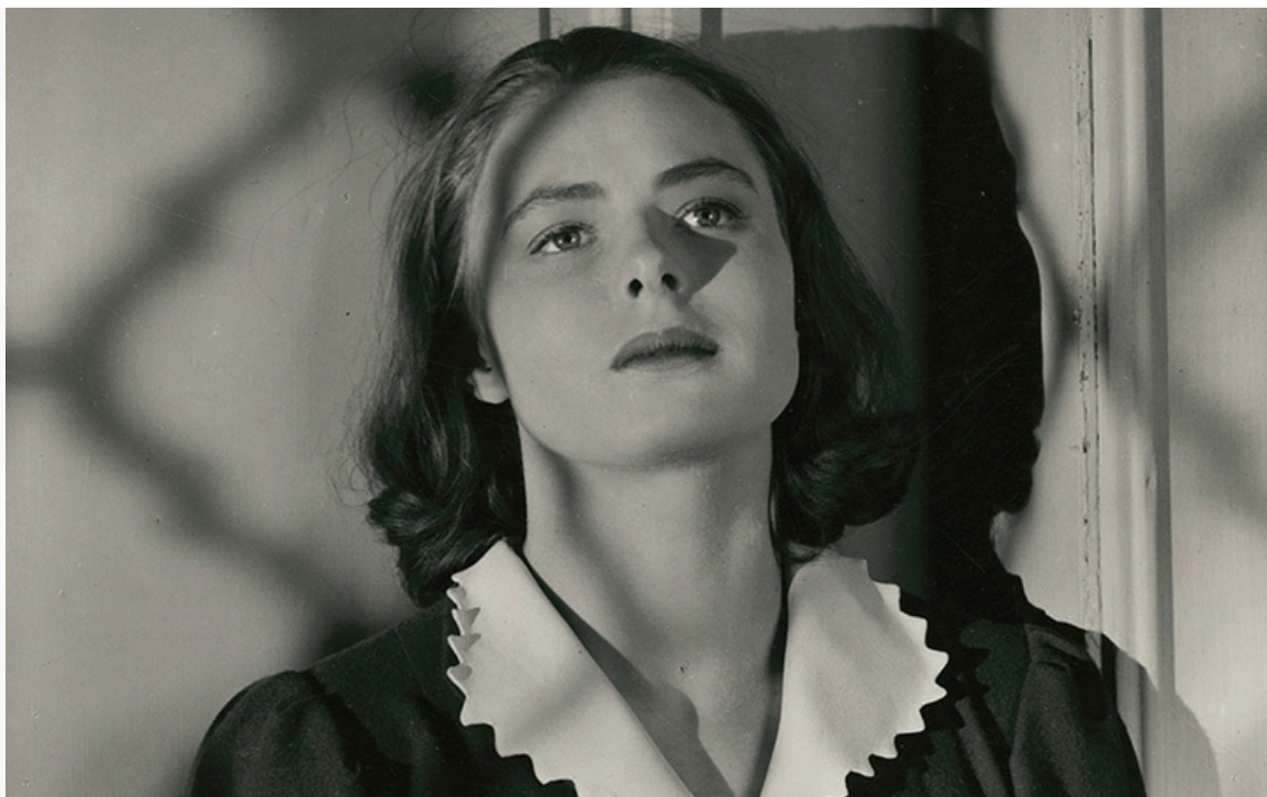
женщины». Швеция, 1938 год