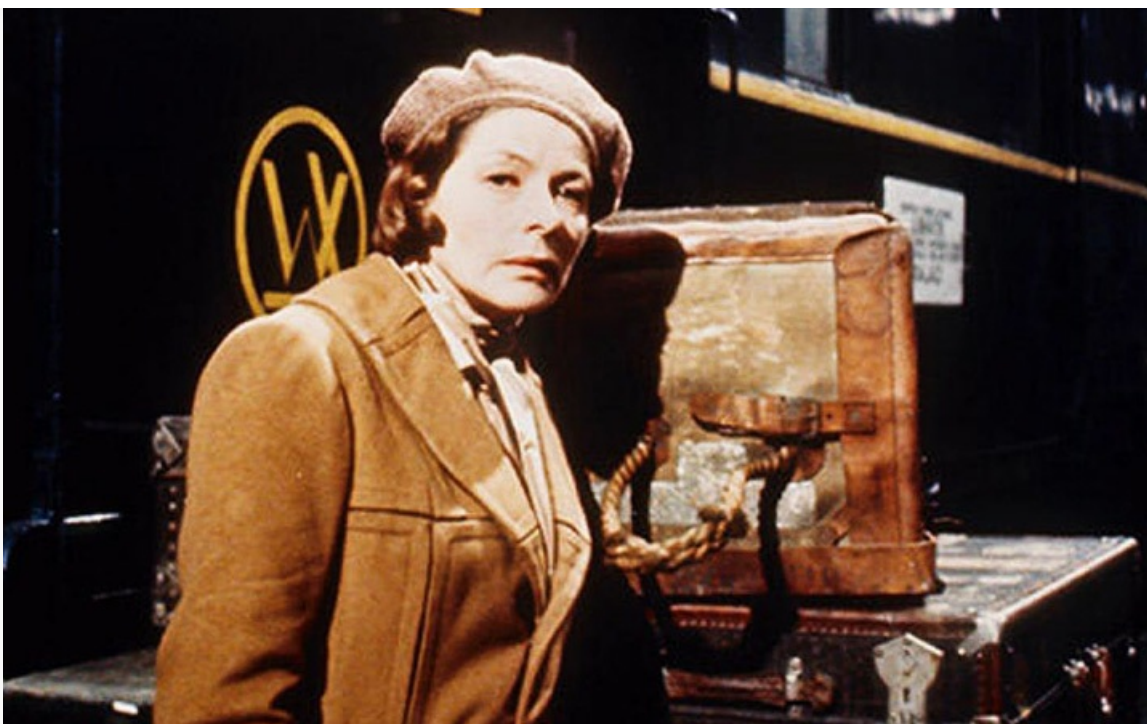
экспрессе». Премии «Оскар» и ВАФТА, Великобритания, США, 1974 год

Со смертельной болезнью актриса боролась девять лет, сыграв за это время одни из лучших своих ролей.