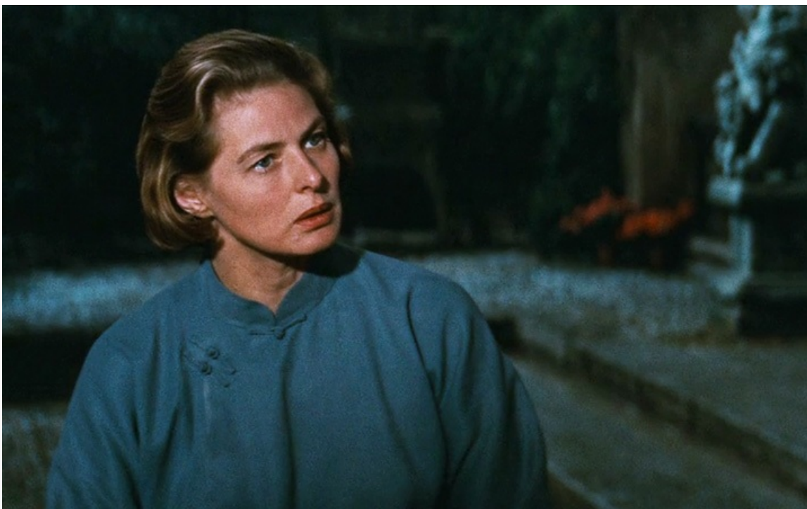
«Постоялый двор шестой степени счастья». Номинации на премии ВАФТА и «Золотой глобус», США, 1958 год