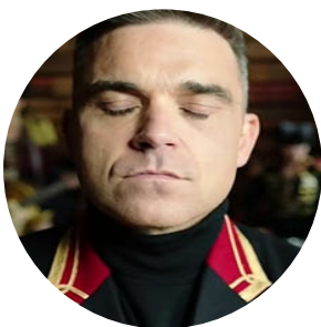
Автор текста: Камиль Фахрутдинов , обозреватель.

На сайте опубликовано 268 текстов этого автора.