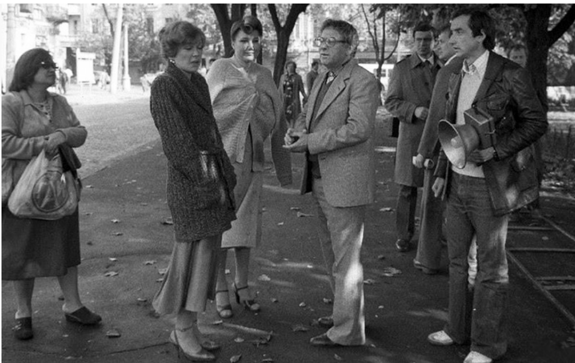
Тодоровский на съёмках фильма «Любимая женщина механика Гаврилова»