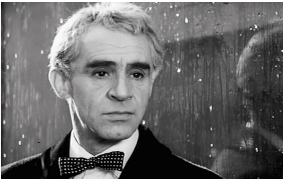
«Фокусник», 1968 год