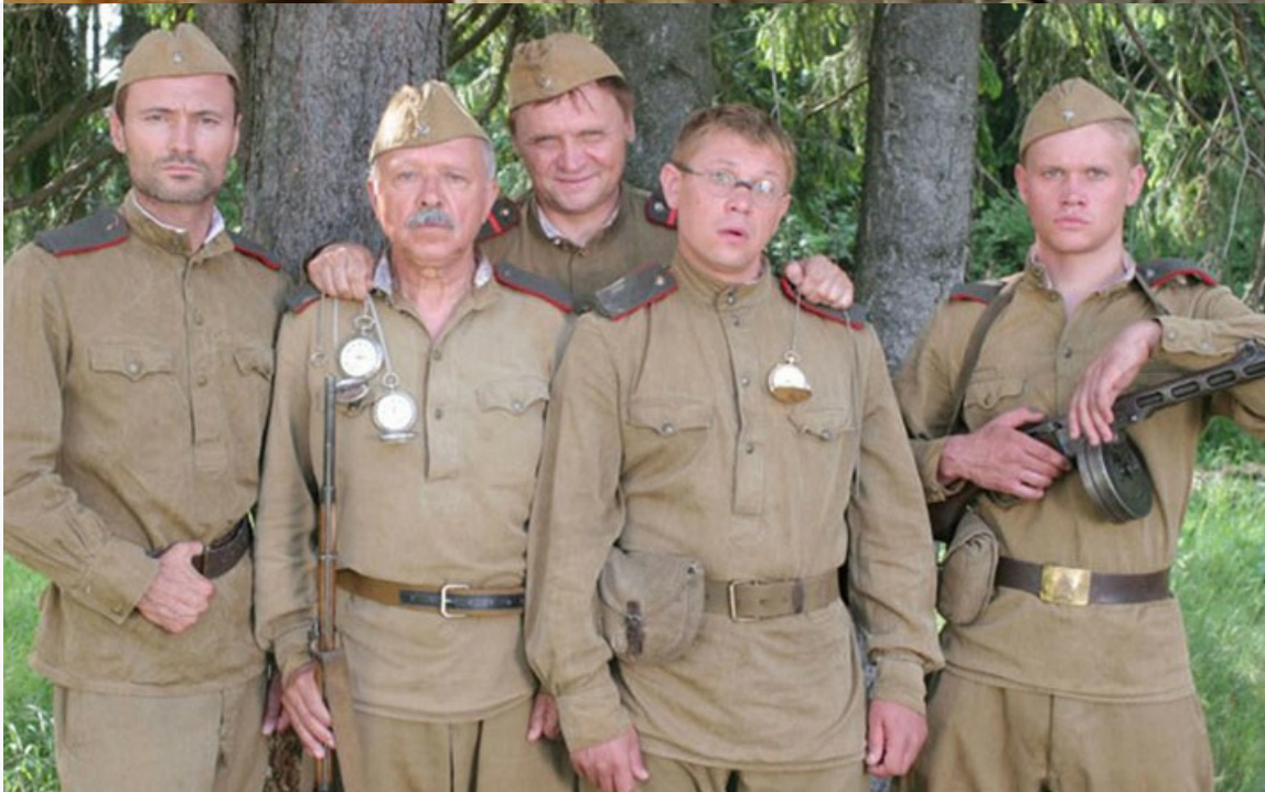
«Риорита». Последняя работа мастера, 2008 год