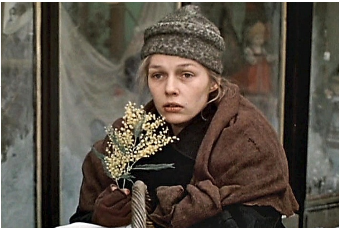
Кадр из фильма «По главной улице с