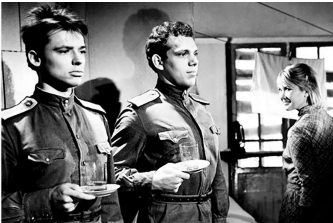
«Верность», 1965 год