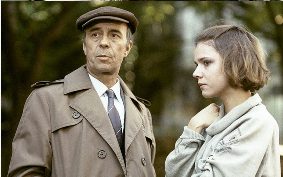
оркестром», 1986 год

В 1983 году режиссёр снял самый знаменитый свой фильм «Военно-полевой роман», который был номинирован на «Оскар» как лучший фильм на иностранном языке, принёс Инне Чуриковой «Серебряного медведя» Берлинского кинофестиваля, а Петру Тодоровскому звание народного артиста РСФСР.