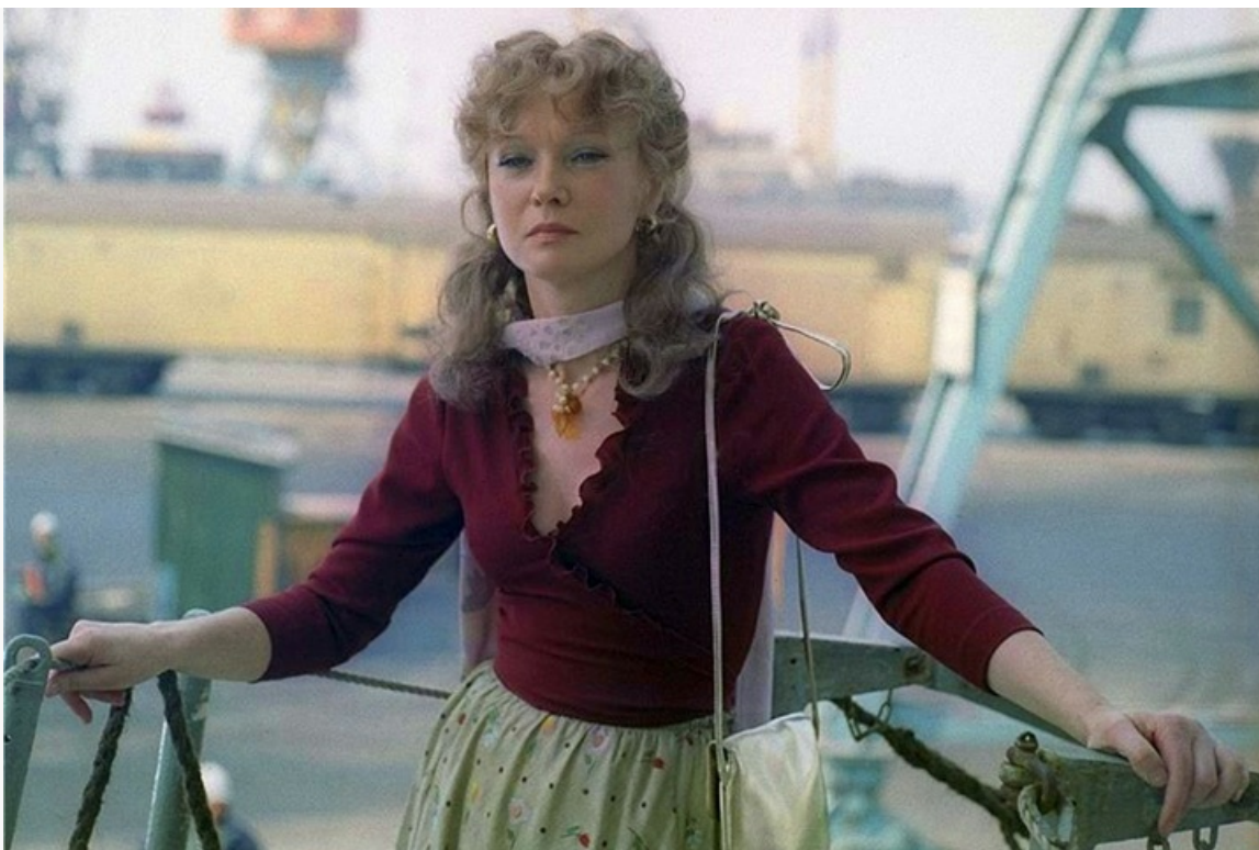
Гаврилова», 1981 год