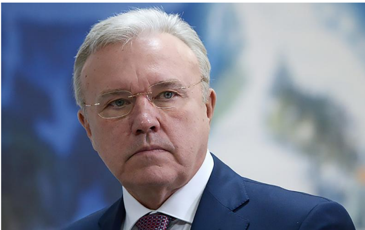
Александр Усс Губернатор Красноярского края

Мы неоднократно обращали внимание на странно стабильный доход губернатора Красноярского края Александра Викторовича Усса. 2019 год не стал исключением.