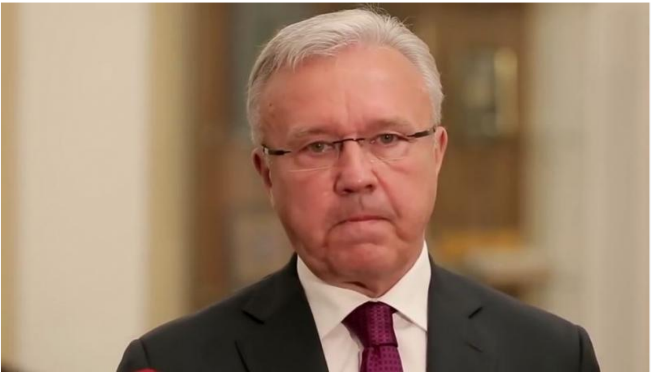
Губернатор Красноярского края Александр Усс

Нарушение сроков подачи деклараций должны проверяться специальной комиссией. Но в комиссии по координации работы по противодействию коррупции, состав которой утверждён 28 мая 2020 года, всё те же лица.