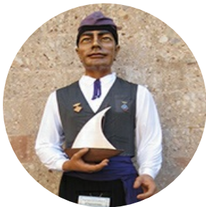
Автор текста: Андрей Воронецкий , журналист.

На сайте опубликовано 14304 текстов этого автора.