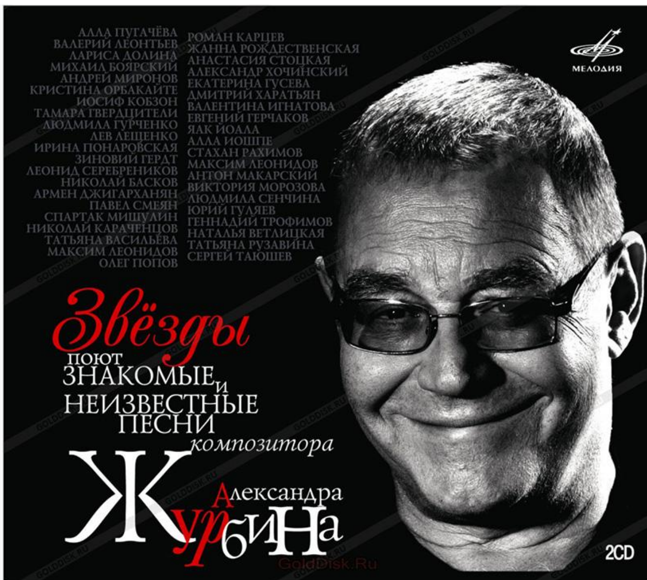
Обложка издания дисков с песнями Александра Журбина

Сегодня король мюзикла увлечён жанром академической оперы.