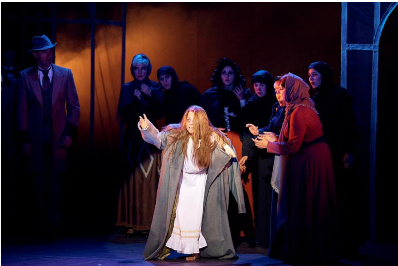
Сцена из спектакля «Униженные и оскорблённые». Железногорский театр оперетты, постановка 2019 года

С 1990 по 2001 год Александр Журбин жил и творил в США, где получил от The New York Times прозвище «Русский Бернстайн» и организовал первый русско-американский театр «Блуждающие звёзды», в котором работали многие советские эмигранты.