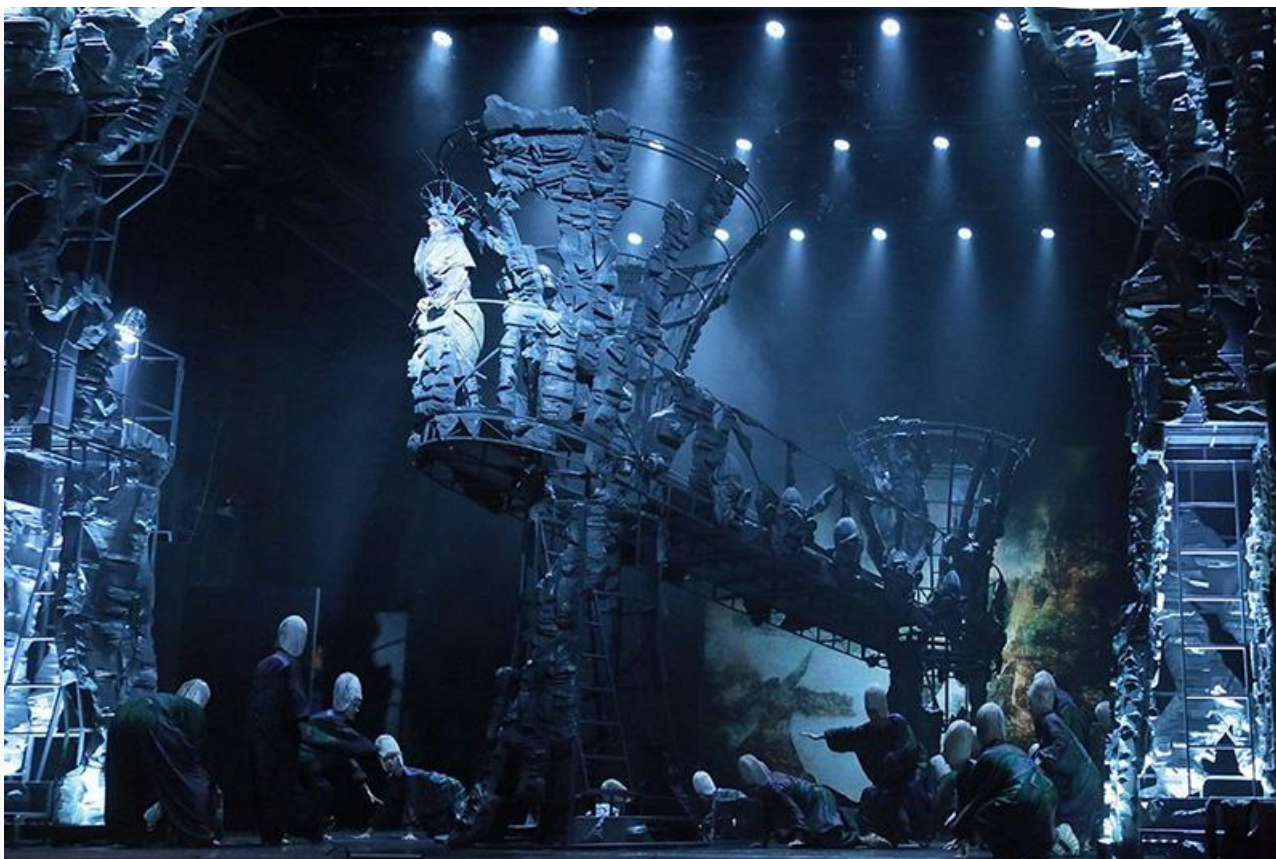
Сцена из спектакля «Орфей & Эвридика». Свердловский театр музыкальной комедии, постановка 2017 года

Сегодня в России вряд ли найдётся музыкальный театр, в котором не звучала музыка Журбина.