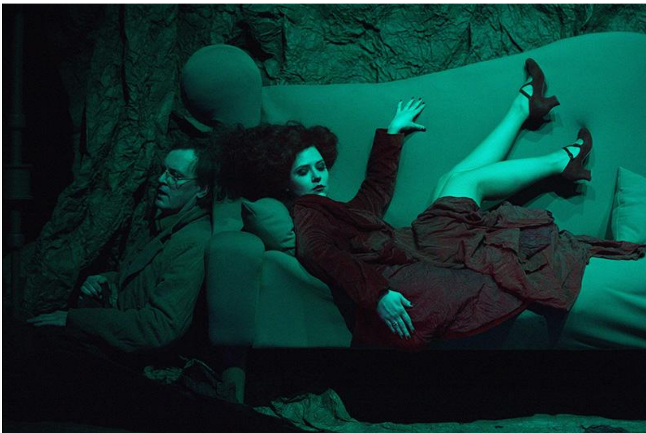
Сцена из спектакля «Метаморфозы любви». Театр Станиславского и Немировича-Данченко, постановка 2017 года

Кроме музыки маэстро Журбин пишет книги, одна из которых символично называется «Композитор, пишущий слова». В 2016 году в издательстве «Композитор» вышла очередная книга воспоминаний маэстро «О временах, о музыке и о себе».